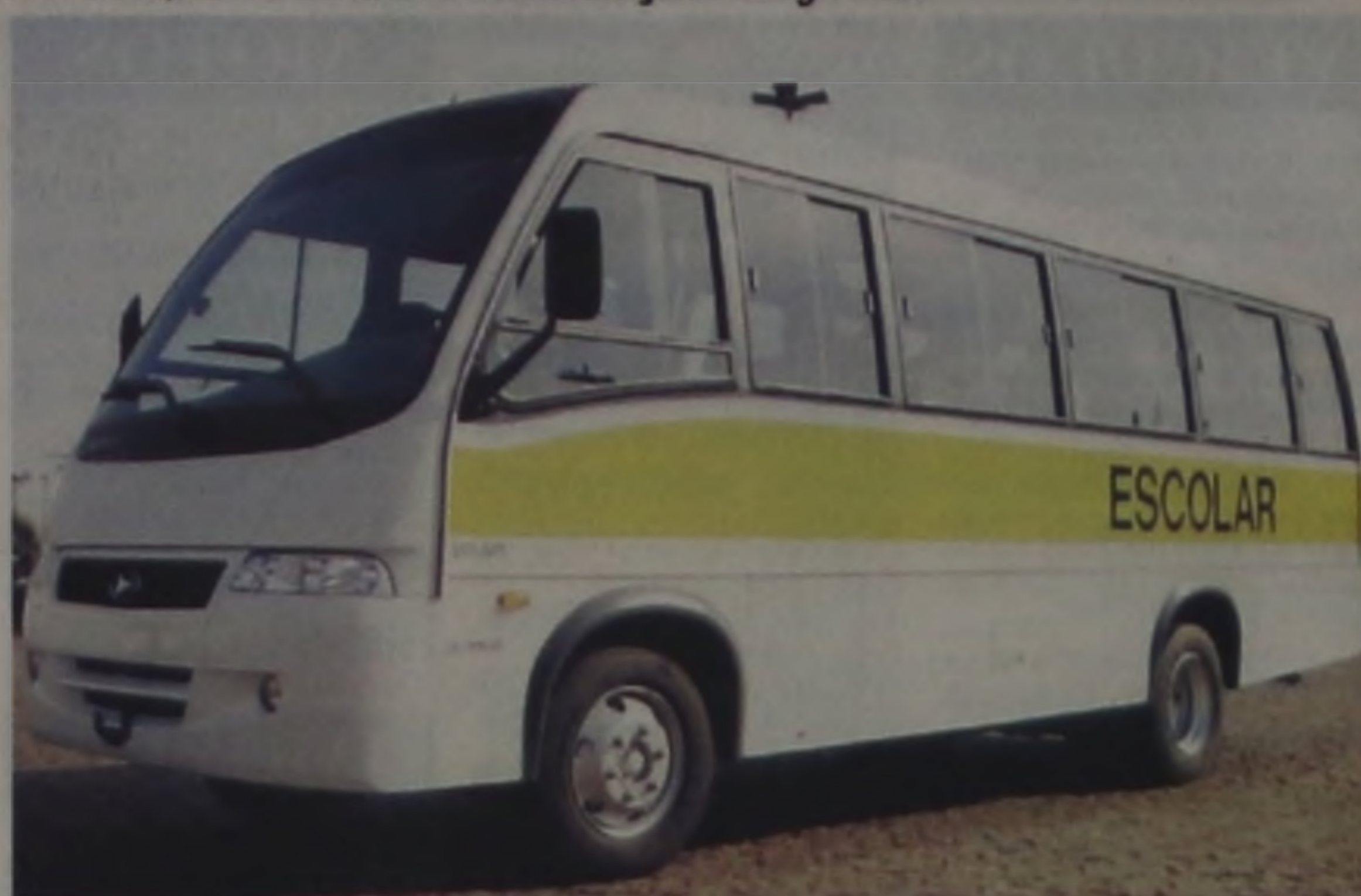
Microônibus deverá ser utilizado pela Diretoria Municipal de Educação

O valor da emenda seria de R$ 140 mil, com previsão de contrapartida de 20% do Município. Ou seja, a Prefeitura investiria no bairro mais R$ 28 mil. "Com mais este investimento na casa de R$ 168 mil seria possível pavimentar mais 10 mil metros quadrados no bairro. Seria outro passo importante neste projeto que temos nos empenhado muito, que é asfaltar todo o Conjunto Maestro Júlio Ferrari", afirmou o prefeito.