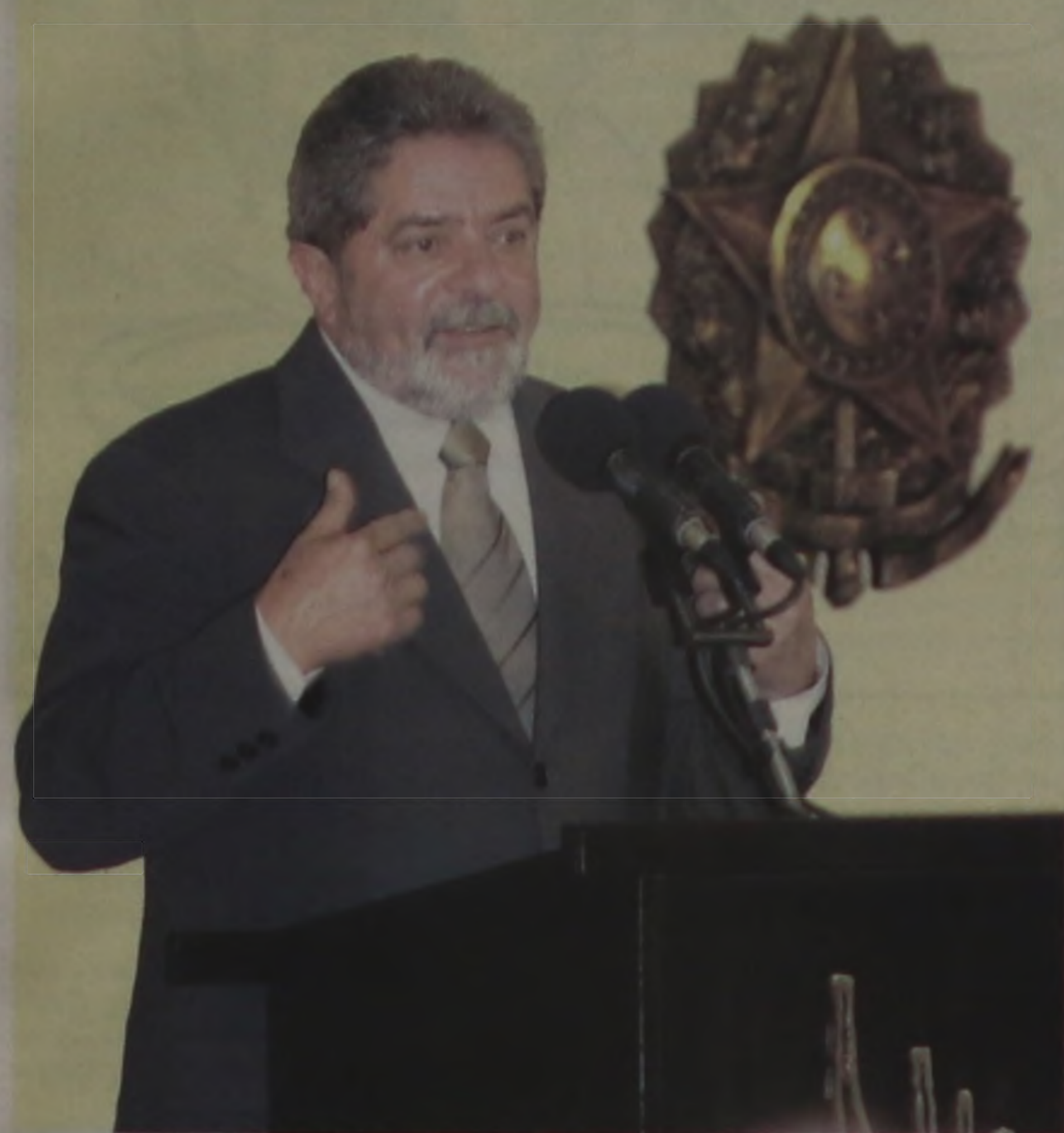
Lula reuniu-se com FHC, no Palácio do Planalto e, depois, falou aos jornalistas