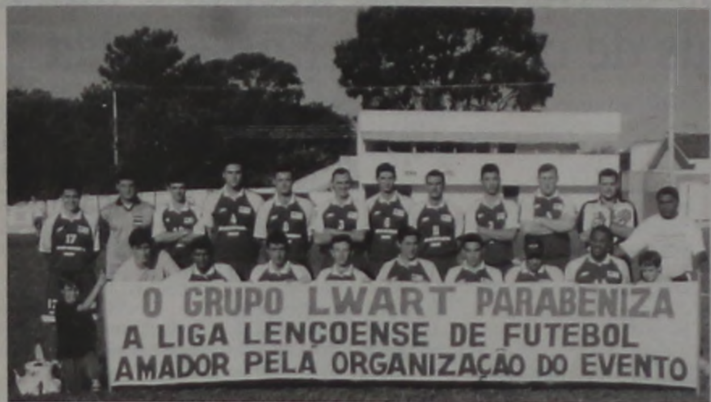
O GRUPO LWART PARABENIZA A LIGA LENÇOENSE DE FUTEBOL AMADOR PELA ORGANIZAÇÃO DO EVENTO

Grêmio Lwart enfrenta a UME às 15h00 na ADC