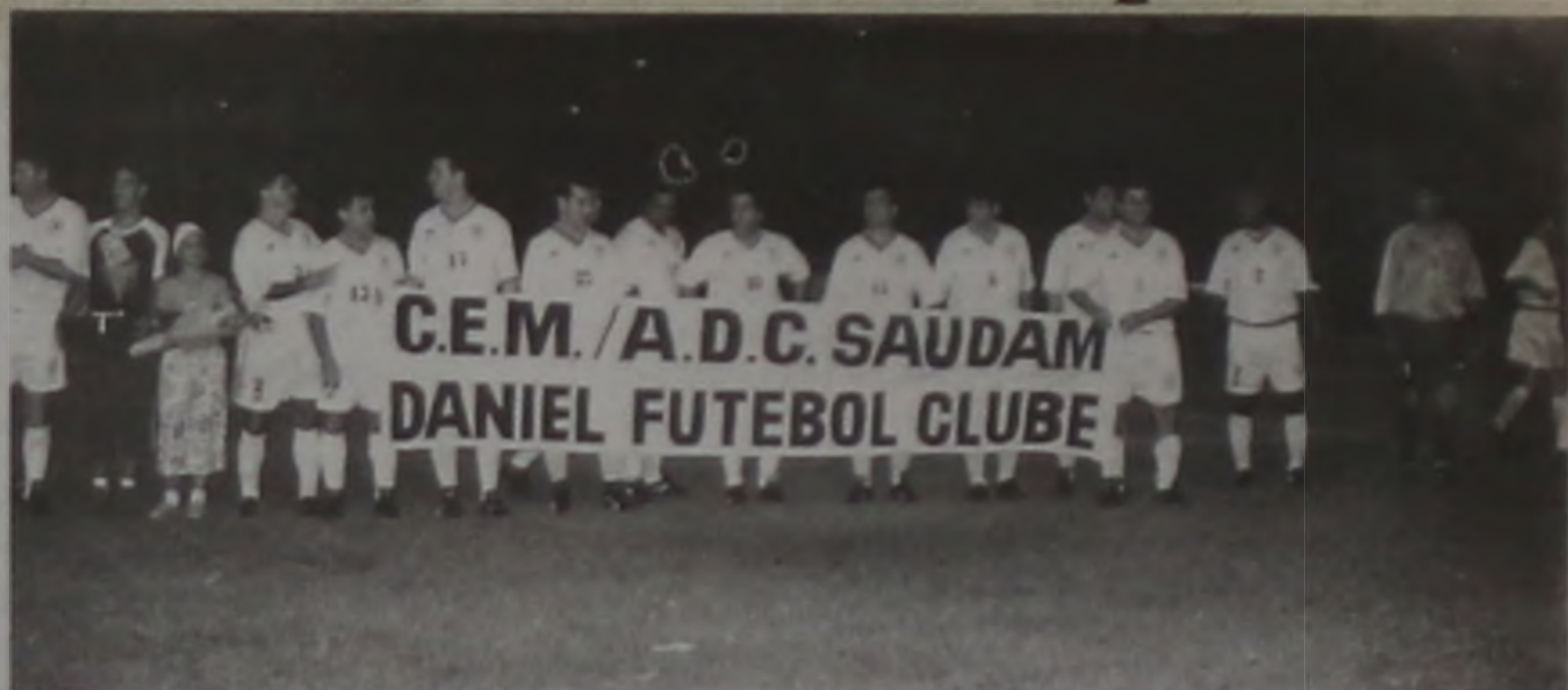
Jogadores do CEM/ADC saúdam equipe do Daniel Futebol Clube

A equipe do CEM/ADC disputou na última quarta-feira, 30, na cidade de São Manuel, a final da Copa Mercosul de Futebol Máster contra o time do Daniel Futebol Clube, do cantor Daniel. Cerca de dez mil pessoas das cidades da região compareceram ao estádio municipal "Adhemar de Barros", para ver o cantor Daniel que jogou até os 10 minutos do segundo tempo.