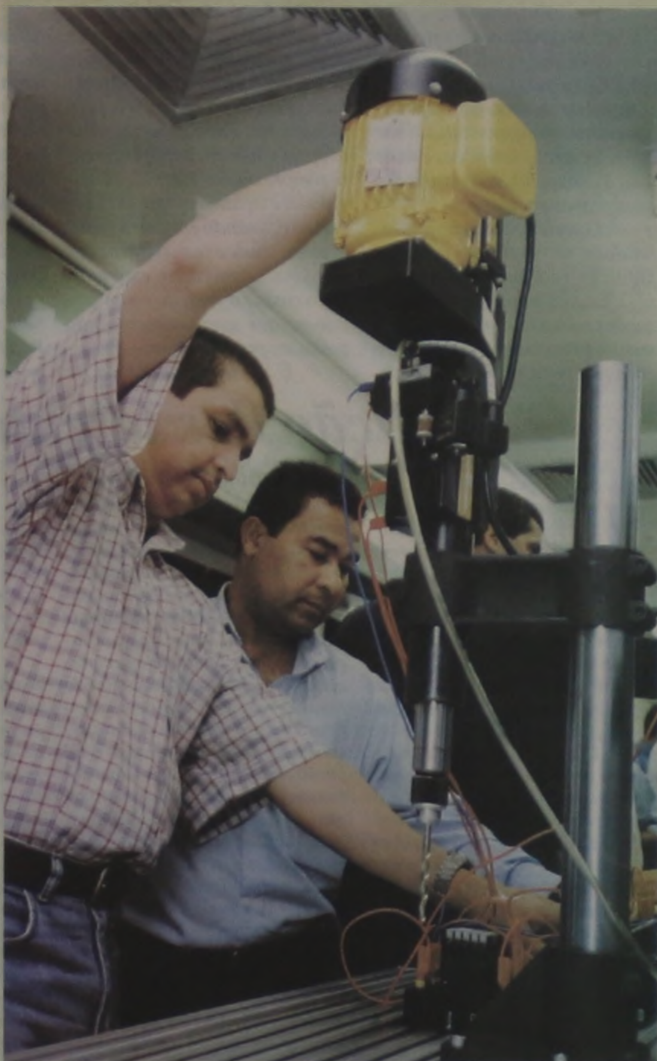
SENAI - A Escola Senai vai manter neste sábado o plantão de inscrições para o curso técnico de eletrônica industrial. O curso de nossa escola é um dos mais requisitados e atrai candidatos de grande número de cidades.