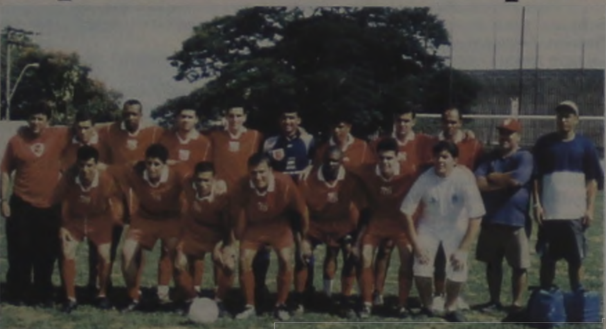
Jogadores e comissão técnica do Expressinho/ADC

O Expressinho/ADC conquistou no último domingo, dia 17, no estádio municipal Archangelo Brega o título de campeão do Campeonato Amador Municipal 2002 ao bater a agremiação do Grêmio Vila Cruzeiro pelo placar