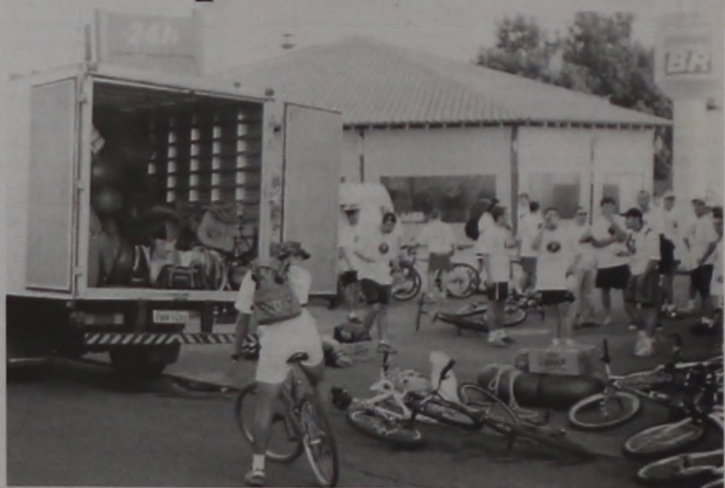
Ciclistas durante a realização do 1º Desafio