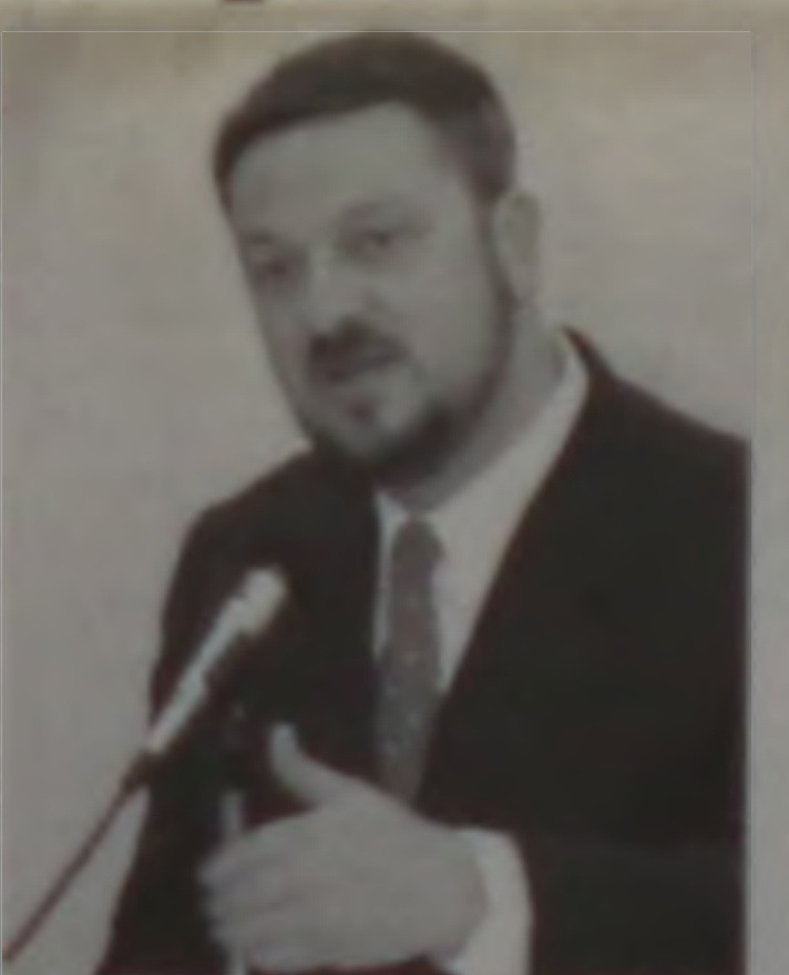
Palocci reafirma compromisso de ajuste das contas públicas

O ministro Palocci anunciou que divulgará nas próximas semanas as metas econômicas do governo Lula. "Essas metas deixarão claro nosso compromisso com uma gestão responsável e consistente do orçamento", acrescentou.