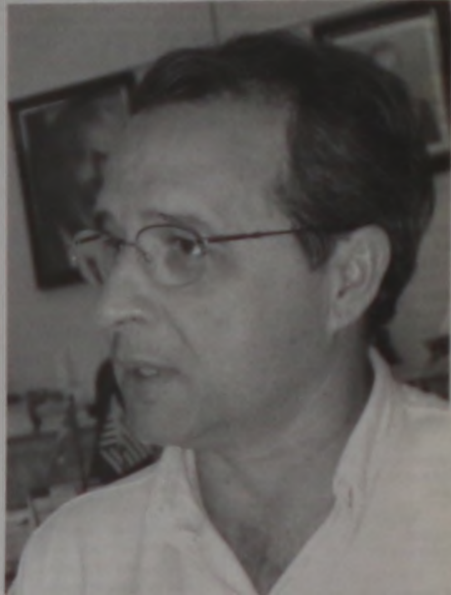
"Acredito que poucas cidades do porte de Lençóis tem condições de fazer este conjunto de obras"

Outro anúncio é o, já assinado com o governo federal, convênio de liberação de R$ 285 mil para a construção do Pronto Socorro Municipal. Ele espera que o dinheiro seja liberado até o segundo semestre deste ano para dar início as obras.