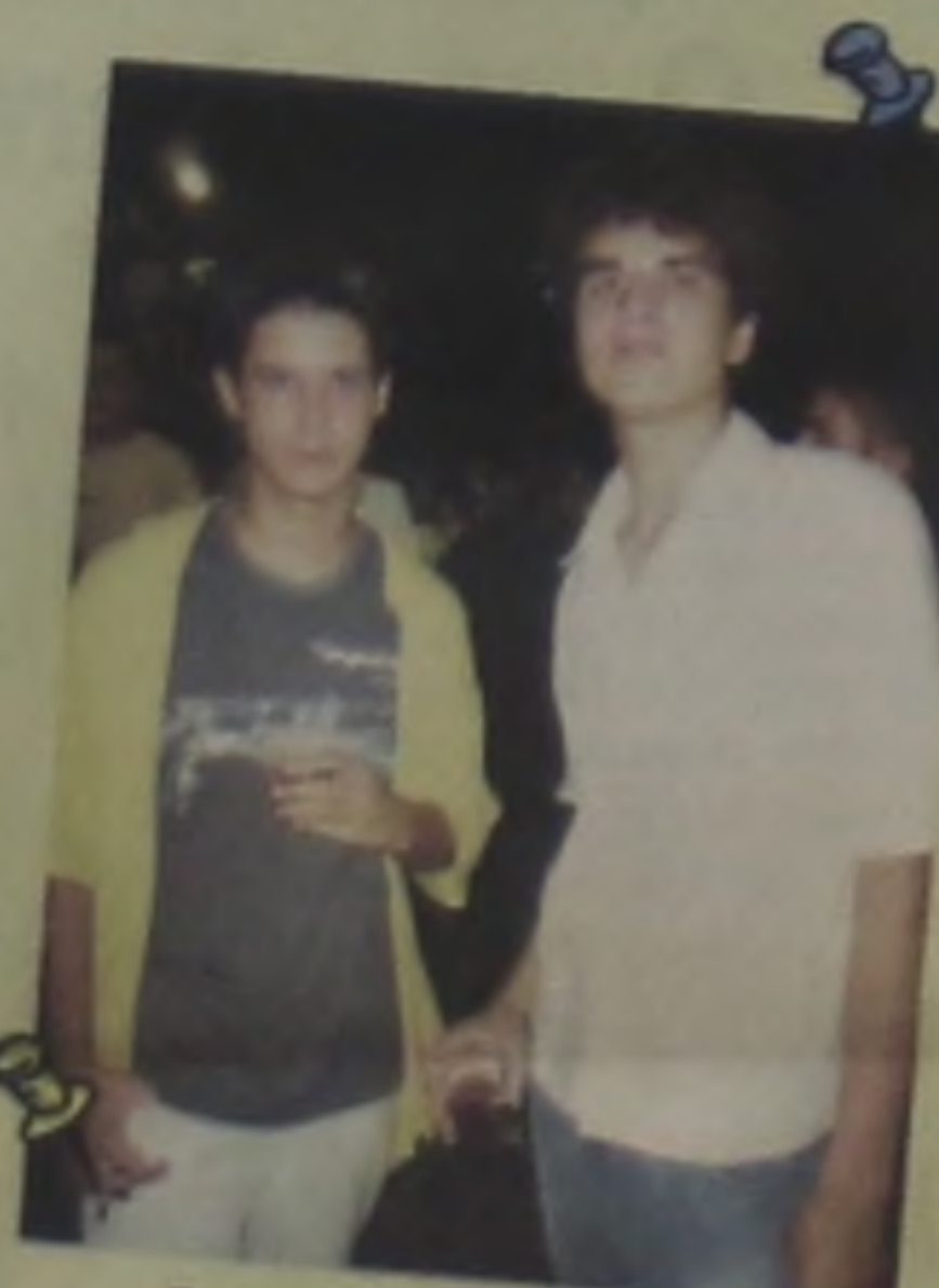
Reveillon no CEM: Sucesso garantido.

ESPECIAL REVEILLON