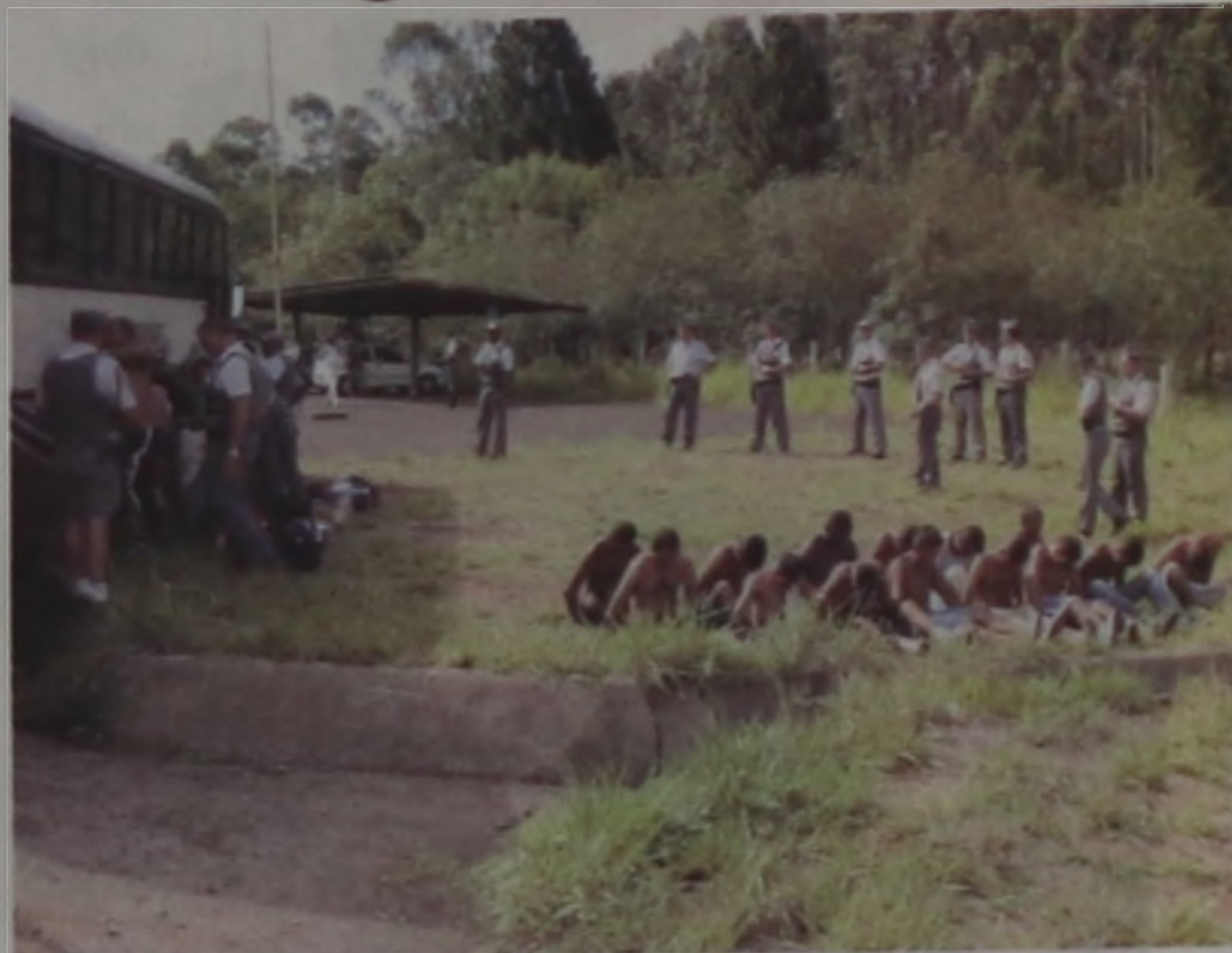
Os ônibus com os detentos foram levados para a base da Polícia rodoviária, em Agudos, onde passaram por um "pente fino".

Nos anos anteriores registraram-se apenas pequenos incidentes. Contudo, o conflito registrado desta vez