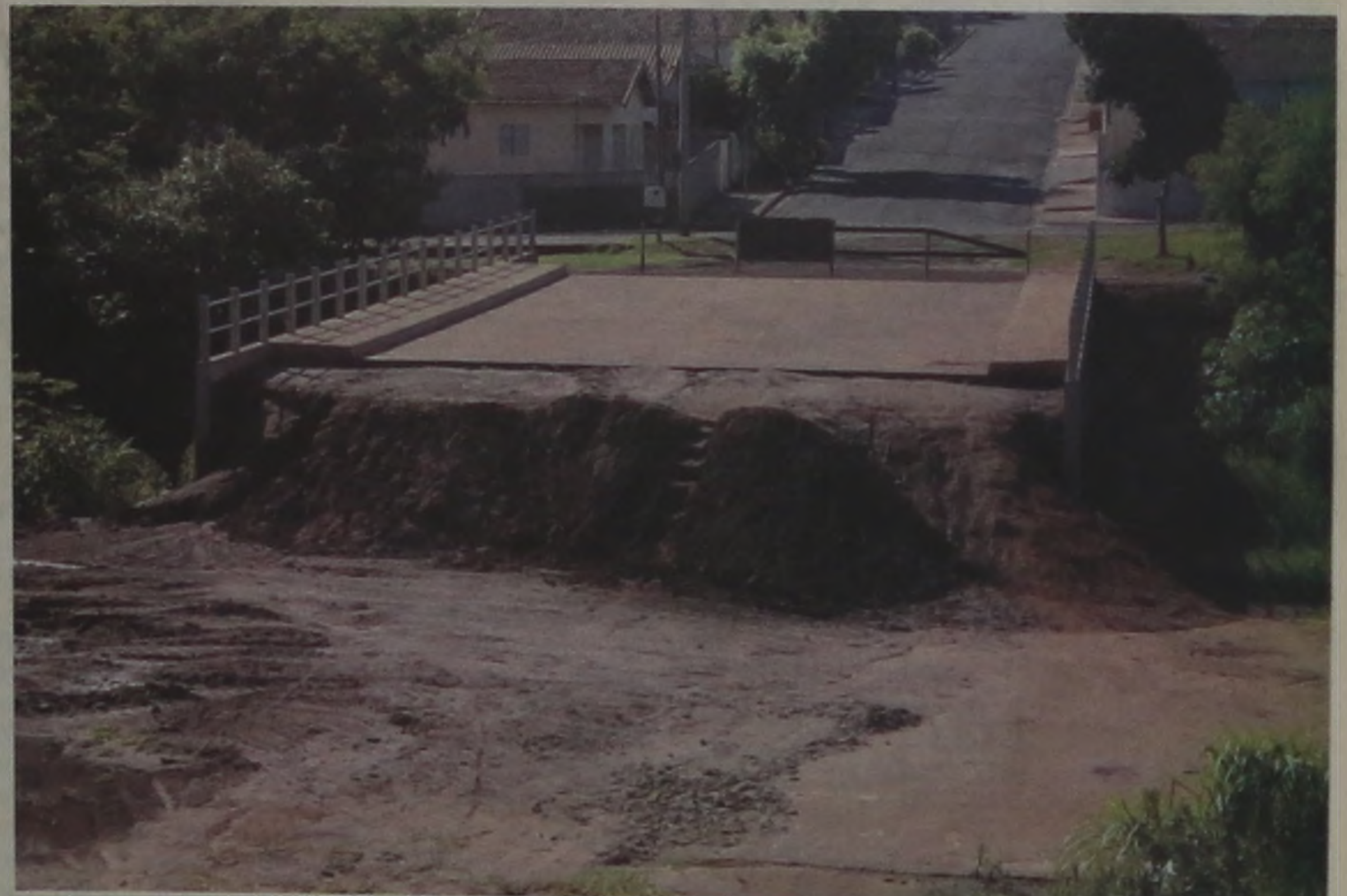
A PONTE - A ponte de ligação entre as vilas Contente e Maria Cristina está provocando a impaciência dos moradores. Assim que viram sua colocação no local, ficaram esperançosos, mas agora não conseguem esconder o desconforto pela demora da Prefeitura em concluir suas laterais.

bros da entidade estiveram reunidos com moradores do Jardim Caju para tentarem resolver o problema de uma diferença (que varia de R$ 400 a R$ 600,00) emitida no boleto dos moradores do bairro. A federação entrou em contato com a Caixa Econômica Federal e recolheu o contrato das residências do Caju para analisar o caso. Na próxima terça-feira, às 19h30, no Centro Comunitário do Caju, será realizada uma reunião com os moradores do bairro e representantes da federação e associação para a possibilidade de se montar um escritório em Lençóis.