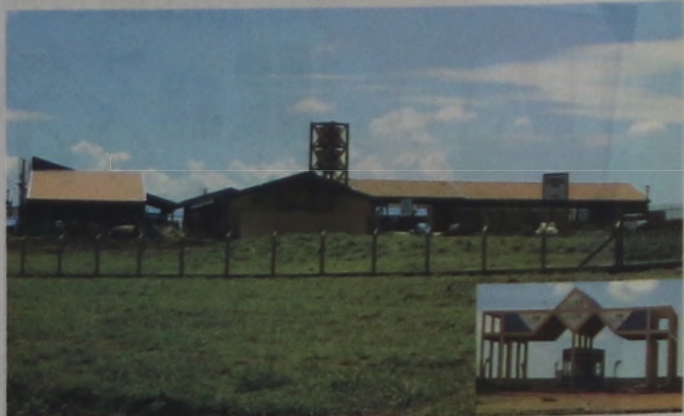
Campus da Facol: pronto para receber os alunos

há muito tempo pela comunidade. Já há alguns anos em atividade, a FACOL, até 2002, acomodava seus alunos no Colégio Francisco Garrido, no centro da cidade. A partir de segunda-feira, 10 de fevereiro, as aulas serão ministradas no novo Campus da entidade, distante dois quilômetros da cidade. Para o percurso cidade/campus, os alunos passarão a contar com os serviços de transporte coletivo, uma vez que a empresa Viação Mourão, concessionária do transporte coletivo urbano de Lençóis Paulista, ampliará suas linhas até a nova sede da faculdade.