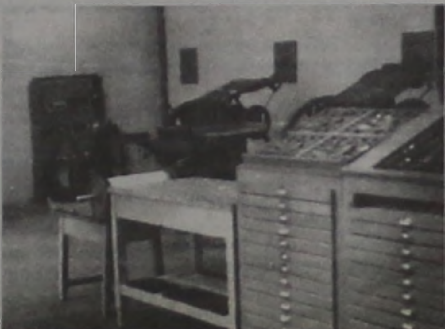
Antiga oficina gráfica

pressora manual, para a impressora elétrica, mas ainda no método que exigia a composição feita à mão, dos artigos a serem publicados.