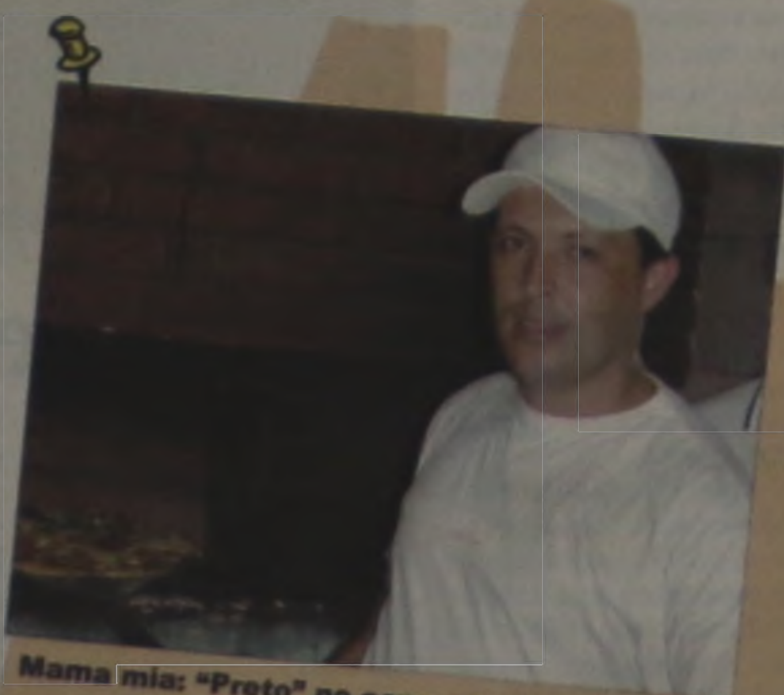
Mama mia: "Preto" no comando da Dona Doni