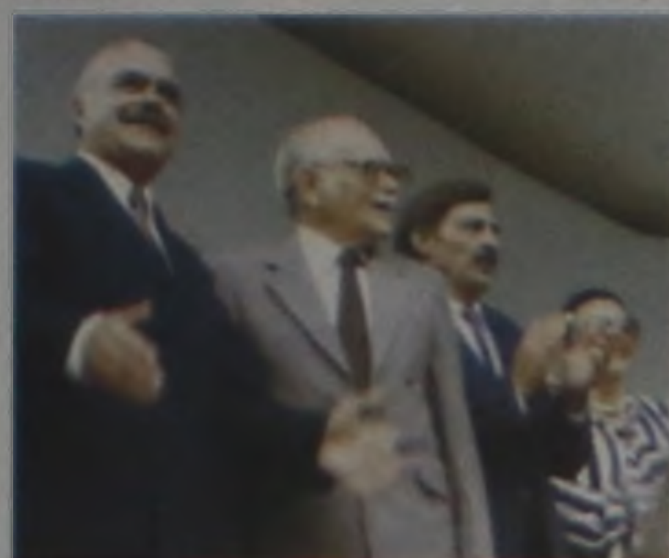
Comitiva de escritores liderada pelo então presidente José Sarney, a convite do prefeito Ideval Paccola visitou Lençóis

ralvo criava o obelisco, cujo feito fora registrado pelo jornal que também descreveu a criação da bandeira (abril de 1966) e o Hino do município escrito recentemente por Poério Zillo.