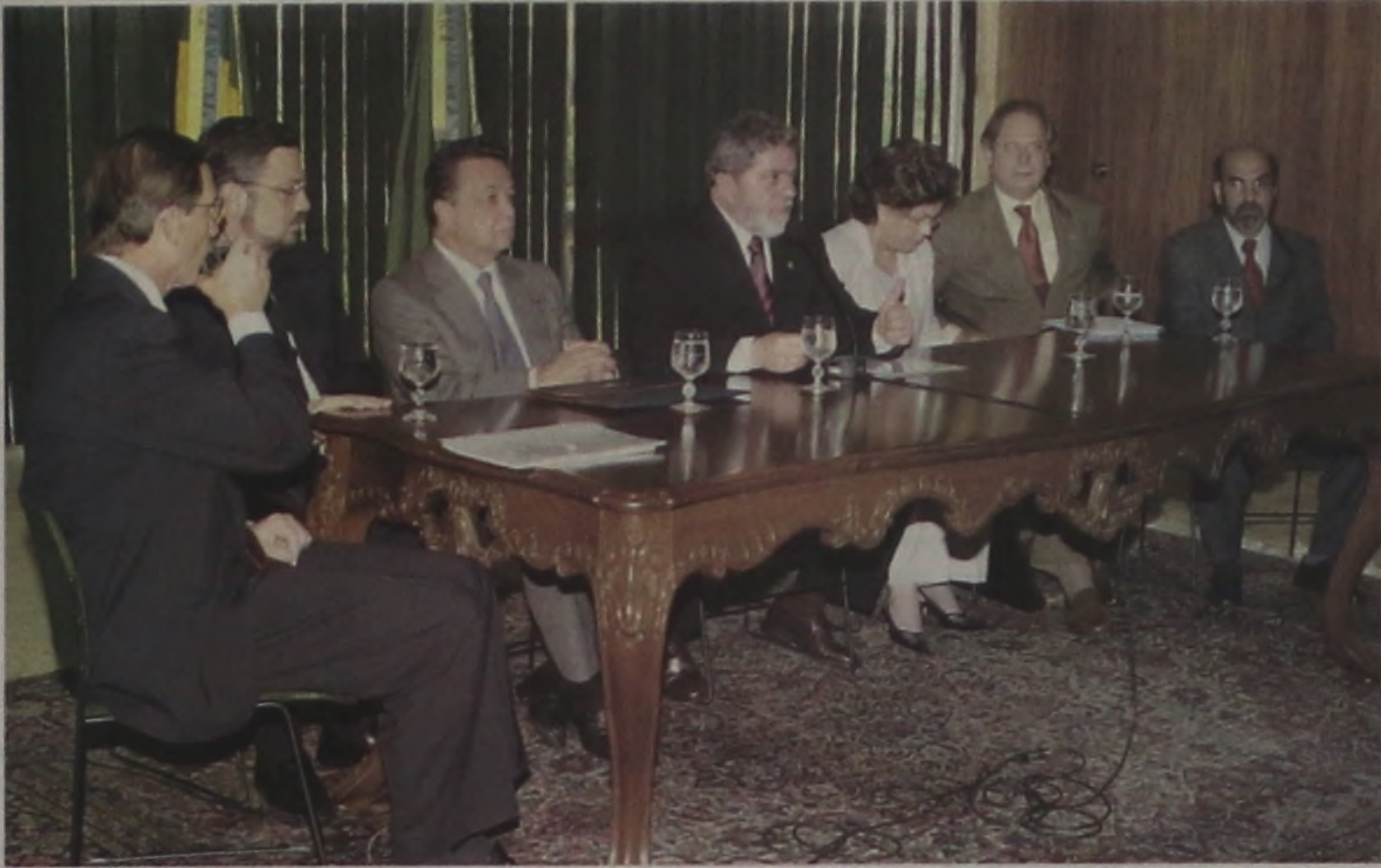
Lula e os ministros reuniram, no Palácio do Planalto, as mais importantes lideranças do setor sucroalcooleiro, para o acordo que garante o abastecimento de álcool automotivo

Hoje, contemplamos uma crônica de Mário Prata, esse atento observador do dia-dia do povo brasileiro. Ele fala das intermináveis teses (de mestrado, doutoramento, etc) que, muitas vezes, não levam a nada além da fabricação de um "doutor". Página 2