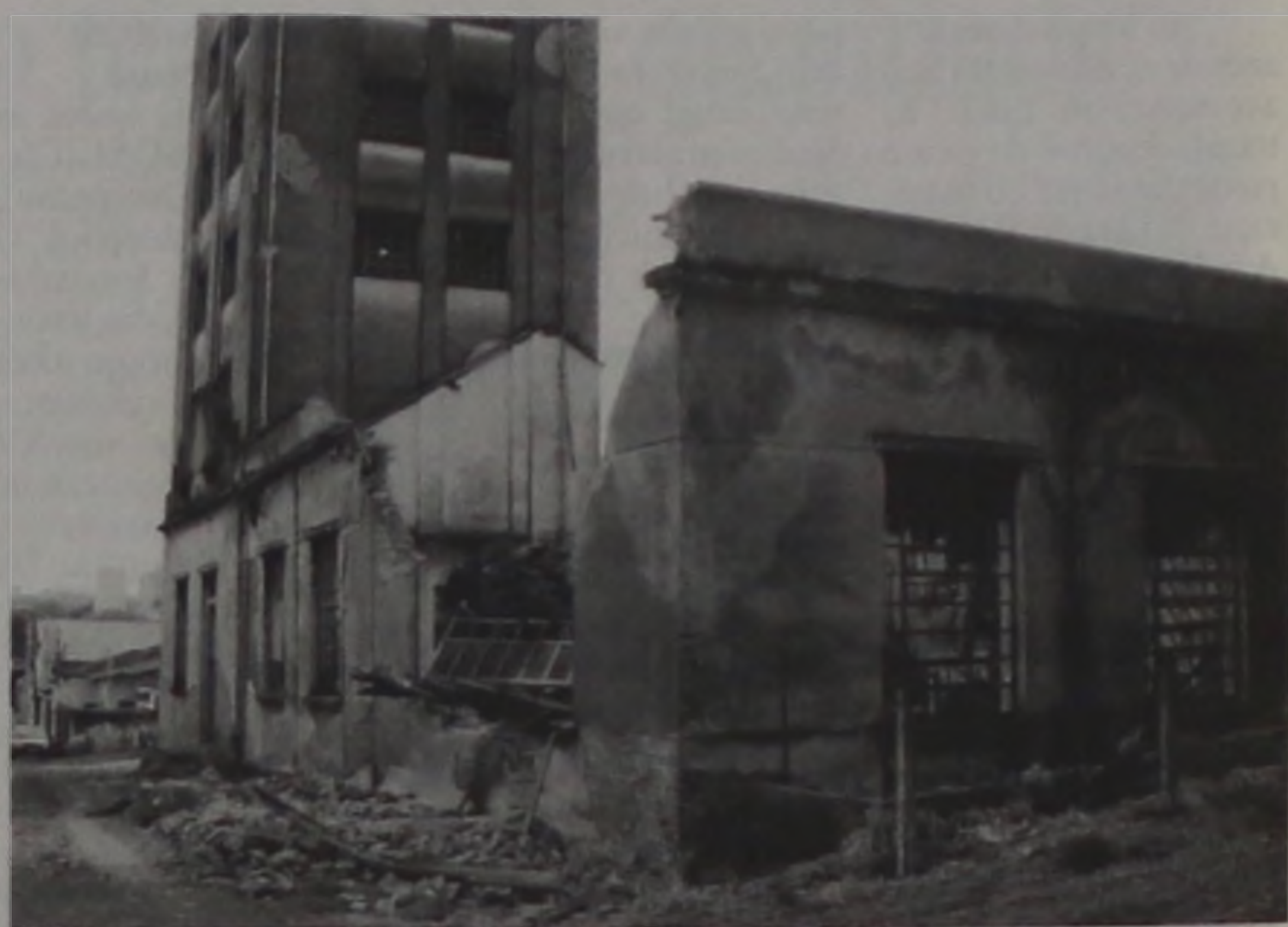
A velha destilaria que já serviu de fonte alternativa de combustível, hoje está em ruínas e serve para abrigar família sem-teto

Até o início da década de quarenta, os lençoenses que necessitassem de cuidados médicos tinham de ser transferidos para Agudos, São Manoel ou a outras cidades vizinhas. As dificuldades de locomoção fizeram com que um grupo de pessoas da cidade, se empenhasse no sentido de instalar em Lençóis um hospital que atendesse a população. O Eco abraçou a causa, teve participação ativa nessa