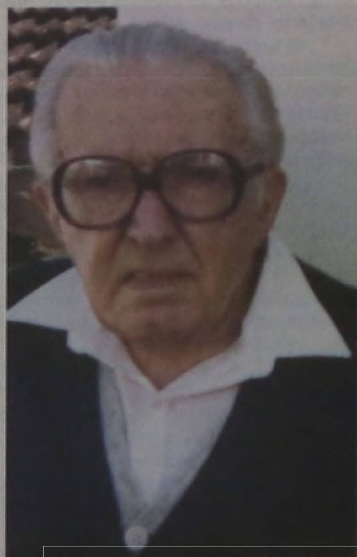
"A imprensa foi, é e será o índice da cultura de um povo"