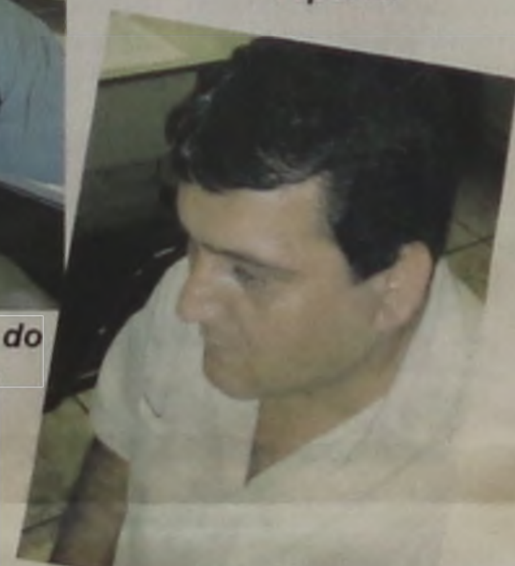
Wanderley Placidelli, Jornal O Eco