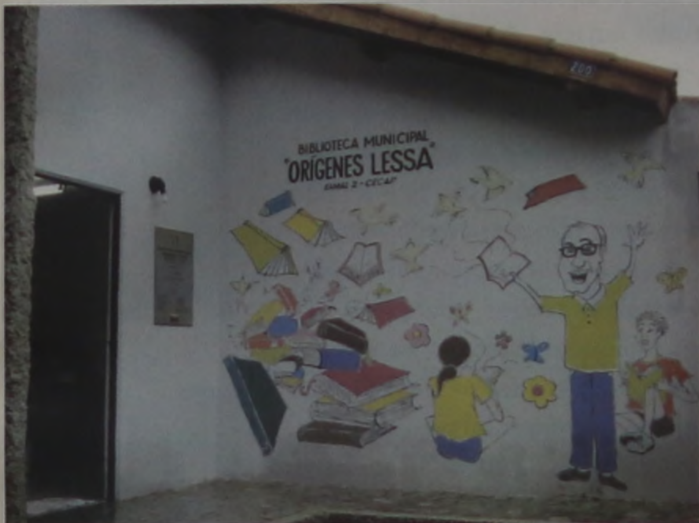
Biblioteca da Cecap contará com acervo de 2600 títulos

Os moradores da Cecap e bairros vizinhos recebem hoje, o ramal II da Biblioteca Municipal Orígenes Lessa. Esta obra, importante para democratizar o acesso à informação e cultura, atende a pessoas de todas as idades, mas principalmente os estudantes que se utilizam do acervo da BMOL para consultas para trabalhos escolares.