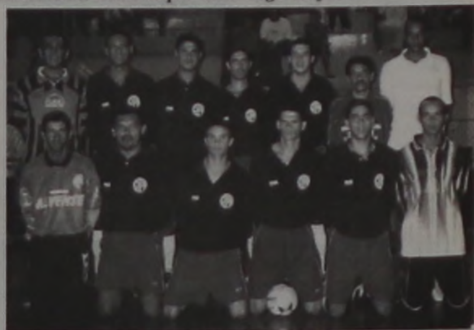
Presidente Alves, favorito ao título da competição

UME/Grupo Lwart e Cartanagem Pirâmide de Jaú