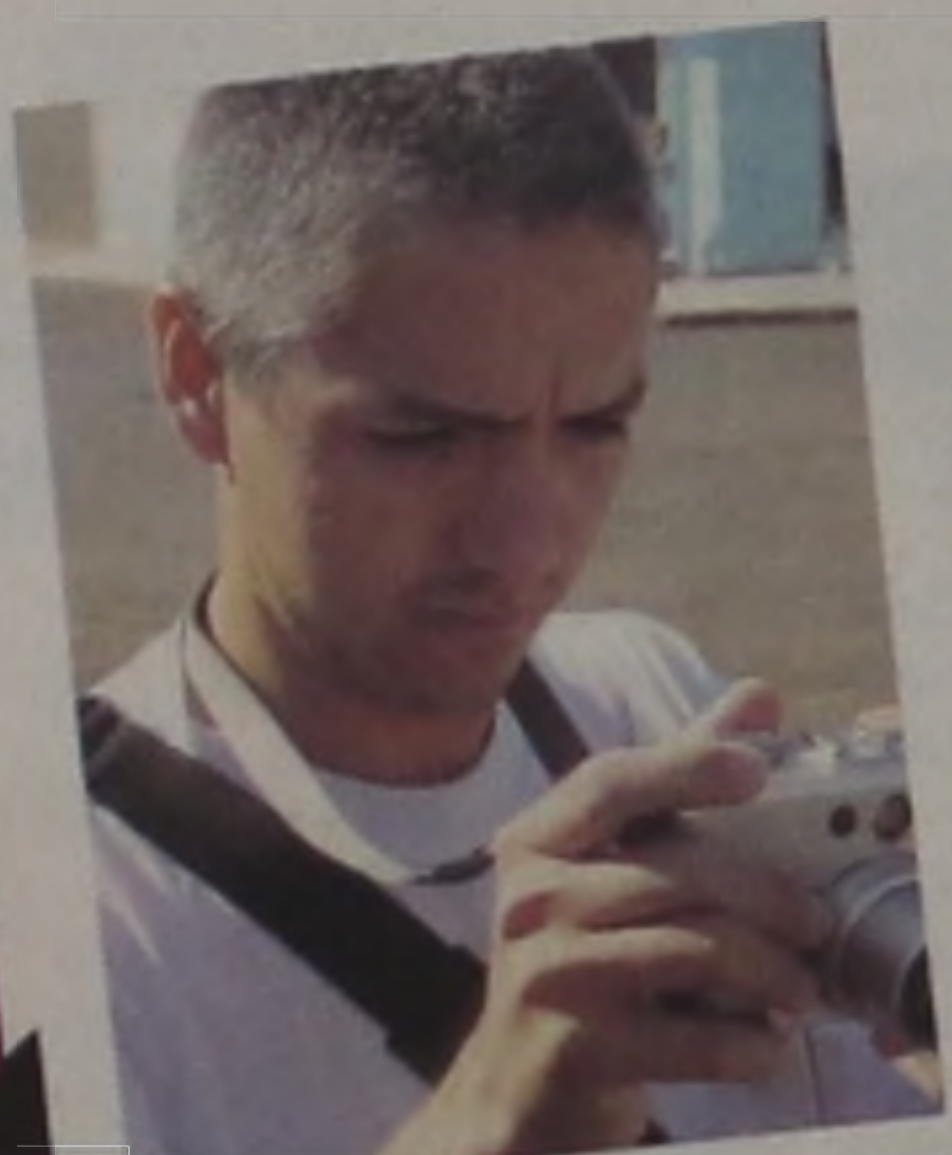
Billy Mao, fotógrafo da Tribuna