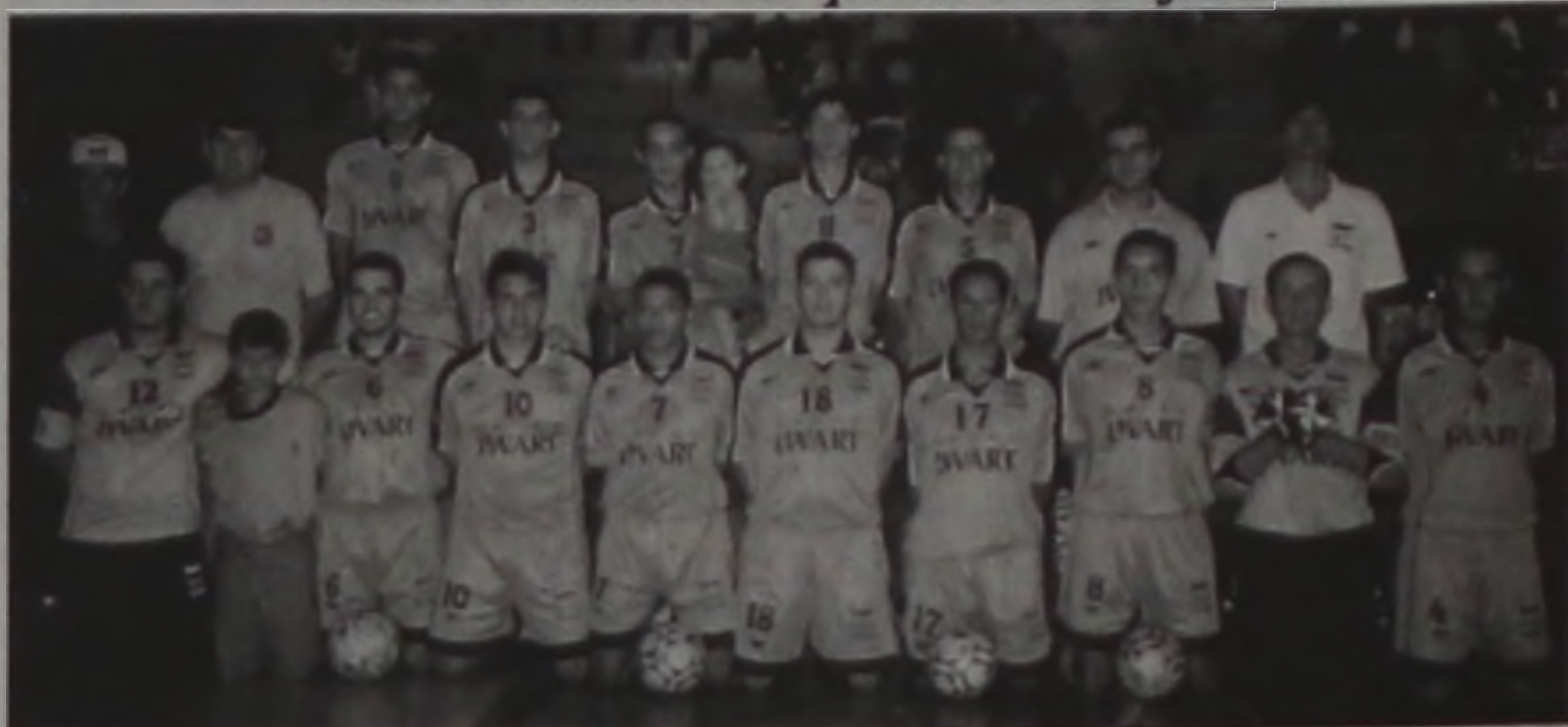
UME/Grupo Lwart lutava ontem por uma vaga na final

- Finais acontecem na quarta e sexta-feira -