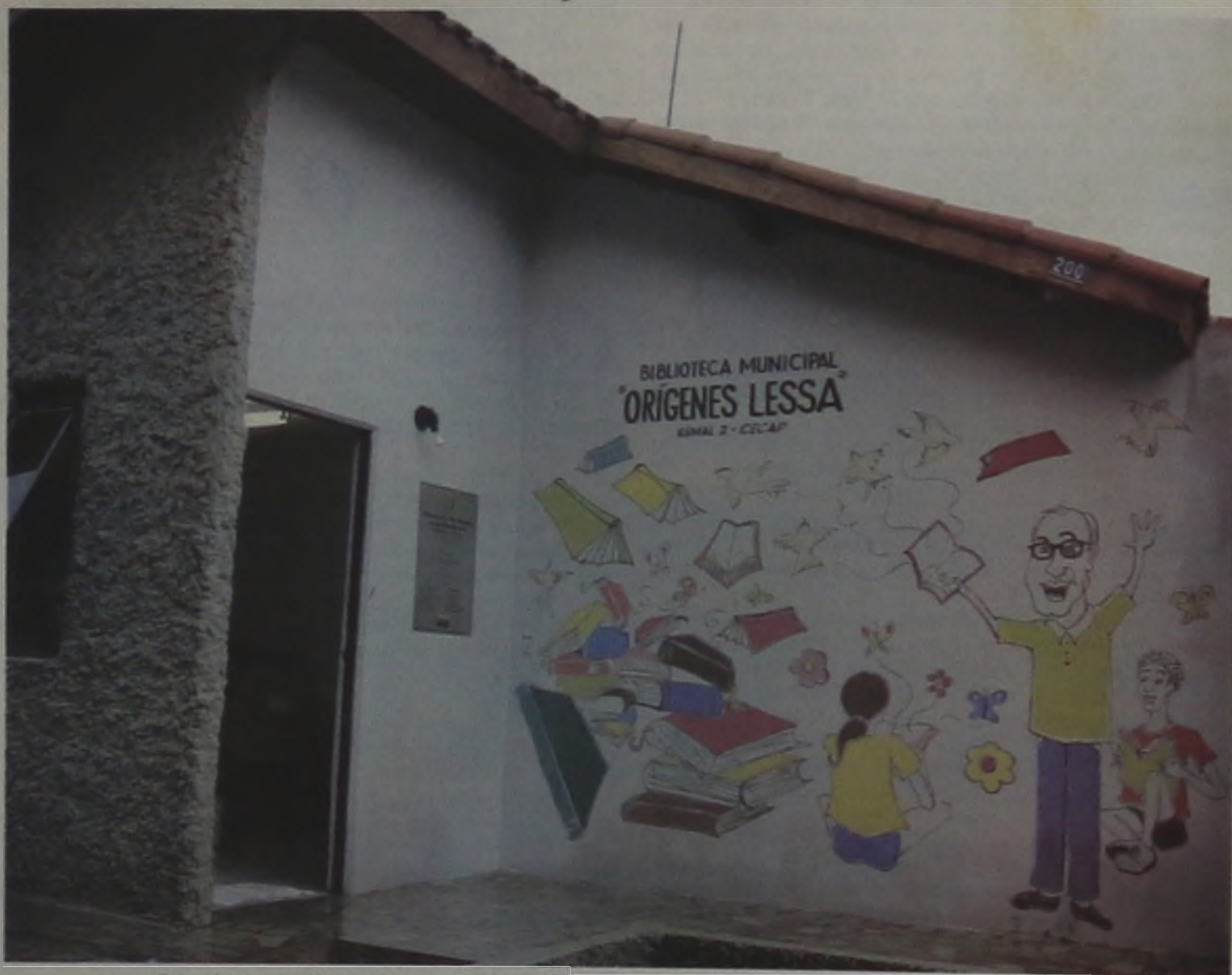
O imóvel foi adaptado para a biblioteca e deverá ajudar muito os moradores do bairro