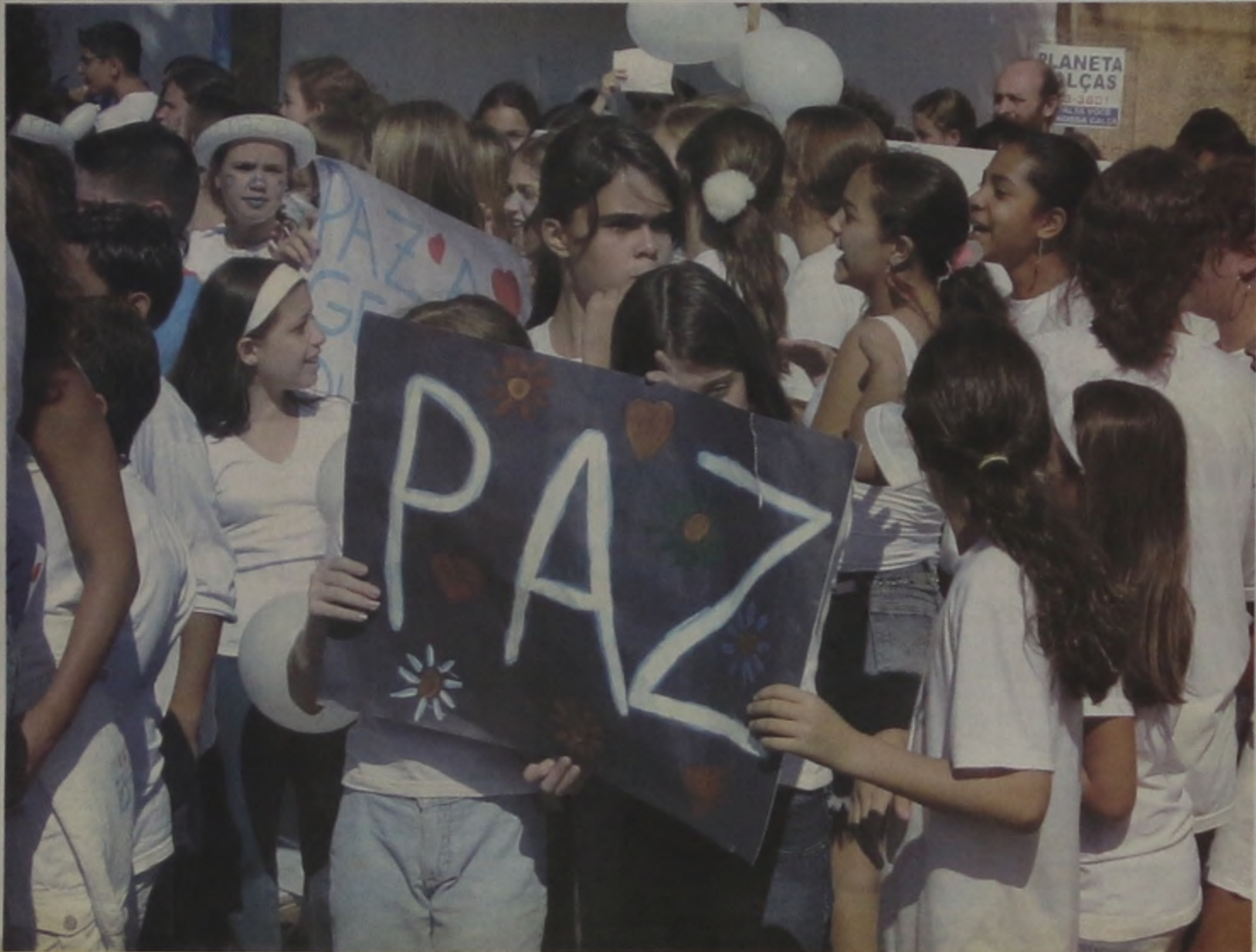
Os escolares saíram às ruas chamando a atenção dos adultos e principalmente dos EUA para a necessidade da paz