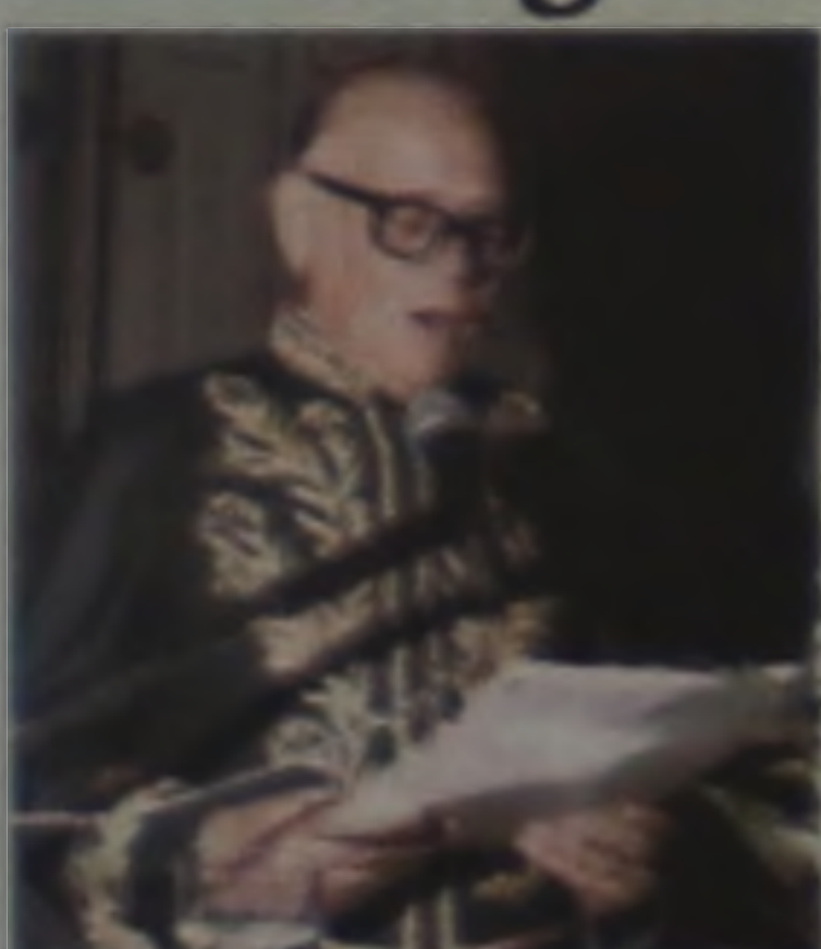
Dia 12 de julho, Orígenes Lessa, completaria 100 anos

Ainda menino, sentindo inclinação para a literatura, colaborou nos jornalinhos do Colégio: “A Lança” e o “O