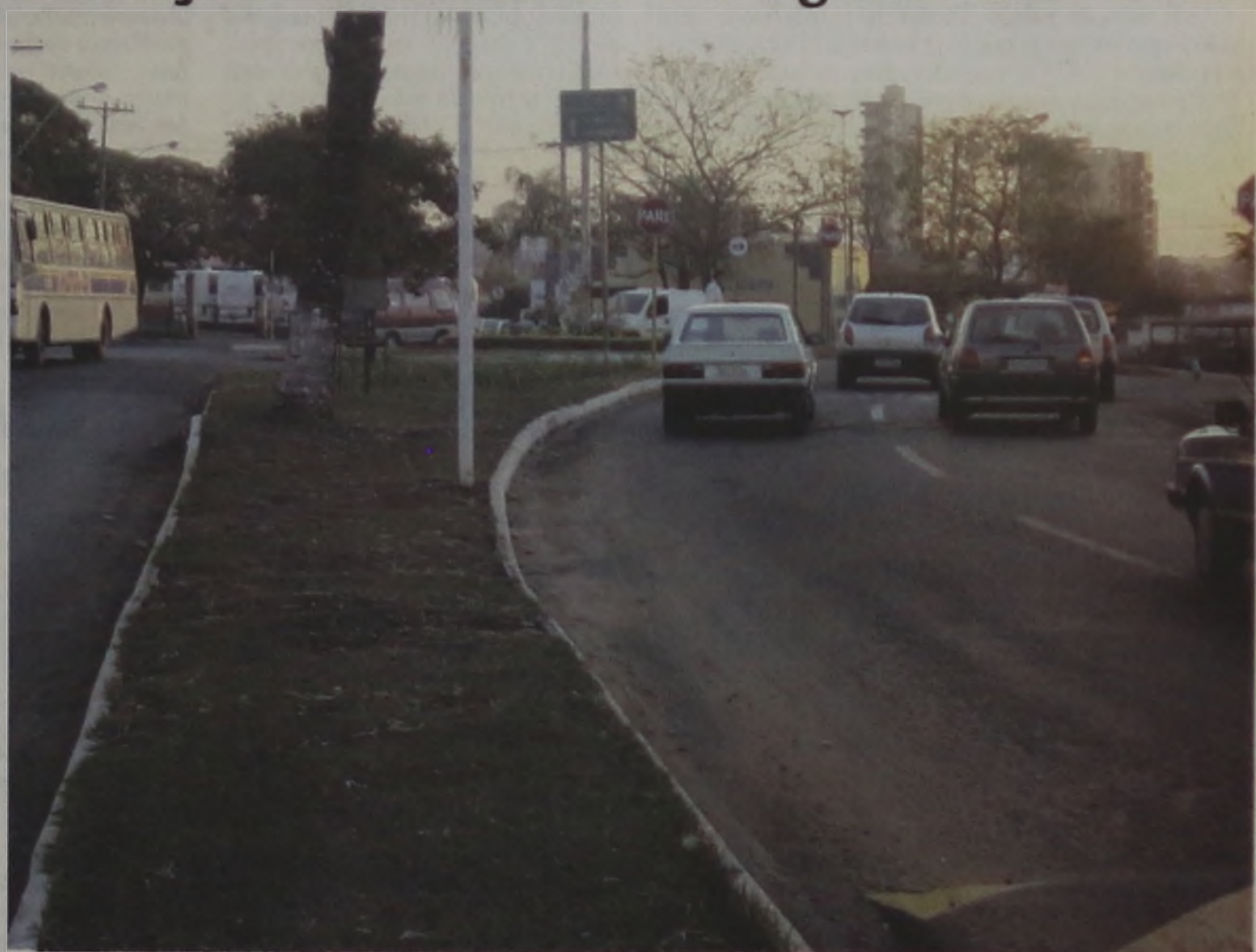
Alteração no trânsito pode provocar acidentes. Mudança na sinalização não agradou os motoristas

trabalhar para a prefeitura gratuitamente (contrapartida) para compensar o valor desembolsado pelo município. "Até por que, na campanha eleitoral o atual prefeito prometeu esse benefício a todos os estudantes que tiveram que sair da cidade para concluir seus estudos" argumentou um dos alunos.