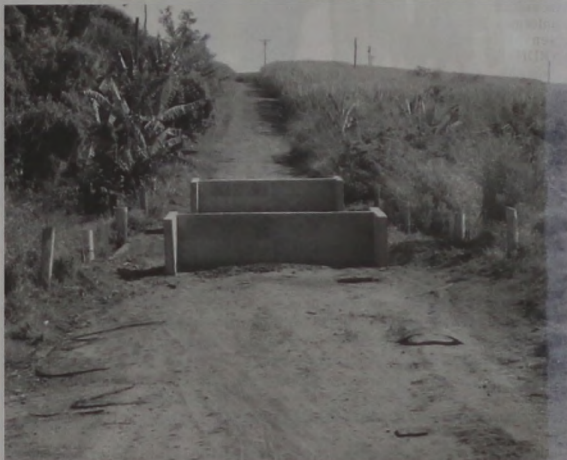
Há aproximadamente 70 dias as obras estão paralisadas na ponte da Faturinha