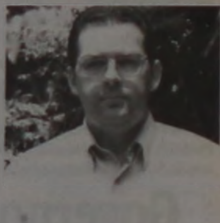
Pedido de Tupã é atendido pelo prefeito