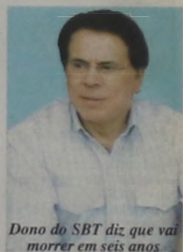
Dono do SBT diz que vai morrer em seis anos

Plenário aprova lei que inclui na cobrança do imposto os serviços criados com o avanço da tecnologia. O Senado aprovou projeto de lei do então senador Fernando Henrique Cardoso que inclui 107 itens na lista de serviços sujeitos ao pagamento do Imposto sobre Serviços de Qualquer Natureza (ISS), cobrado pelos municípios. Grande parte é de serviços criados com o avanço da tecnologia depois de 1968, especialmente automação bancária e serviços de informática, incluindo a Internet. Página 4