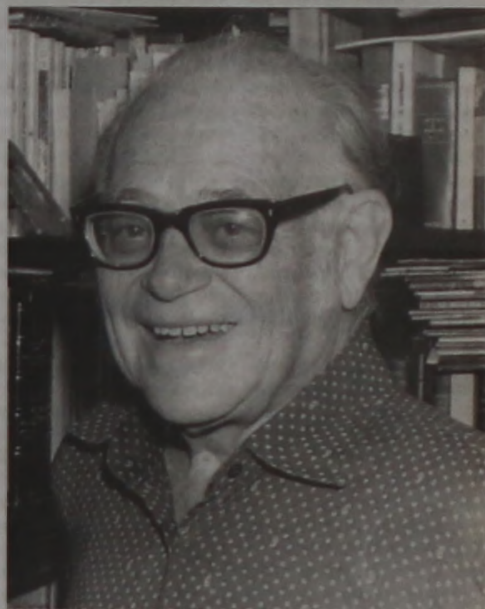
Orígenes Lessa completaria cem anos, hoje

Ontem, a Praça Comendador José Zillo foi palco de uma homenagem ao escritor lençoense, com o descer-