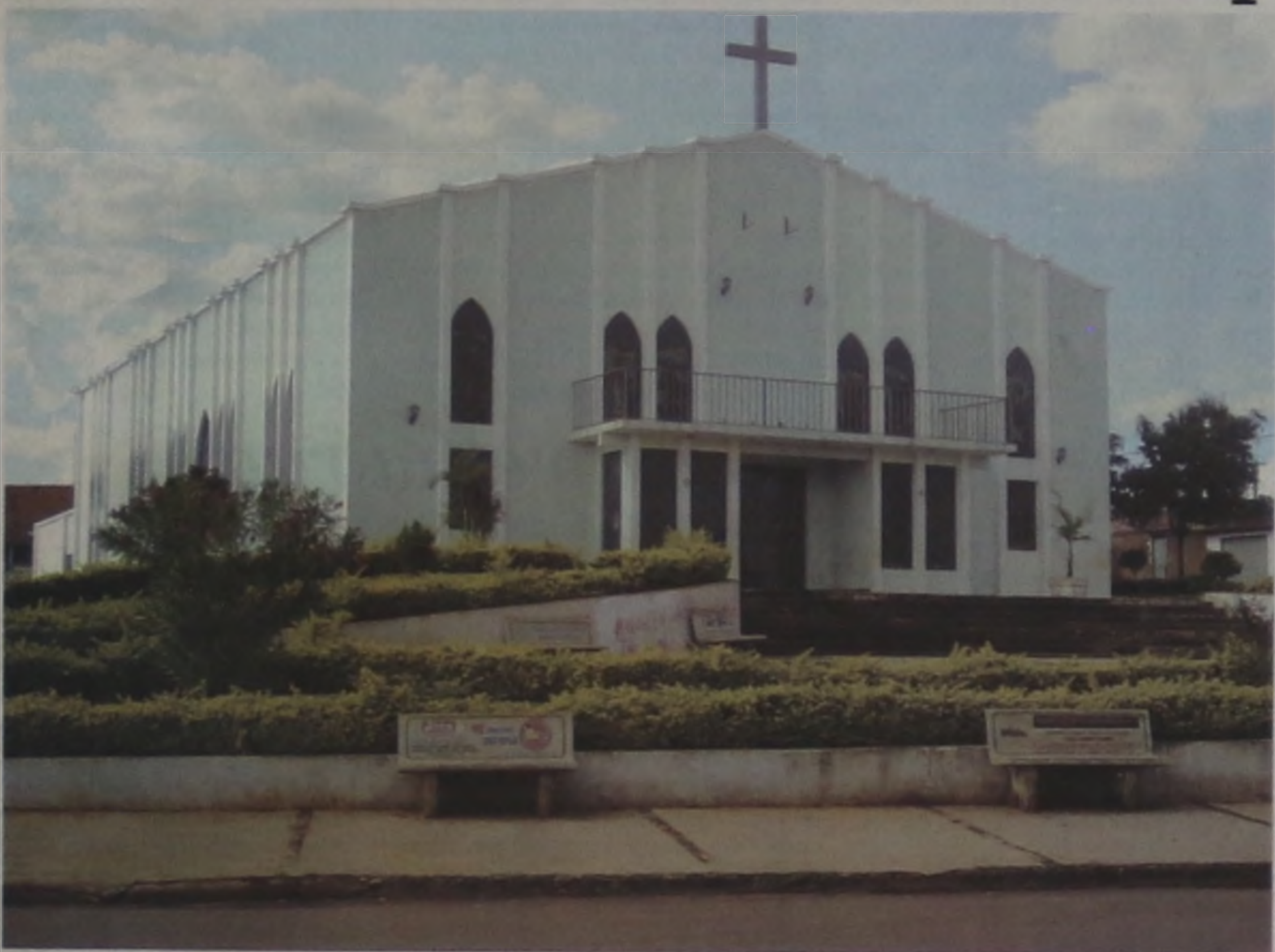
Religiosidade à parte, a Paróquia Cristo Ressuscitado é um dos cartões postais da cidade

Teve início ontem no bairro Cecap, com a chegada da imagem de Nossa Senhora de Fátima, a 13ª Festa de São Cristóvão na Paróquia Cristo Ressuscitado. A tradicional quermesse acontece hoje e amanhã, e nos dias 19 e 20, 25, 26 e 27 de julho com praça de alimenta-