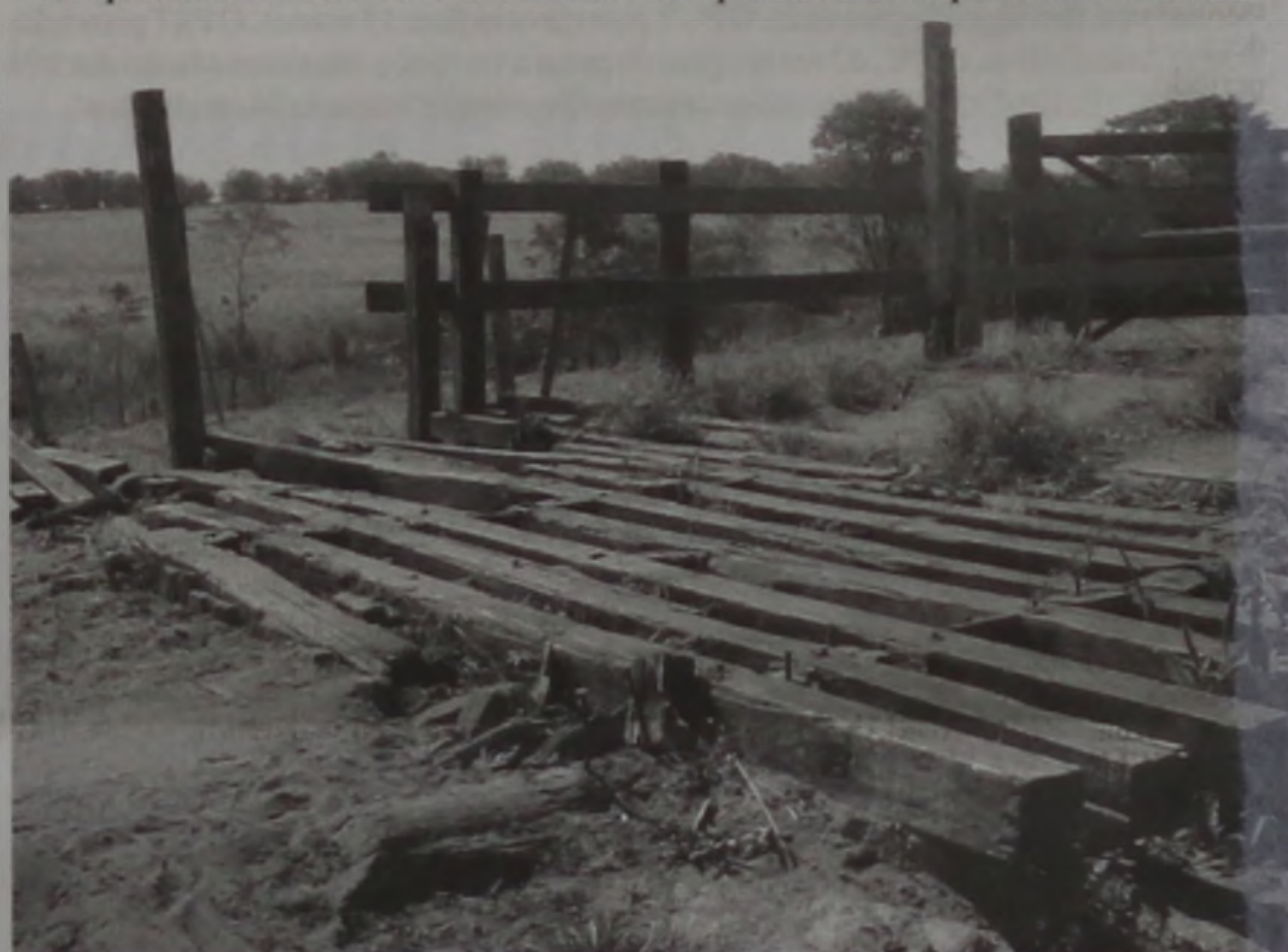
Os mata-burros existentes na região estão em péssimo estado de conservação

Cerca de trinta famílias do Bairro Faturinha, estão descontentes com a administração municipal. Ocorre que a prefeitura, em parceria com a secretaria da Agricultura começou a substituição de uma antiga ponte de madeira sobre o córrego Faturinha e, já há aproximadamente 70 dias as obras estão paralisadas. Apenas as cabeceiras da ponte foram concluídas e, com isso,