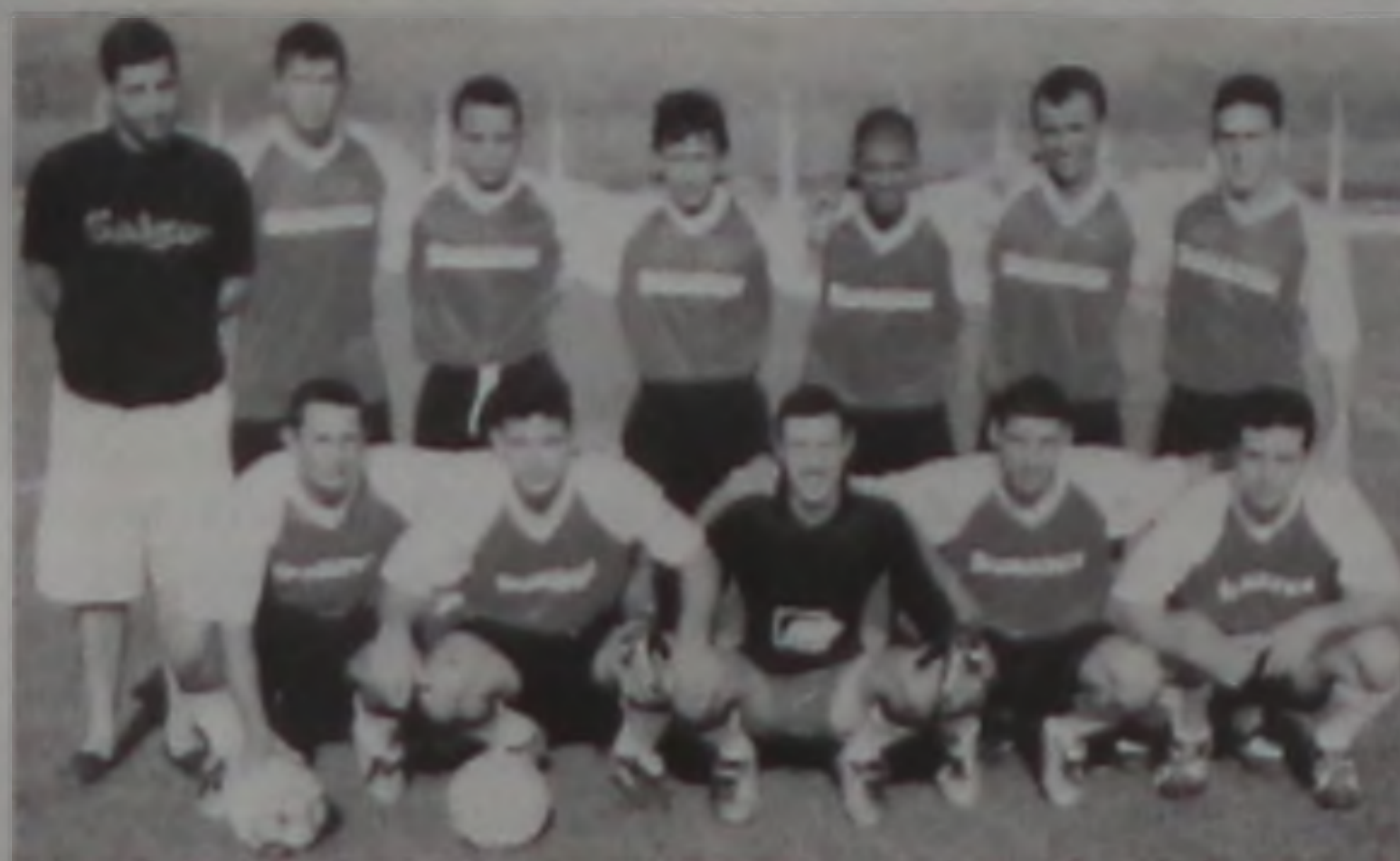
Equipe Duratex, uma das líderes da Série B