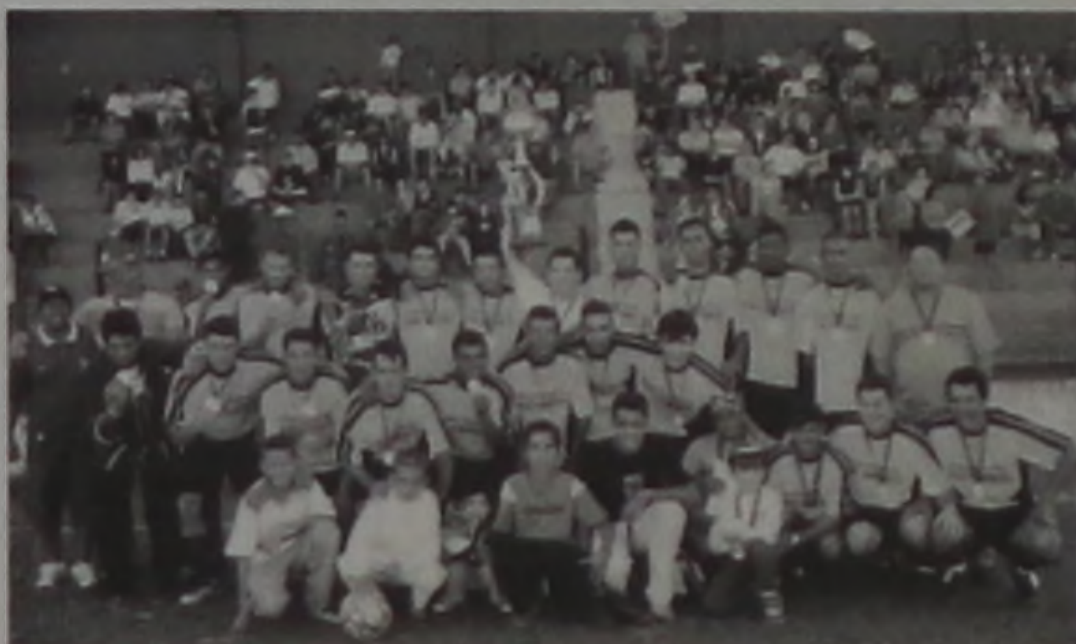
Bocaina, campeão da Série B