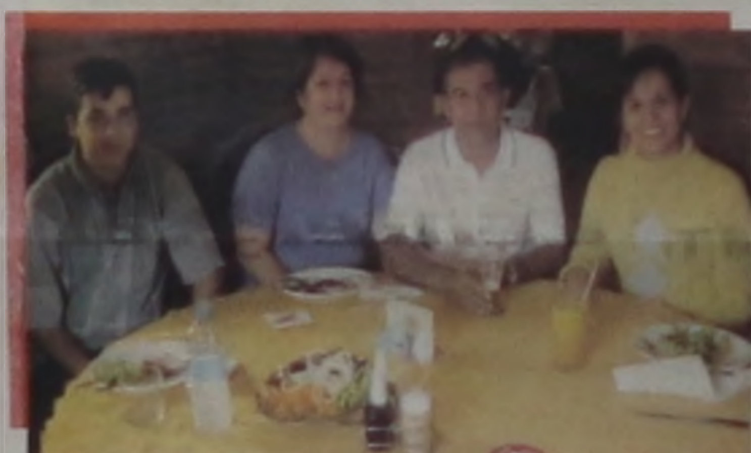
Família Matta comemorando o dia dos pais