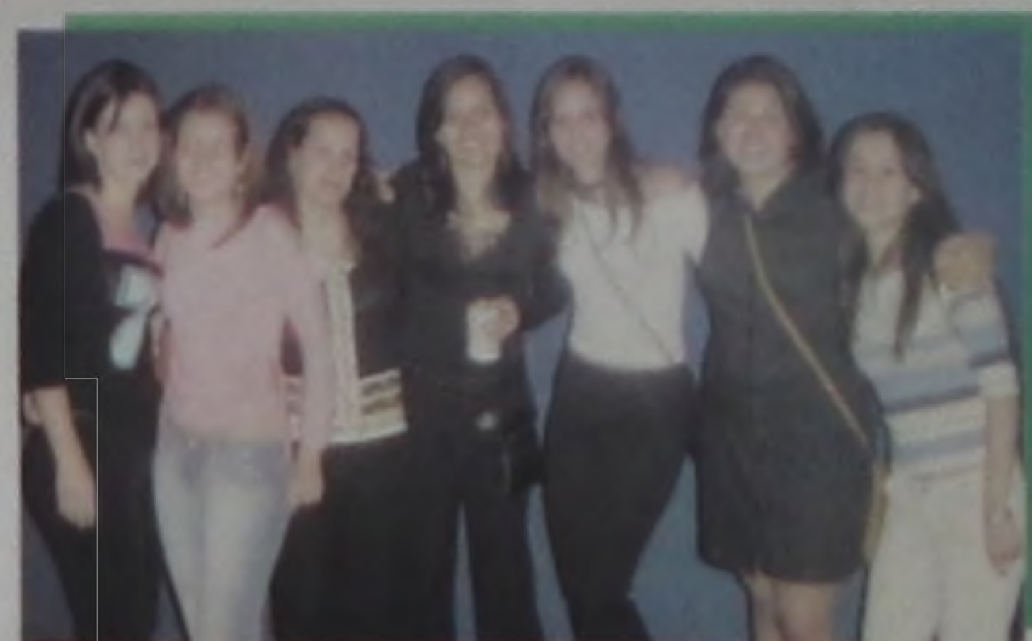
Mulher, mulheres, mulherada e + mulheres!