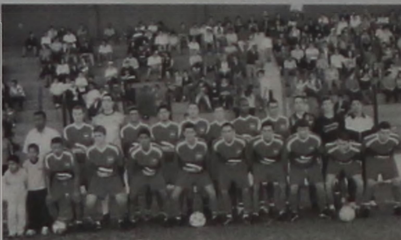
Palestra, campeão da Série A