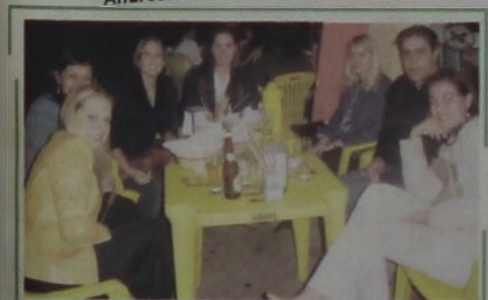
O papo está bom, mas... vamos comer mais um pouquinho!