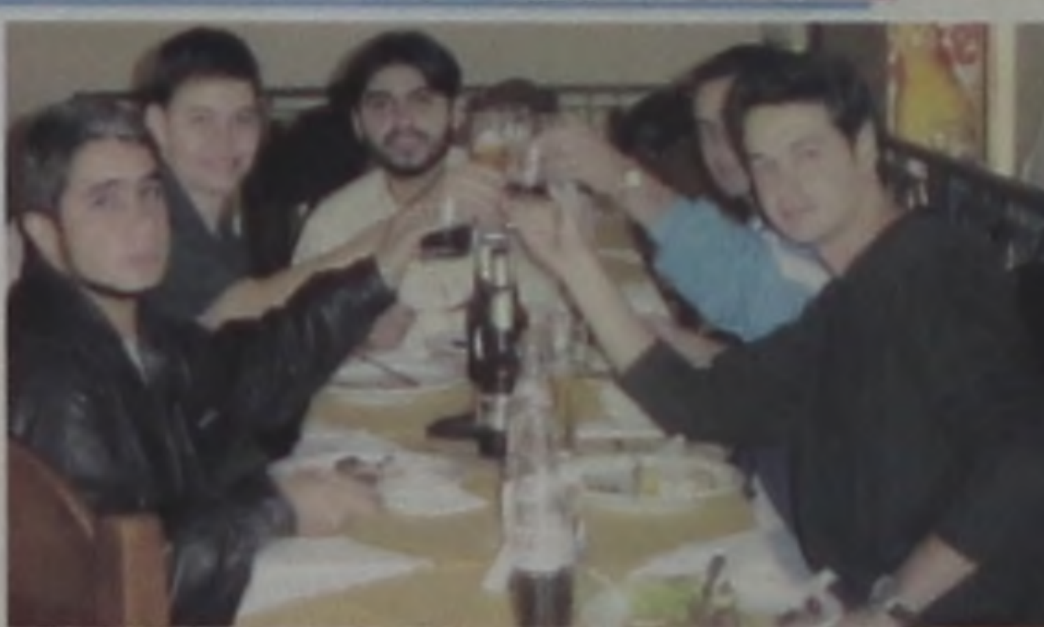
Os meninos do "Direito" comemorando o dia da pendura