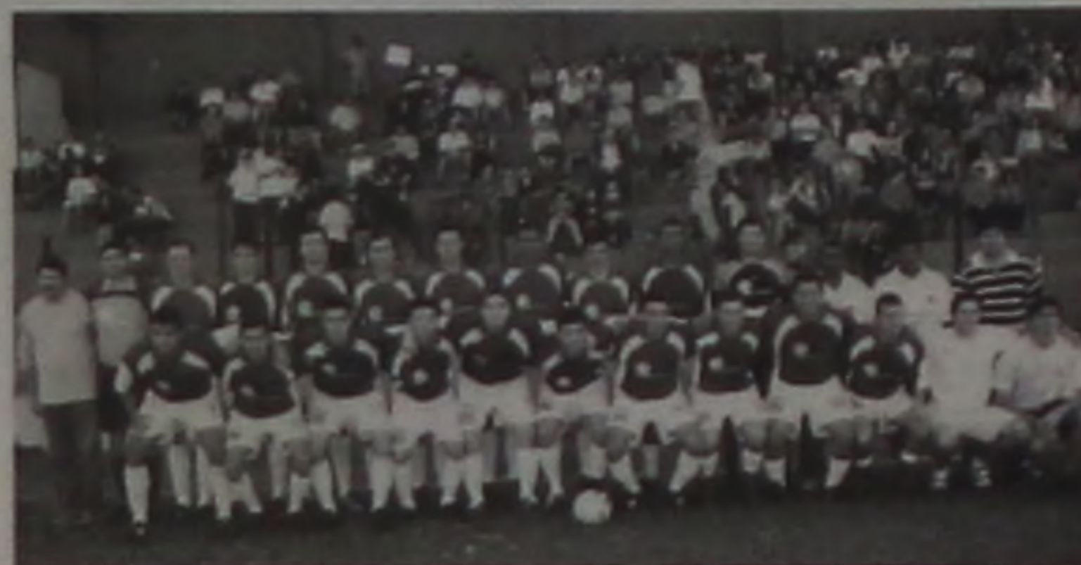
Grêmio Lwart vice-campeão da Série A