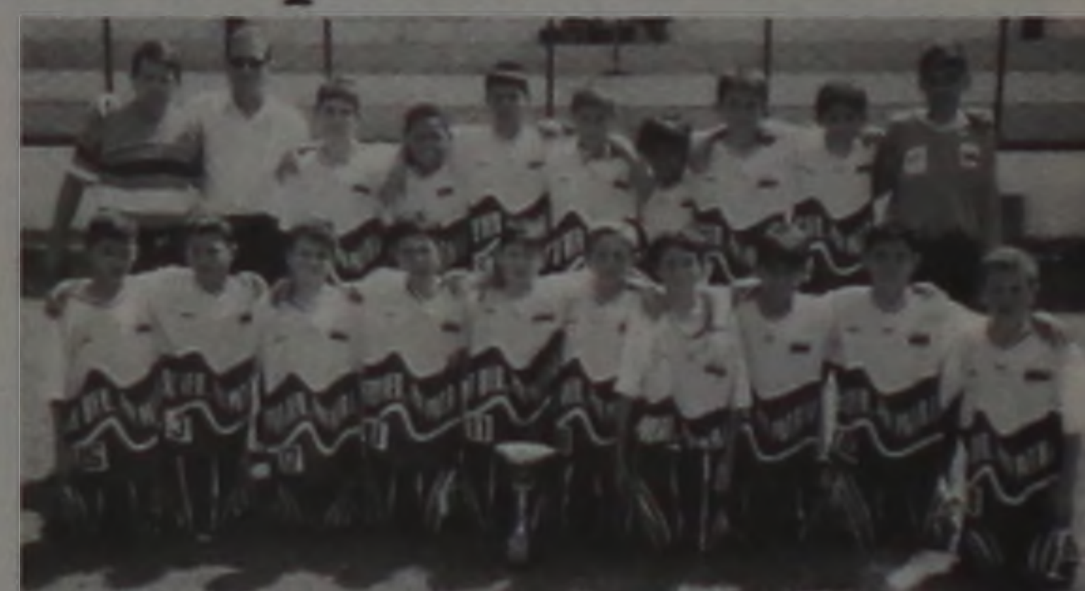
Equipe da UME campeã da Copa Cidade de Bauru