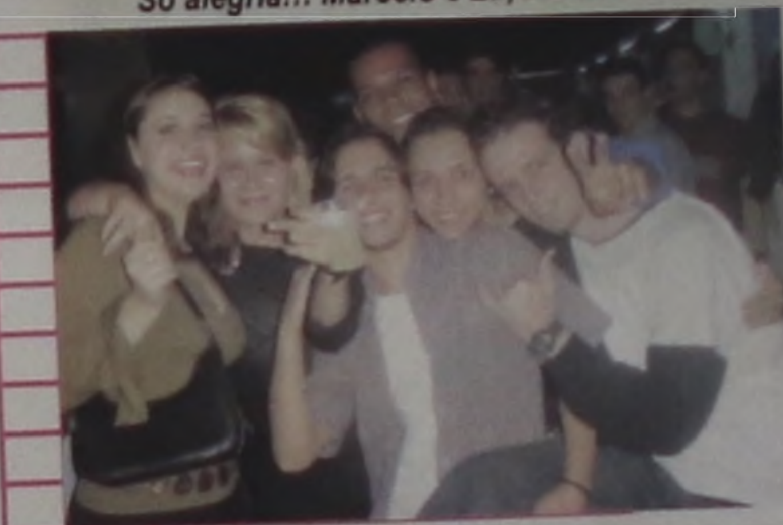
A galera curtindo a night