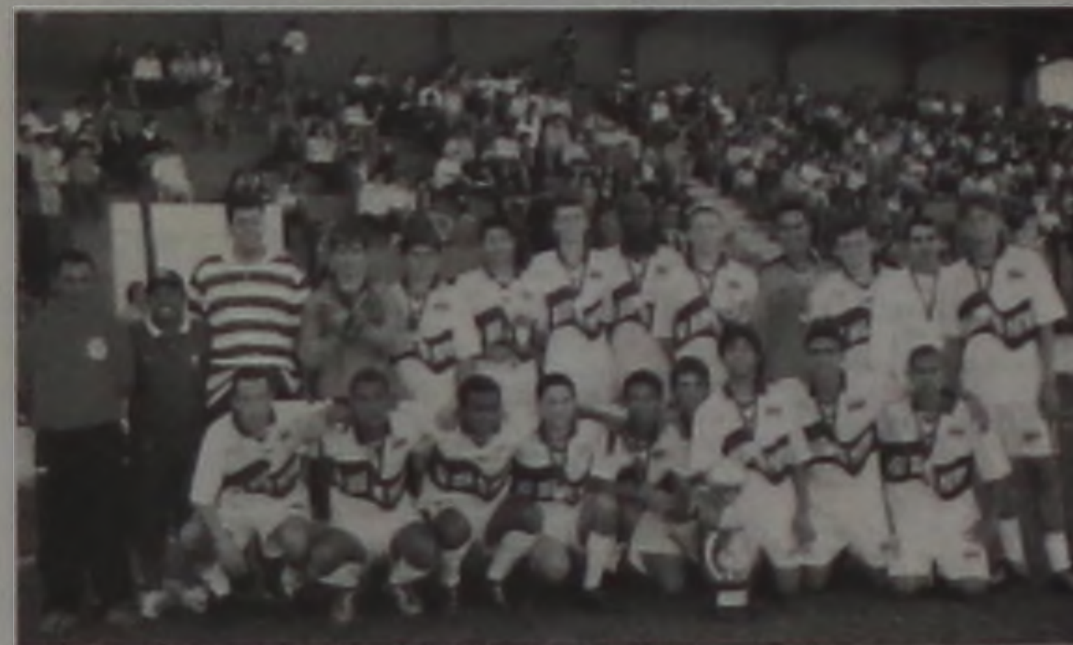
UME vice-campeã da Série B