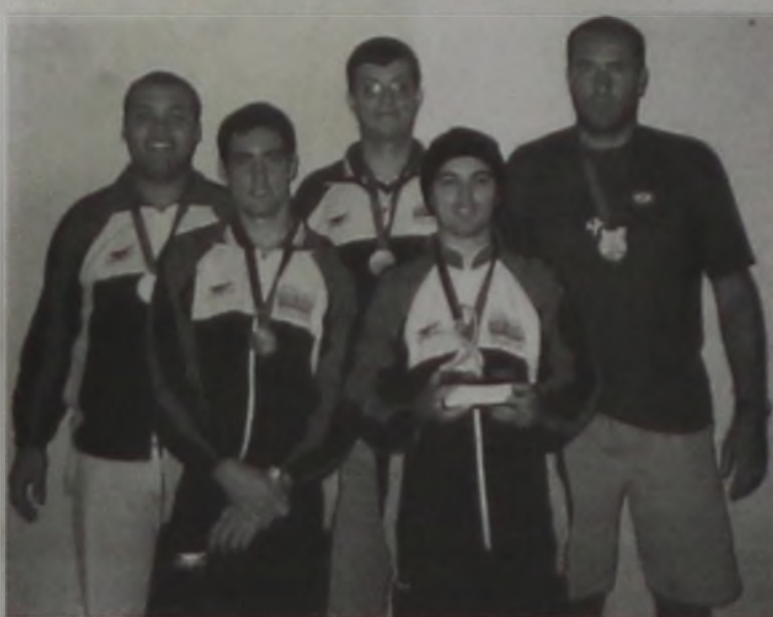
Xadrez da UME conquistou a medalha de bronze