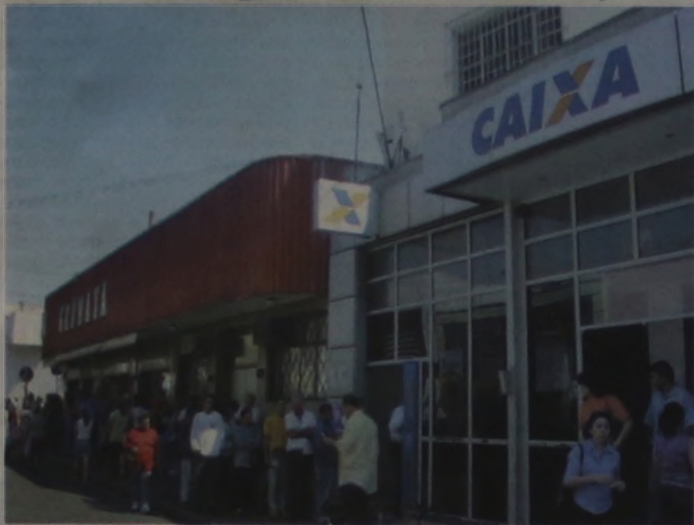
Rotina: Terminou a greve, mas a fila continua

A Caixa Econômica Federal de Lençóis Paulista voltou a funcionar ontem, com grande movimentação, depois de quase dez dias de paralisação.