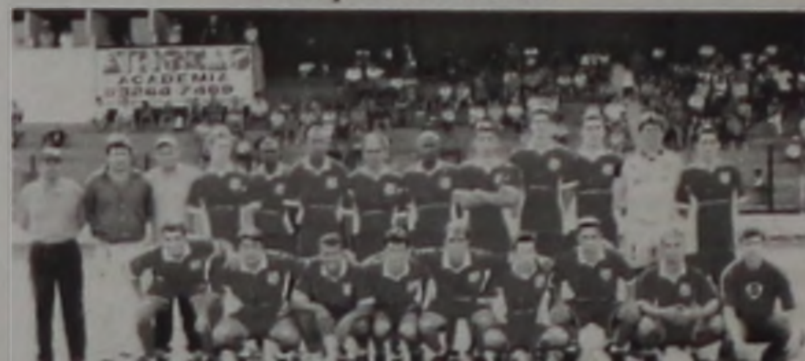
Expressinho ficou com o vice campeonato