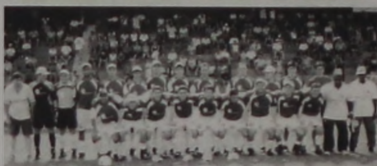
Grêmio Lwart conquistou pela primeira vez o campeonato amador

A cerimônia de entrega dos troféus e medalhas para as equipes campeã e vice-campeã, contou com a presença do patrono do campe-