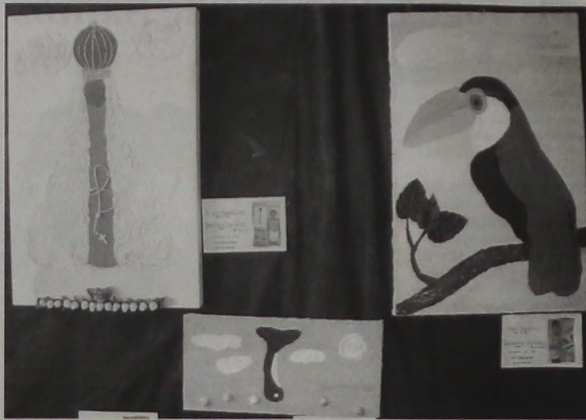
Alguns dos trabalhos criados pelos alunos do Ateliê "Gente Feliz"