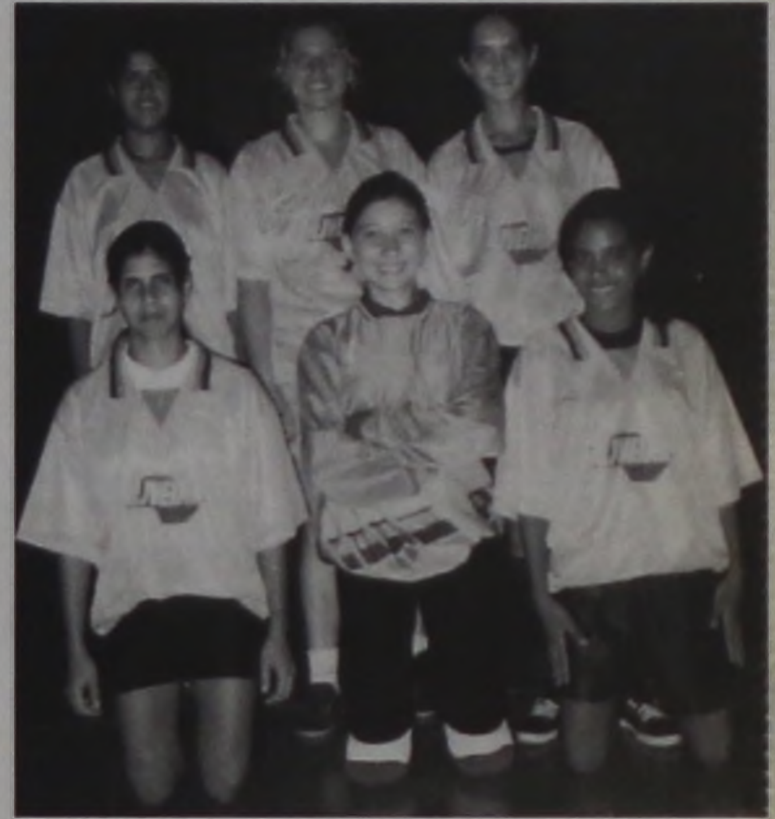
Atletas da equipe campeã do torneio do Núcleo, realizado no ano passado

A copa é organizada pelo desportista Wladislau Fernandes Cruz, que tem o apoio da Unidade Municipal de Esportes (UME) e conta com a participação de seis agremiações, divididas em dois grupos. O grupo A é composto por Alfredo Guedes, As Panteras e União Primavera. Já o grupo B é formado por As Guerreiras, Núcleo e Barcelona (Cecap). Na primeira fase, as equipes se enfrentam entre si dentro do grupo, classificando-se as duas primeiras colocadas para a próxima