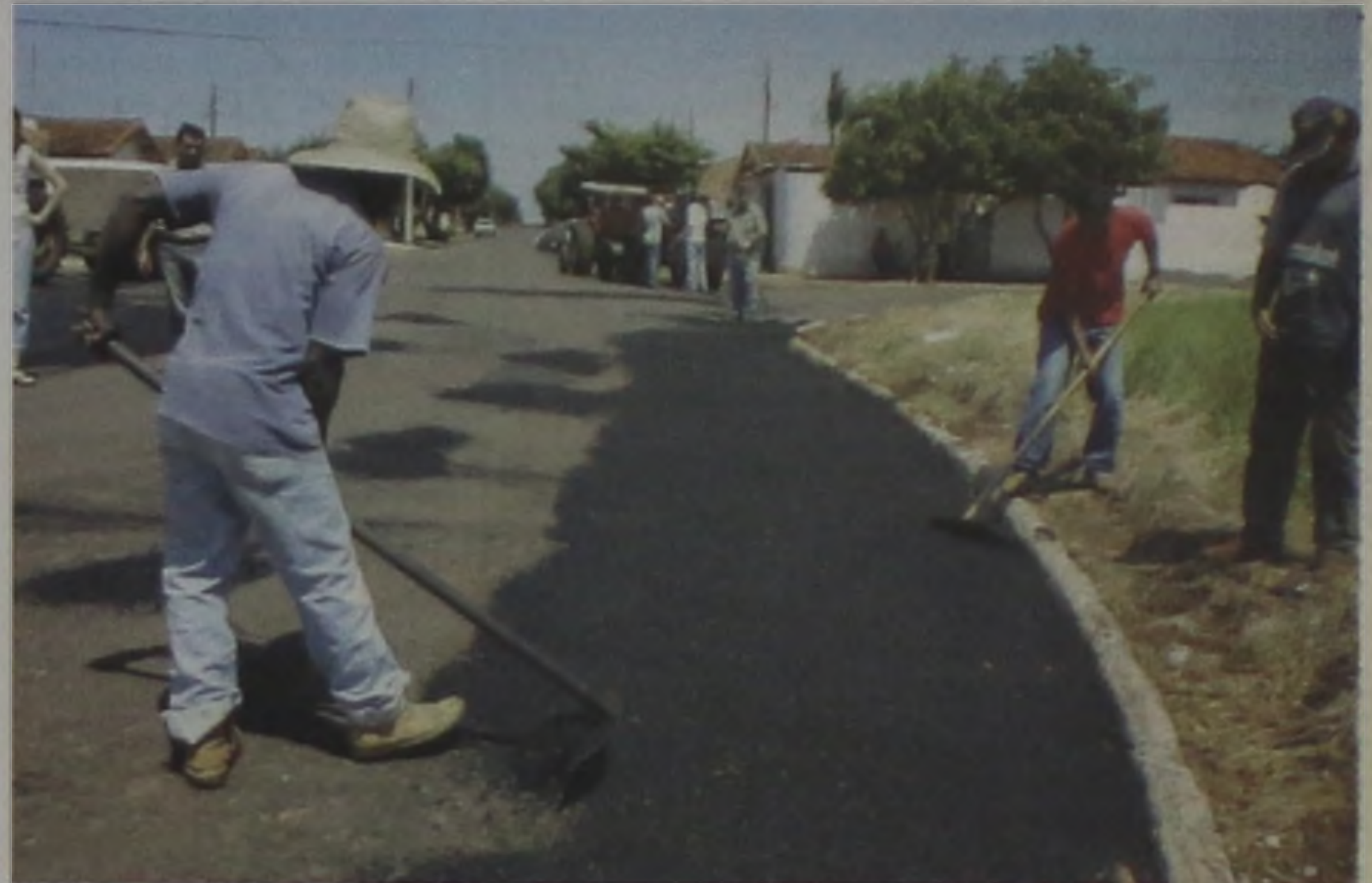
As equipes da Prefeitura já realizam o tapa-buracos nas ruas do jardim Bocayuva

A equipe da operação tapa-buracos, da Prefeitura de Macatuba, chegou esta semana ao Jardim Bocayuva. A operação recomeçou no dia 26 de fevereiro, pelas vias principais do município, como a avenida Coronel Virgílio Rocha e as ruas do Centro. No segundo trecho consertado estavam as ruas do Jardim Planalto. Nesta semana, a operação se encarrega do Jardim Bocayuva.