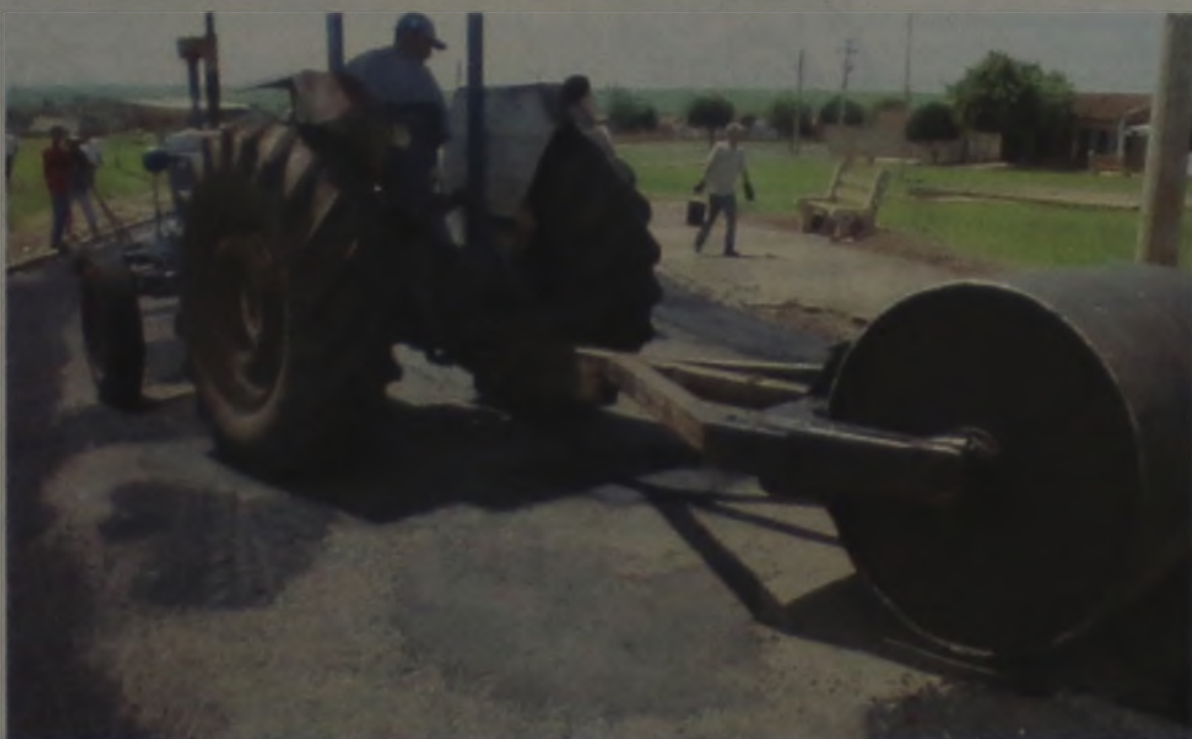
Os equipamentos da Prefeitura de Macatuba estão nas ruas para reparar o Jardim Bocayuva

A operação tapa-buracos da Prefeitura de Macatuba chegou esta semana ao Jardim Bocayuva. Iniciada em 26 de fevereiro, mais de 150 toneladas já foram aplicadas, número que deve dobrar até a conclusão do programa. O governo de Macatuba também informou que está licitando a compra de materiais para recuperar a estrada vicinal Lauro Peraçoli (Macatuba-Igaraçu do Tietê).