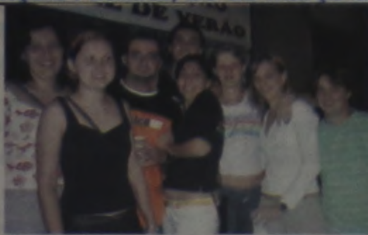
A galera bem á vontade, na Casa da Cerveja!!!