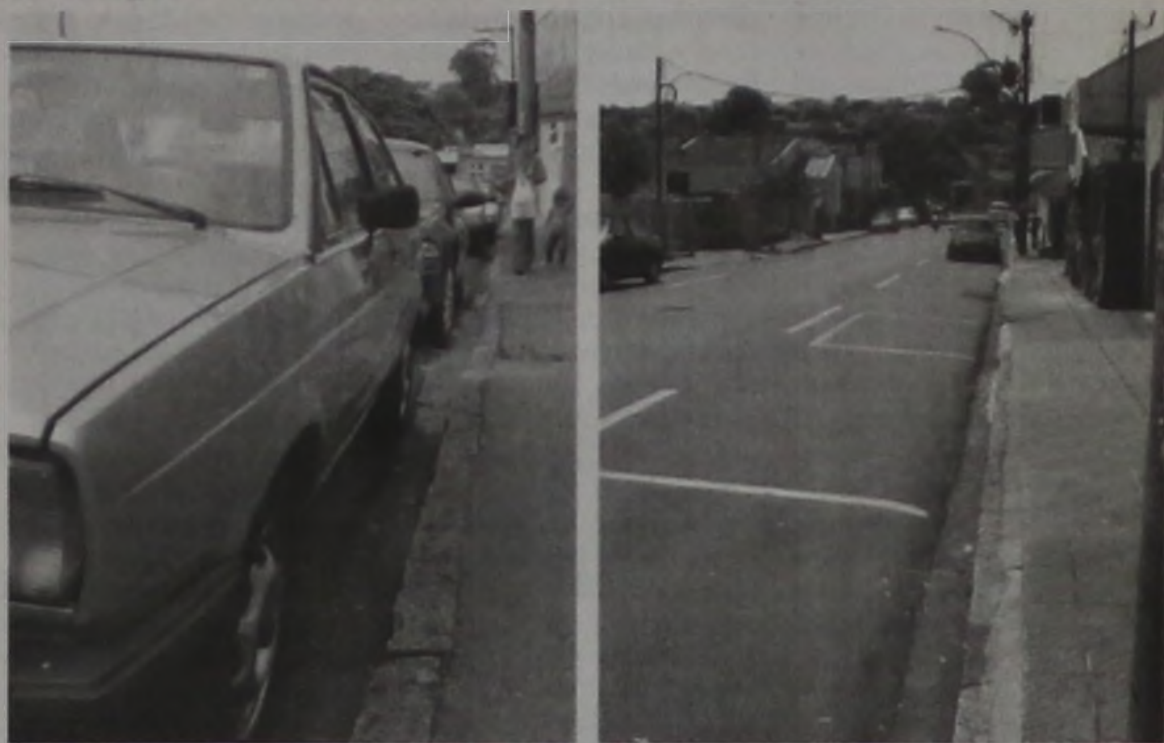
No mesmo local antes disputado para estacionamento agora sobram vagas por causa da área azul

Como a área azul ainda é um projeto em implantação, é natural que as adaptações necessárias sejam feitas com o decorrer do funcionamento do sistema de estacionamento rotativo no centro.