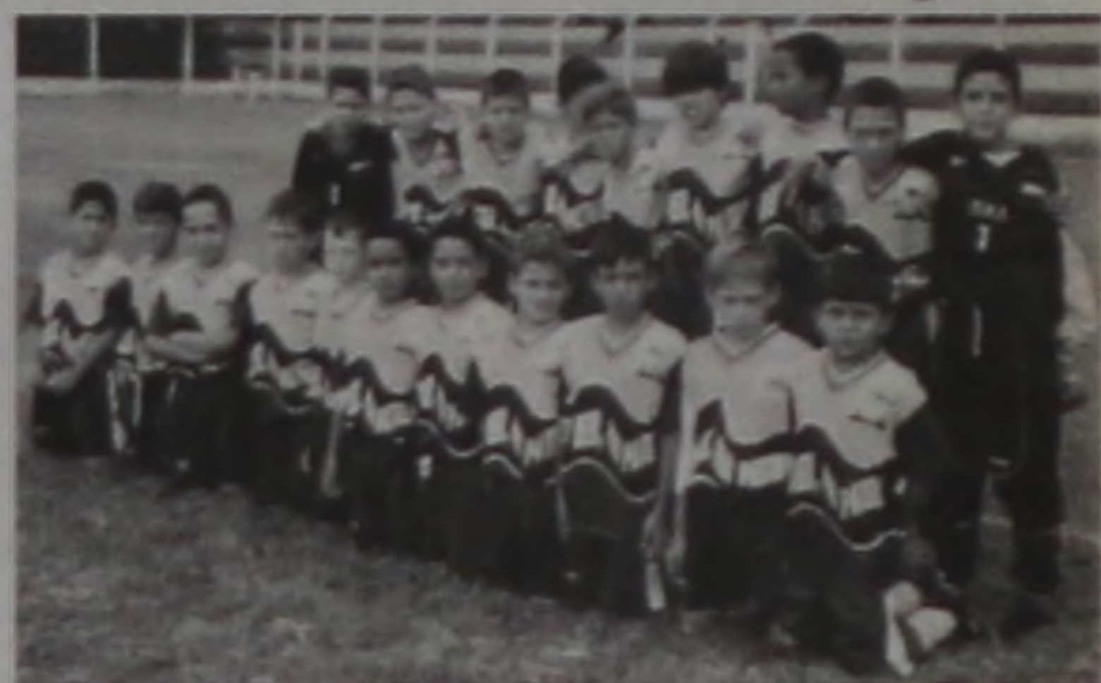
A equipe pré-mirim da UME entra em campo hoje

As equipes de futebol infantil, mirim e pré-mirim das escolinhas da UME (Unidade Municipal de Esportes) enfrentam a representação do Chute Inicial do Corinthians Sport Club. As partidas começam às 8h30 de hoje, dia 20, no estádio Archângelo Brega, o Bregão.