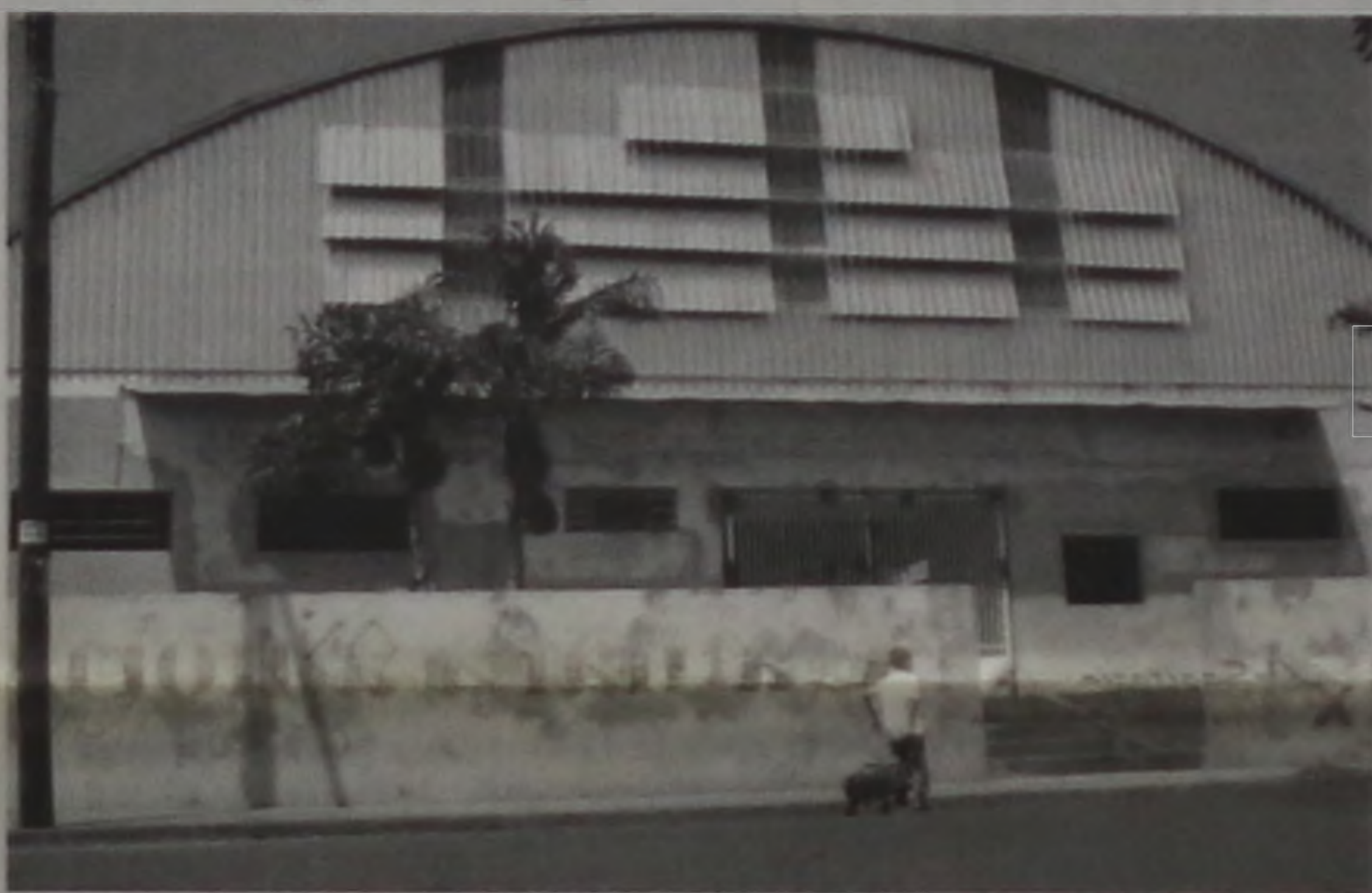
Quadra da escola Bianchini receberá pinturas interna e externa

O projeto prevê reformas dos sanitários masculino e feminino, a substituição das telhas do fechamento frontal, a derrubada dos muros laterais para abrir espaço para a construção de um palco, estacionamento externo para