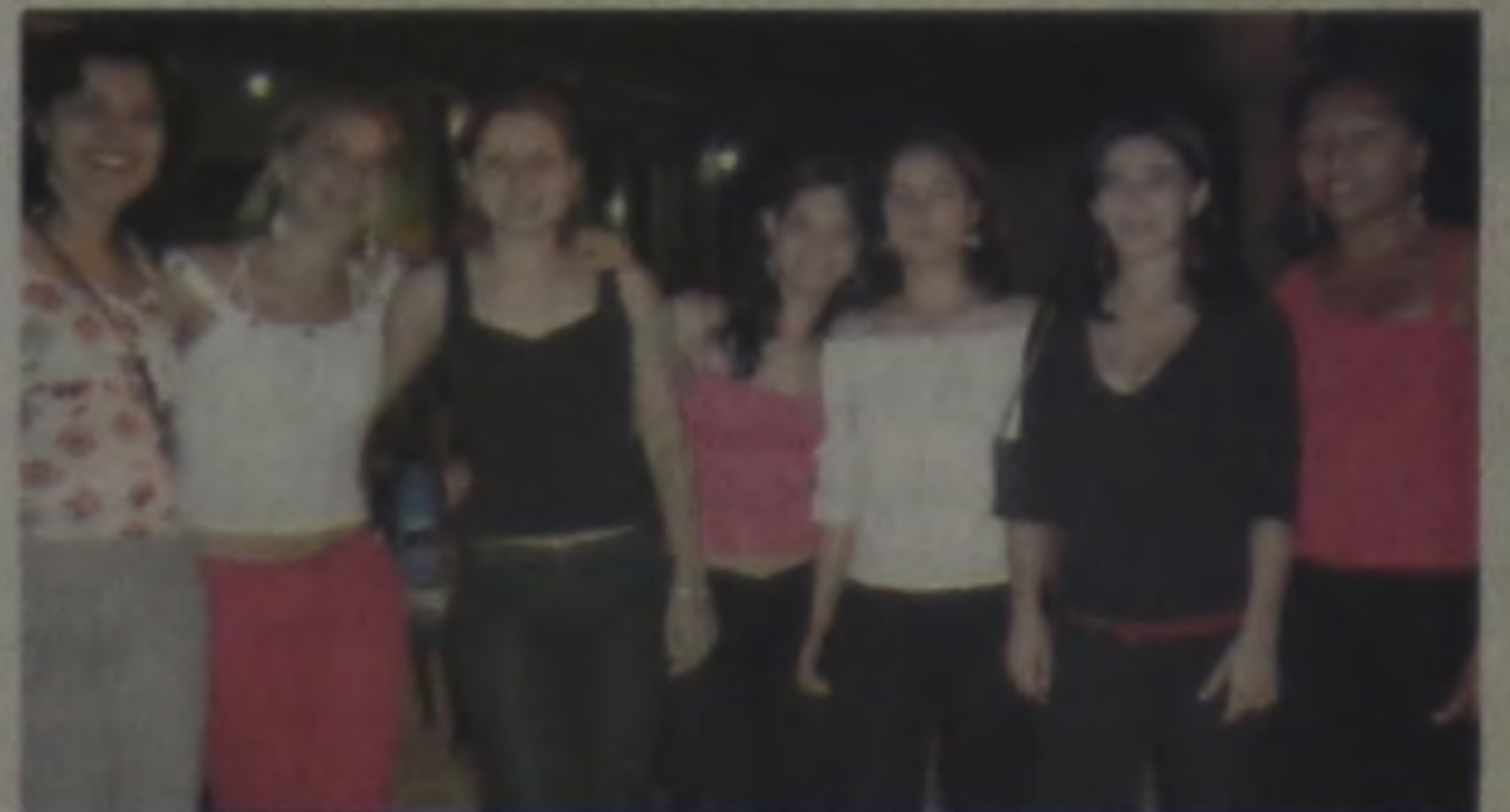
1,2,3...7 mulheres na Choperia Avenida

GENTE Aqui você encontra as melhores notícias e reportagens