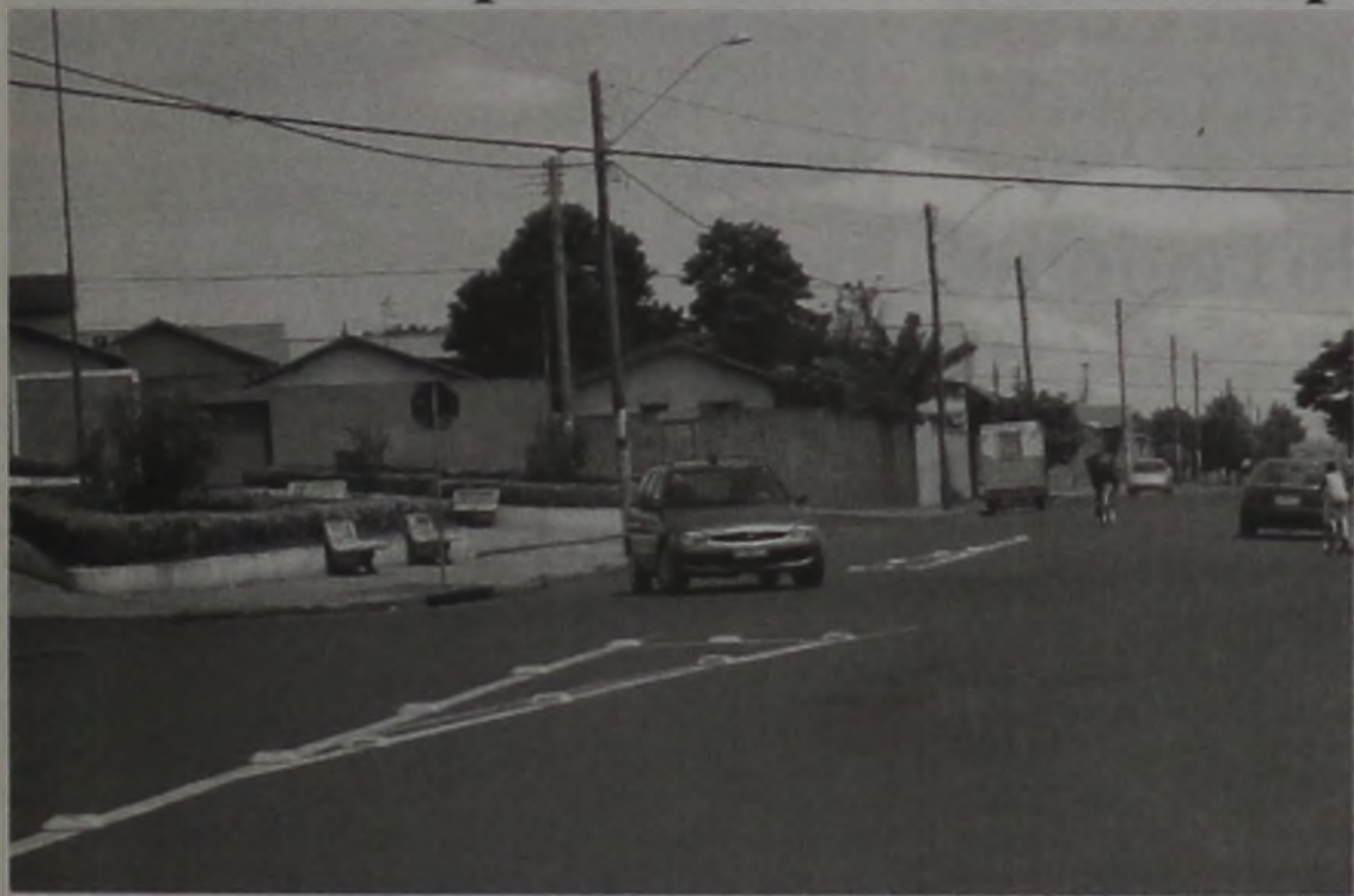
A rotatória implantada no local organiza o trânsito em importante via na Cecap