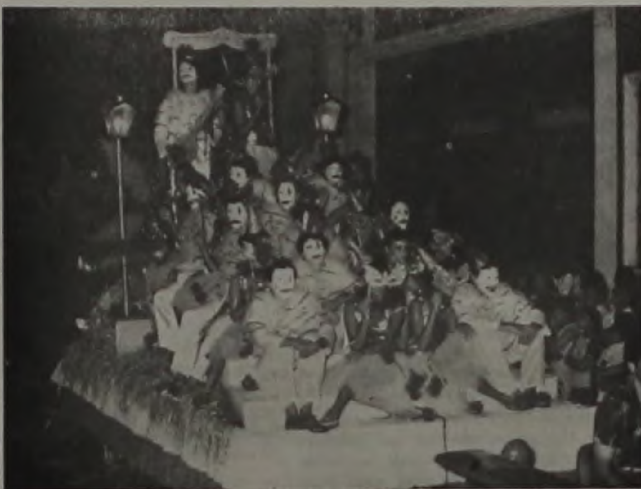
Mais uma vez, apenas uma escola de samba vai desfilar na rua XV.

A Escola de Samba "Acadêmicos da Praça" trará um contingente de 200 integrantes para mostrar o enredo "Nossa História, Nossa Glória", sobre a sua própria trajetória nos carnavais lençoienses. O trabalho, desenvolvido pelo carnavalesco Jura, custou toda a verba de Cr$ 900 mil, destinada pela prefeitura. Para a pro-