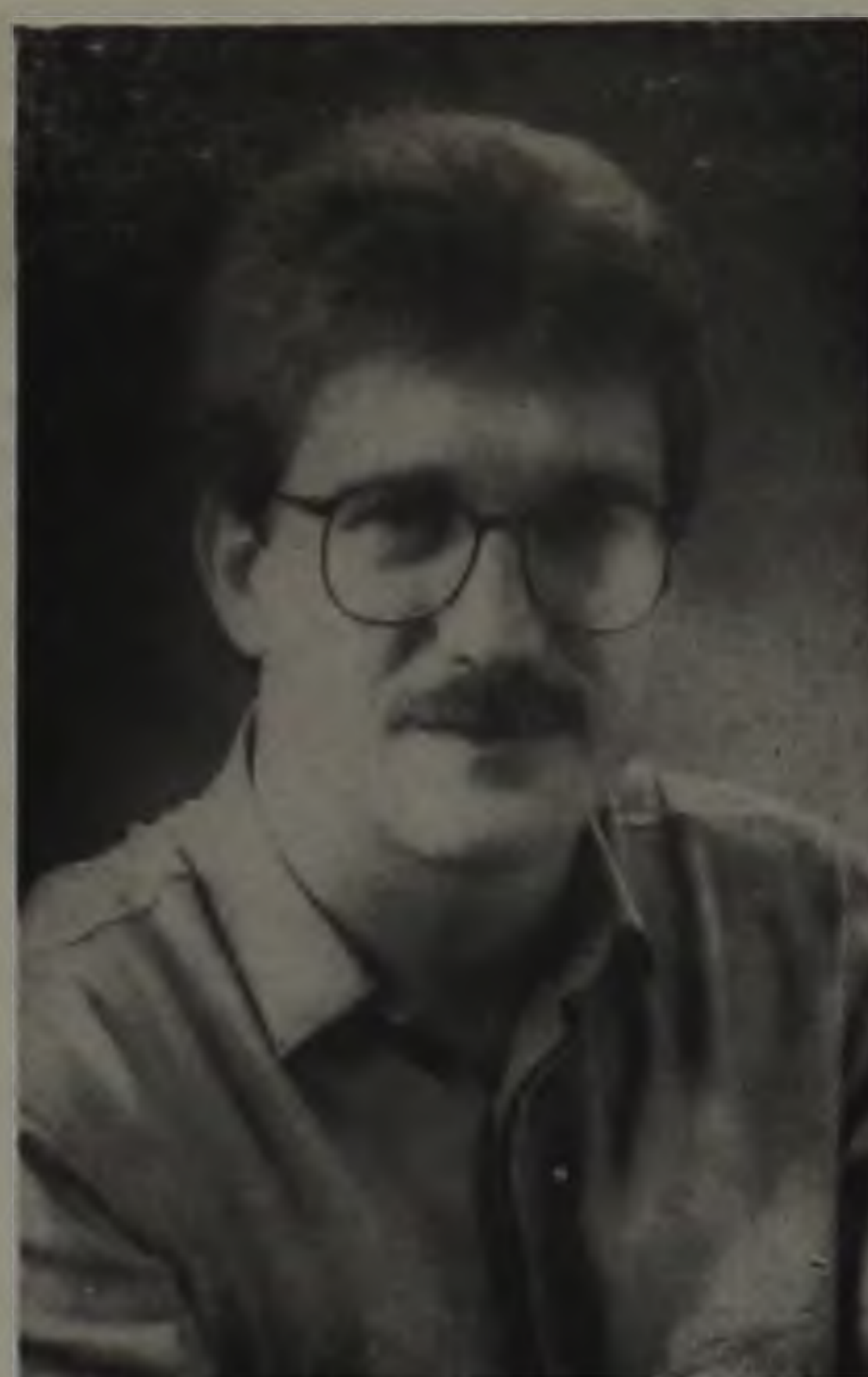
DEPUTADO ESTADUAL MILTON CASQUEL MONTI (arquivo)