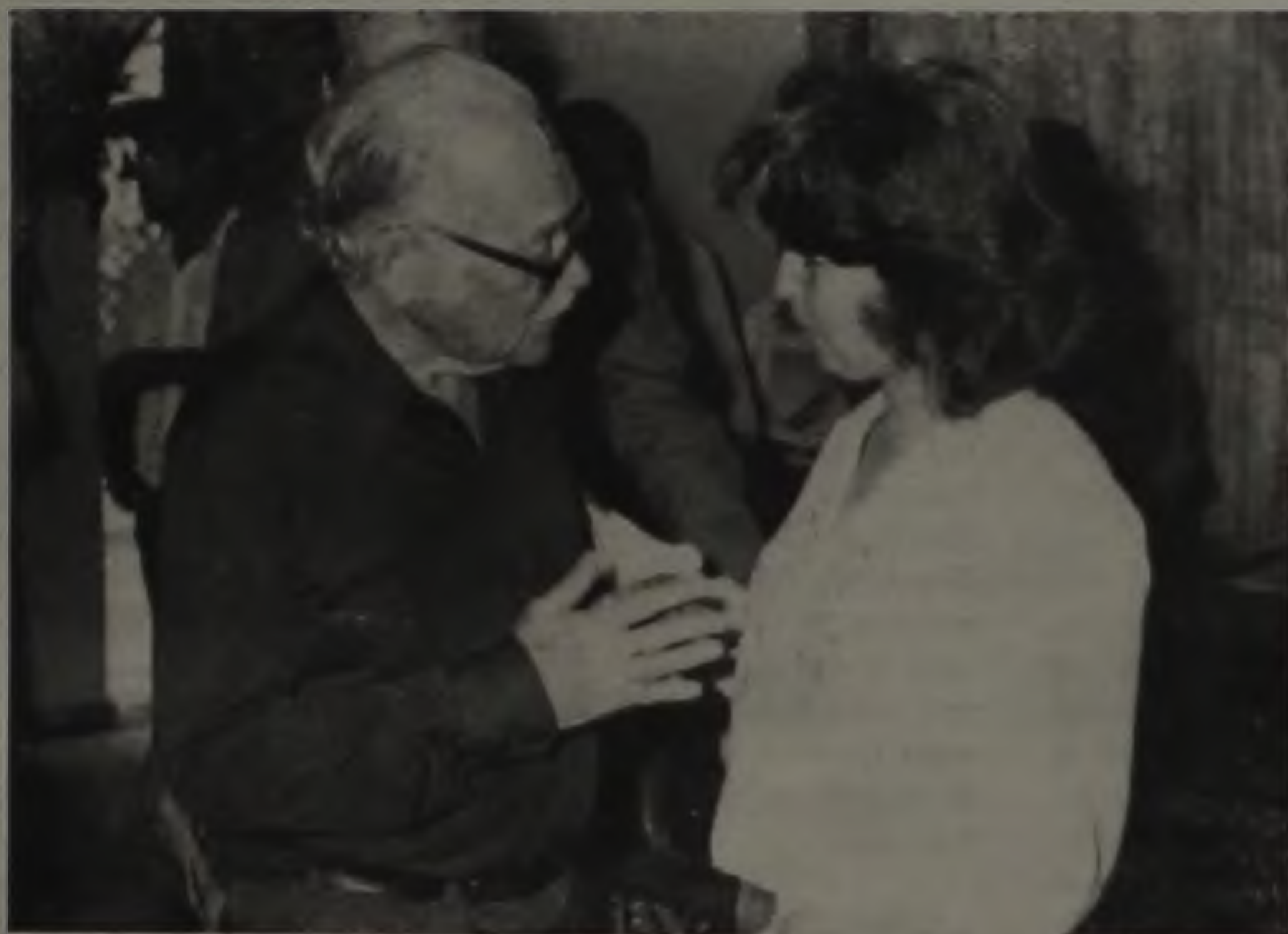
ORÍGENES LESSA, NUM DOS ENCONTROS DE ESCRITORES EM LENÇÓIS

A Prefeitura de Lençóis e a Empresa Brasileira de Correios e Telégrafos (ECT), através de sua diretoria regional, estarão homenageando a memória do escritor lençoense Orígenes Lessa, com o lançamento de um carimbo postal alusivo ao aniversário de seu nascimento, dia 12 de julho. O