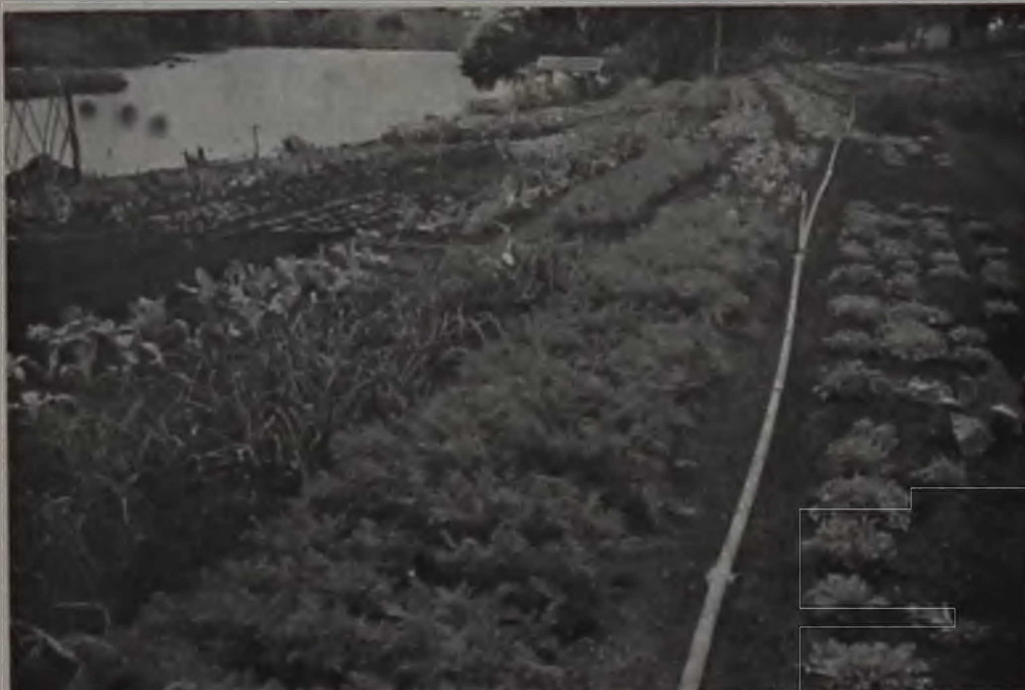
A HORTA MUNICIPAL.

minação foi um gesto de reconhecimento àquela que foi uma das realizações mais importantes da história recente do município. Sequer um tijolo foi acrescentado pela administração atual aos 2.800 metros quadrados construídos naquela escola técnica, cujos objetivos, já definidos em Lei, não tem como serem desviados. Por isso, ao executivo não cabe outra utilização daquele próprio a não ser para a formação profissional, a reciclagem e a atualização industrial entre outros cursos de especialização trabalhista.