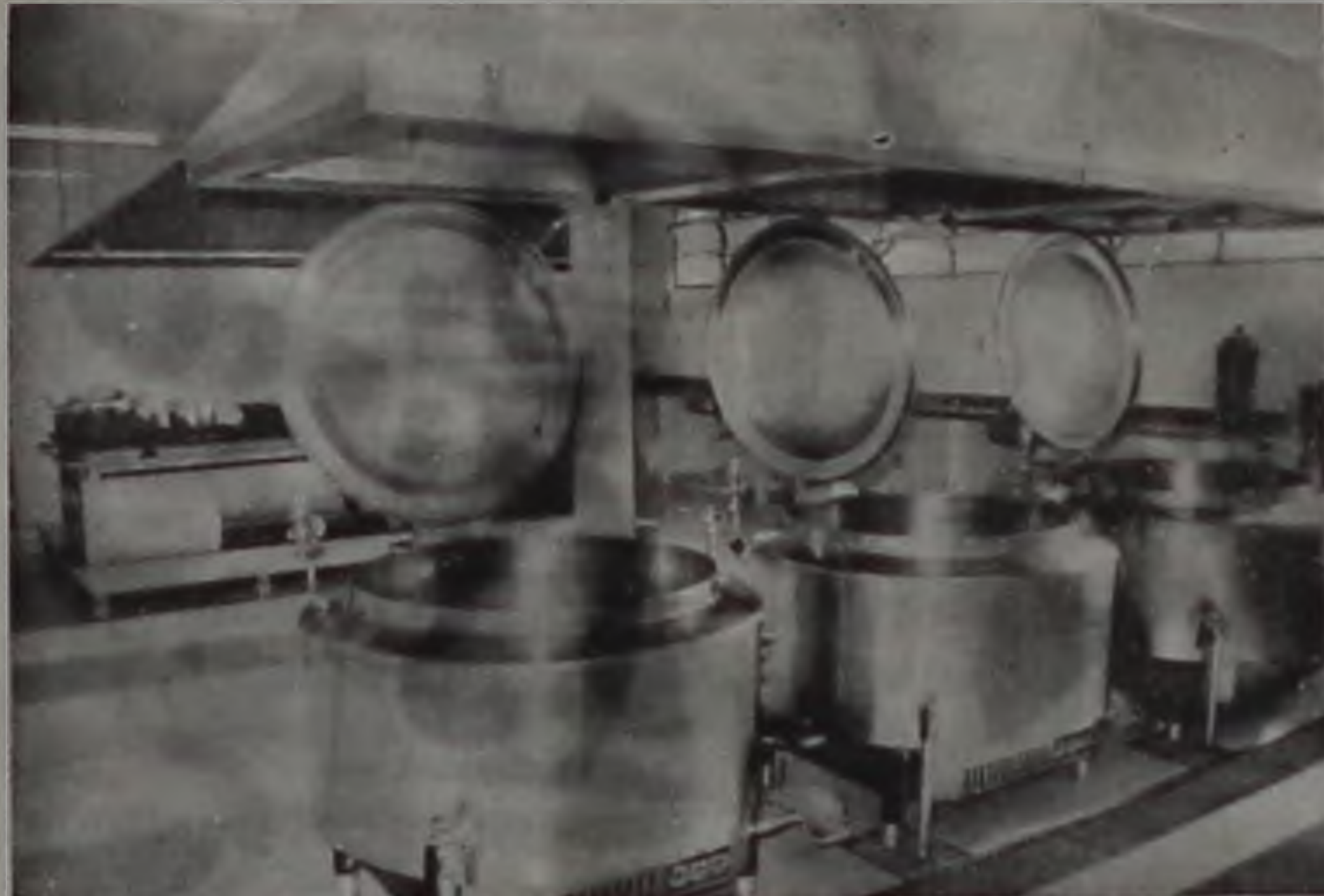
A COZINHA PILOTO.

Os gráficos que demonstram no folheto a quantidade de casas entregues nos últimos 15 anos, também contêm informações falsas. Dos 1.124 casas atribuídas à primeira gestão de Ezio, ele construiu apenas 250 no núcleo João Zillo. A primeira etapa do núcleo habitacional "Luiz Zillo" com 440 unidades, foi construída e entregue pelo prefeito anterior, Rubens Pietrariá, que também iniciou a segunda etapa, com 434 unidades que foram apenas concluídas e entregues por Ezio.