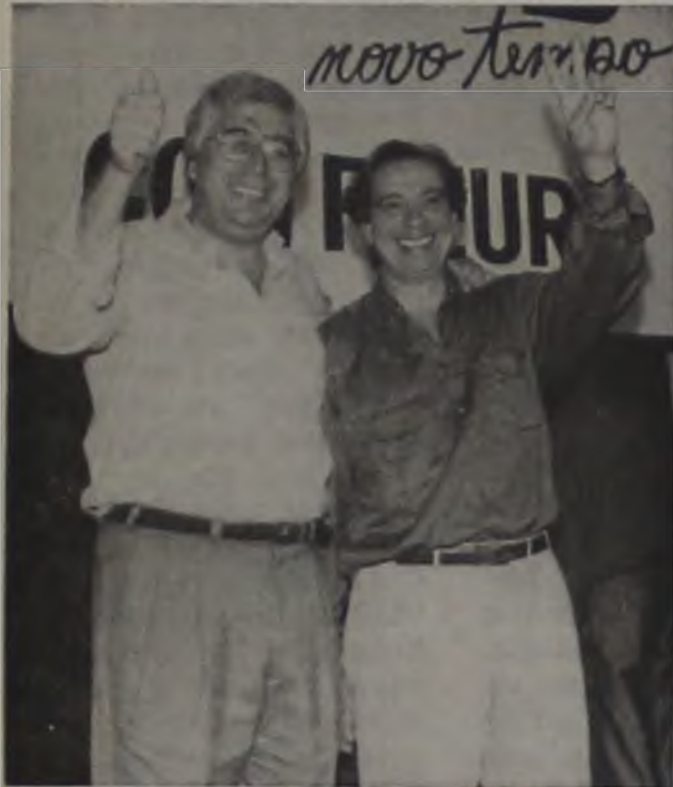
A exemplo do apoio que dedica ao pré candidato do PMDB à Prefeitura de São Paulo, Aloysio Nunes, Fleury reafirma a sua disposição de participar diretamente da campanha no Interior.

O Governador Fleury Filho enviou mensagem de cumprimentos ao presidente eleito para o diretório local do PMDB, Ideval Paccola, e reafirmou o seu propósito de participar da campanha à eleição municipal de