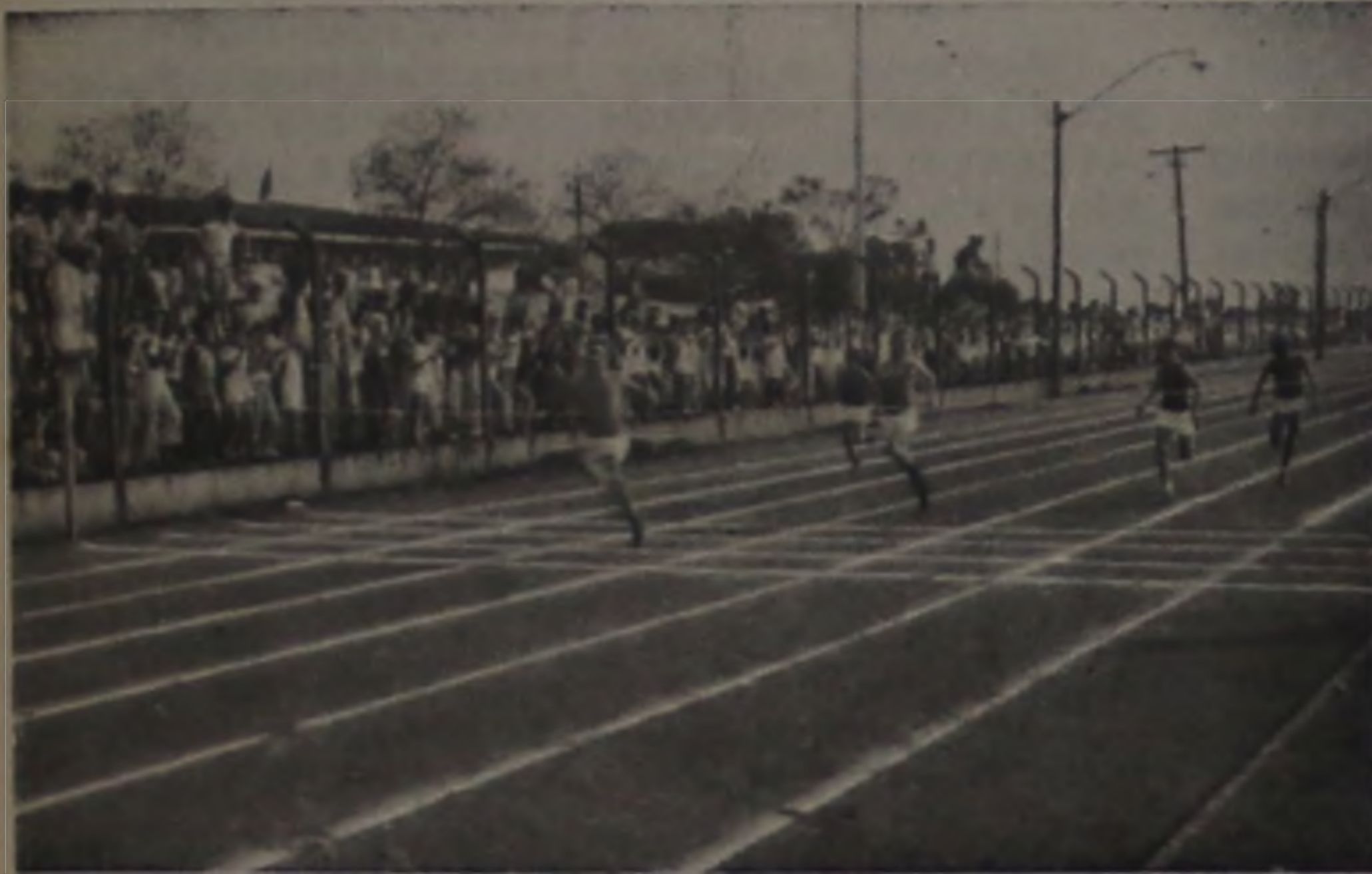
Assim como o vôlei, nosso atletismo esqueceu a tradição e só teve uma heroína medalhista.

O esporte lençoense vive uma situação vexatória por não ter conseguido nos Jogos Regionais as marcas e posições suficientes para classificar representantes da cidade aos Jogos Abertos do Interior, que acontecerão em Araçatuba no mês de outubro. Em contrapartida, atletas aqui formados e até residentes, conseguiram medalhas e