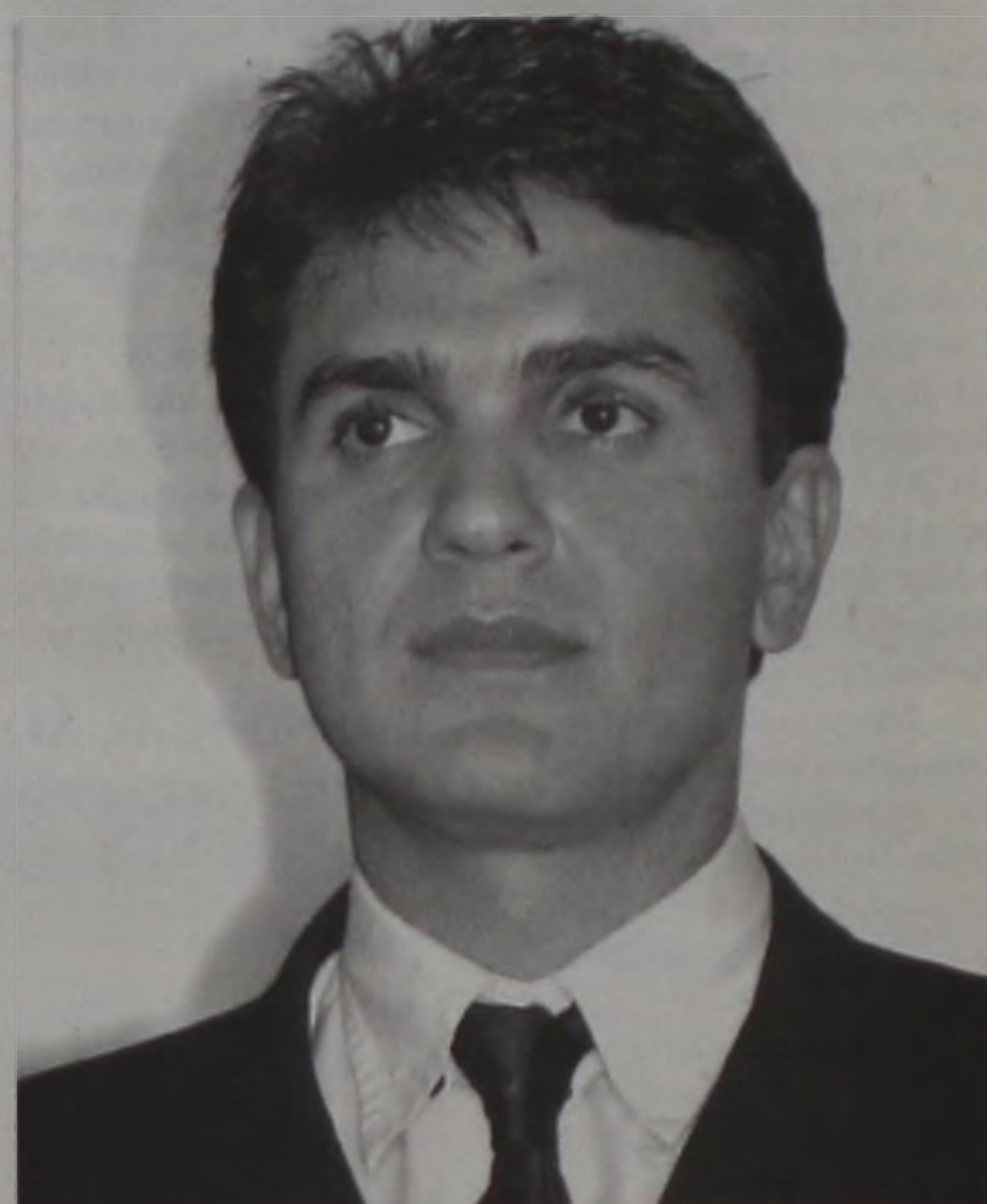
O secretário estadual da Educação, Gabriel Chalita, que abre a Semana da Família com palestra no salão paroquial do Santuário Nossa Senhora da Piedade

18 de agosto. Os interessados podem se inscrever pelo telefone (14) 3223 9243, das 8h às 12h. O curso acontece de 23 a 26 de agosto, no auditório do INSS Bauru, que fica na rua Rio Branco, 12-27. As vagas são limitadas.