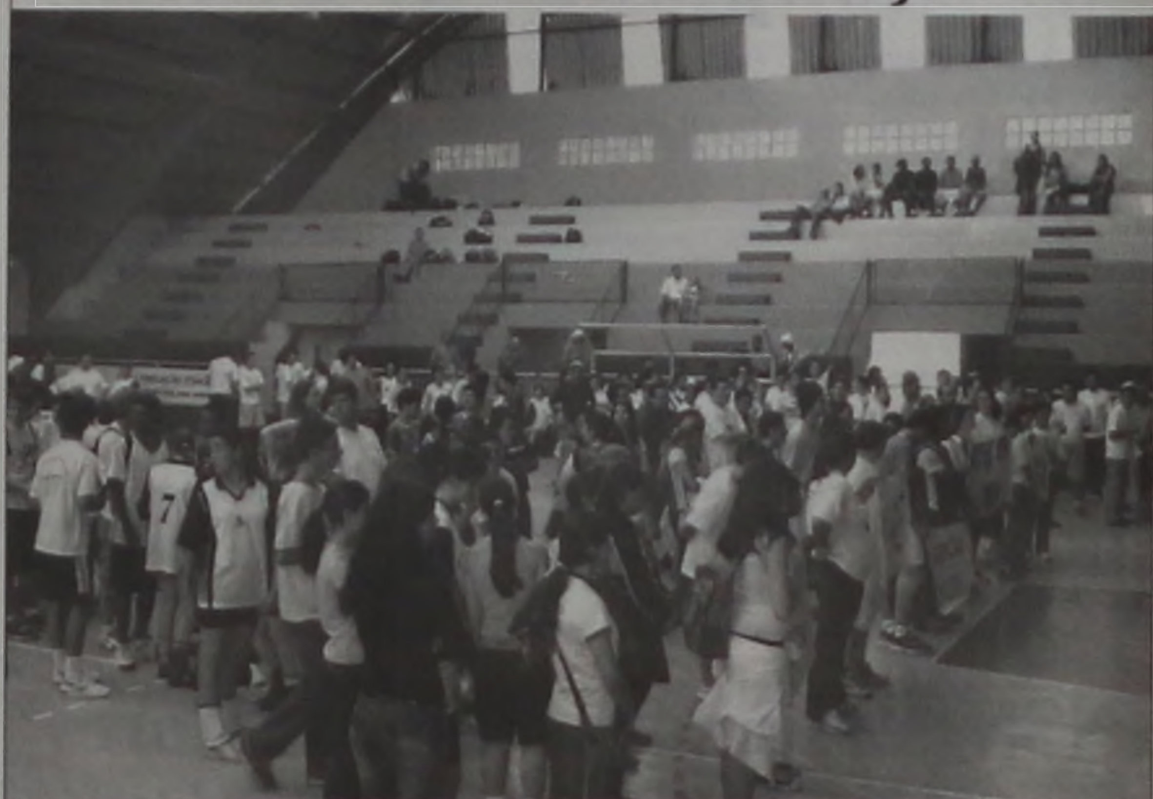
Evento reuniu jovens de 4 cidades

Os telecistas da comunidade católica de Lençóis Paulista promoveram no sábado 31 e domingo 1, o 2º Inter-RP (Interação Regional Pastoral). O evento que teve como organizadores