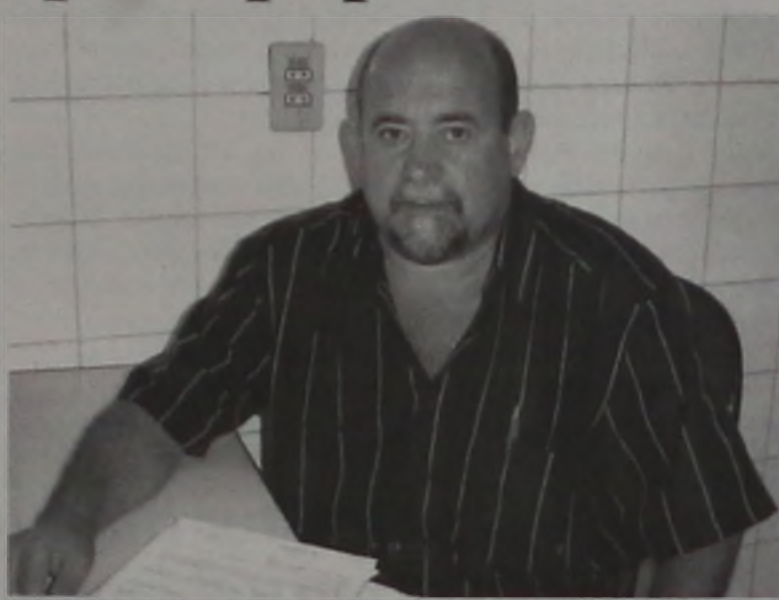
Empréstimo foi conseguido graças ao empenho do presidente do Sindicato

O valor emprestado será de até 30% do salário do funcionário. Os juros variam de 1,75% a 2,60%. Para tomar o dinheiro emprestado, o interessado deve levar ao banco o RG, holeri-