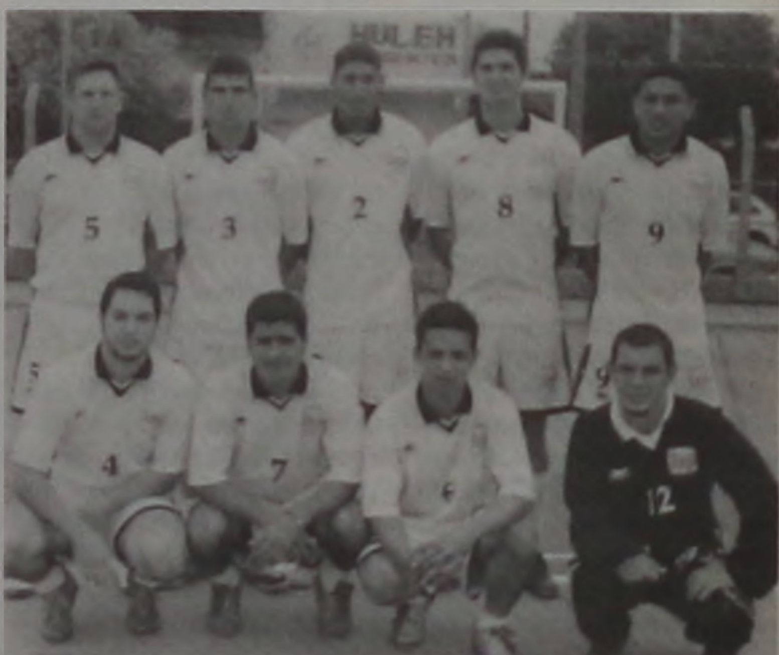
Equipe Bustos Peredo conquistou vaga para próxima fase

Amanhã pela última rodada da primeira fase jogam, Nações x Safrasul às 8h; Cruzeiroinho x Nações Unidas às 9h; MAC x JM às 10h e Thundercats x Zabet às 11h.