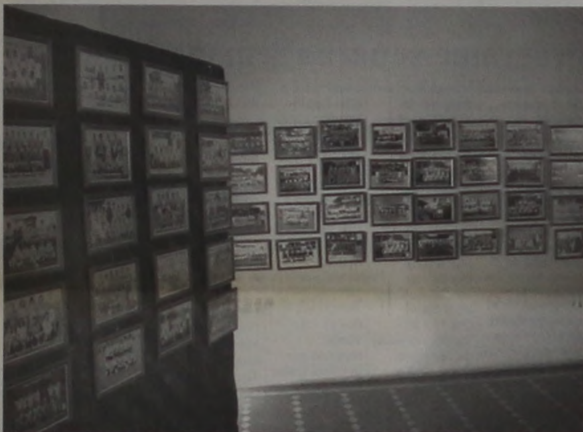
Exposição estará aberta ao público até o dia 31, na Casa da Cultura

Foi aberta ao público ontem à noite, na Casa da Cultura Professora Maria Bove Coneglian, a exposição de fotos que contam a história de atletas e do esporte lençoense. Serão expostas 300 fotos das diversas modalidades esportivas