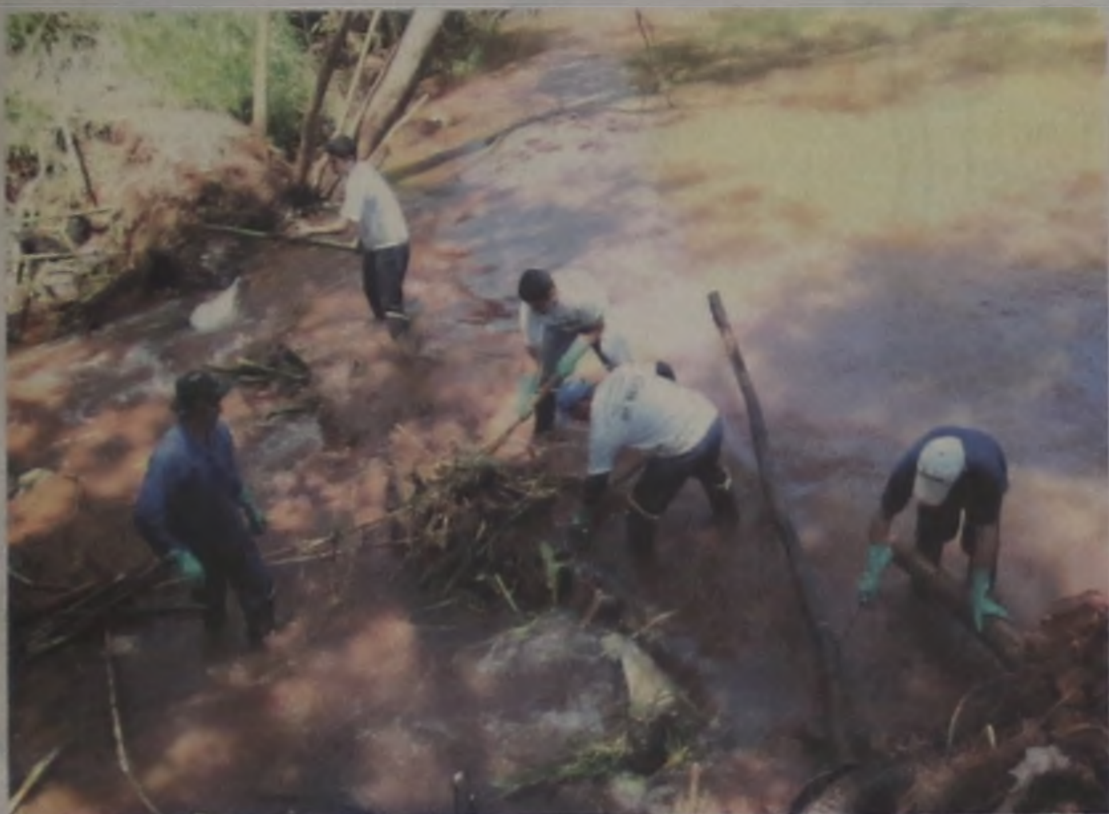
A ONG Nossa Terra realizou nos dias 13 e 14 de novembro, uma operação de coleta de materiais inorgânicos, no rio da Prata...