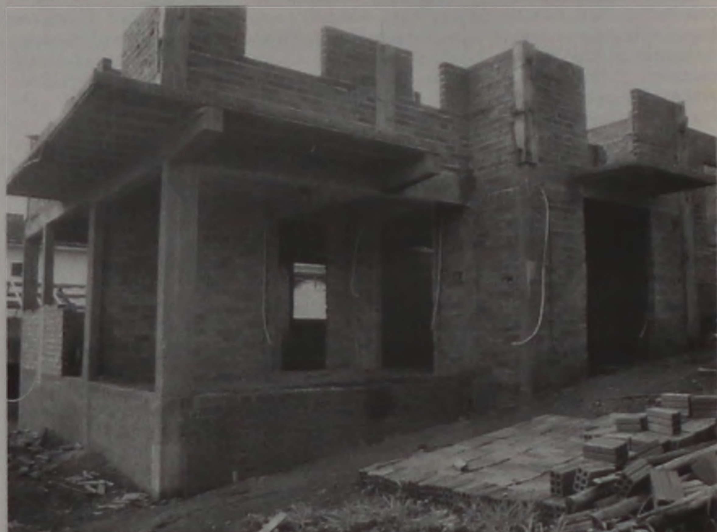
O setor de construção civil liderou as demissões em setembro, com 74 postos fechados

Setor perde desempenho e faz setembro fechar balança do emprego no vermelho, mas acumulado do ano ainda é positivo