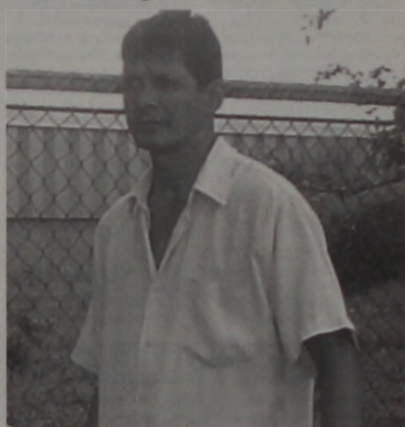
Prefeito eleito de Areiópolis já pensa na transição de governo

Isso tudo para compor o primeiro escalão. "Para o segundo e terceiro escalão, a tendência é que eu utilize funcionários de carreira da Prefeitura", afirmou.