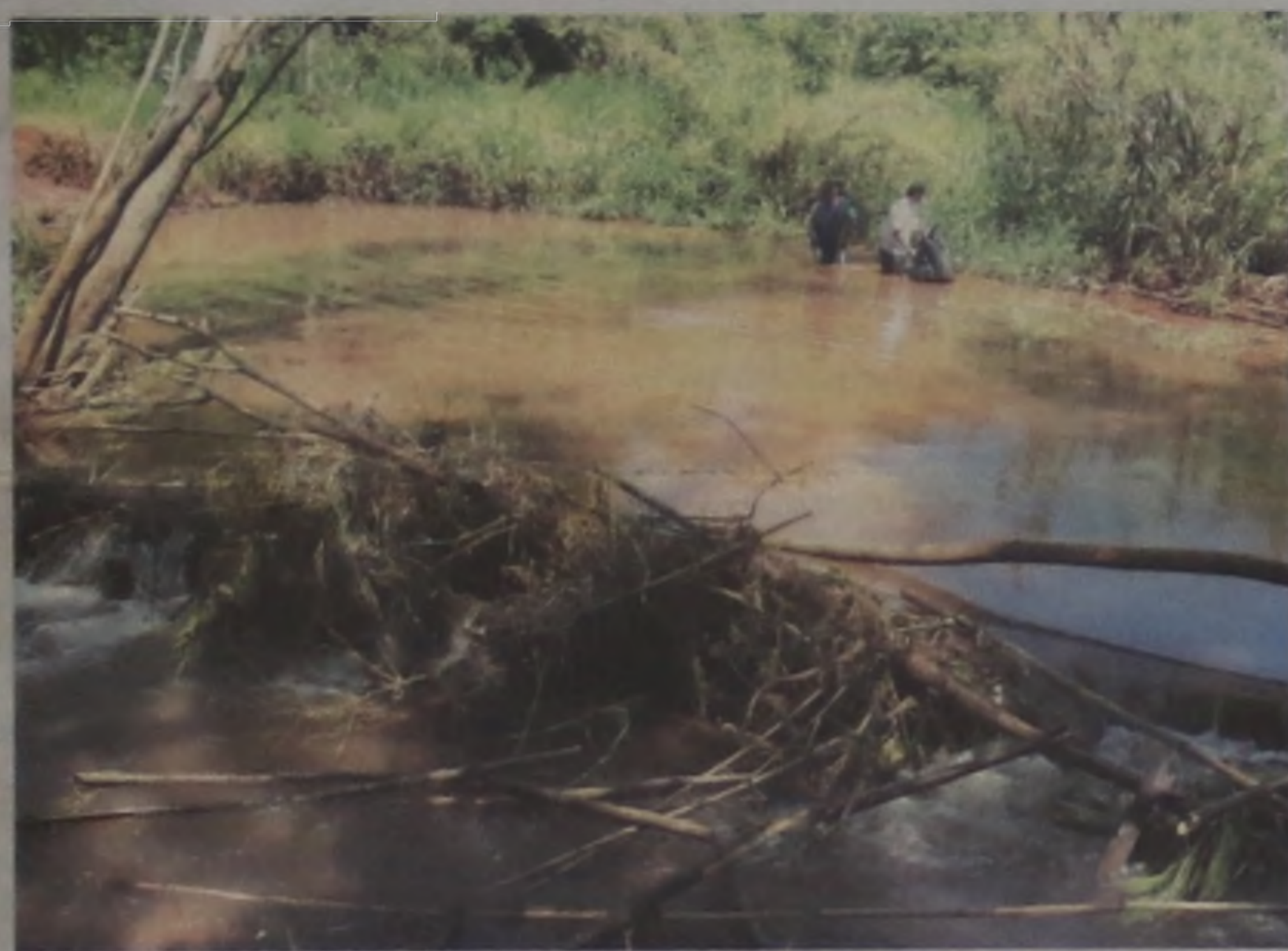
...o trabalho dos voluntários durou cerca de 12 horas, e ainda assim faltam cerca de quatro quilômetros a serem revisados...