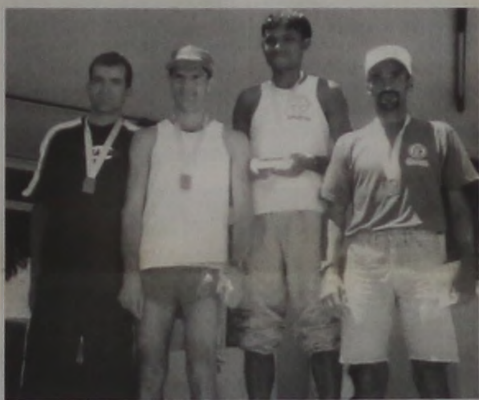
Atletas da UME premiados em Botucatu