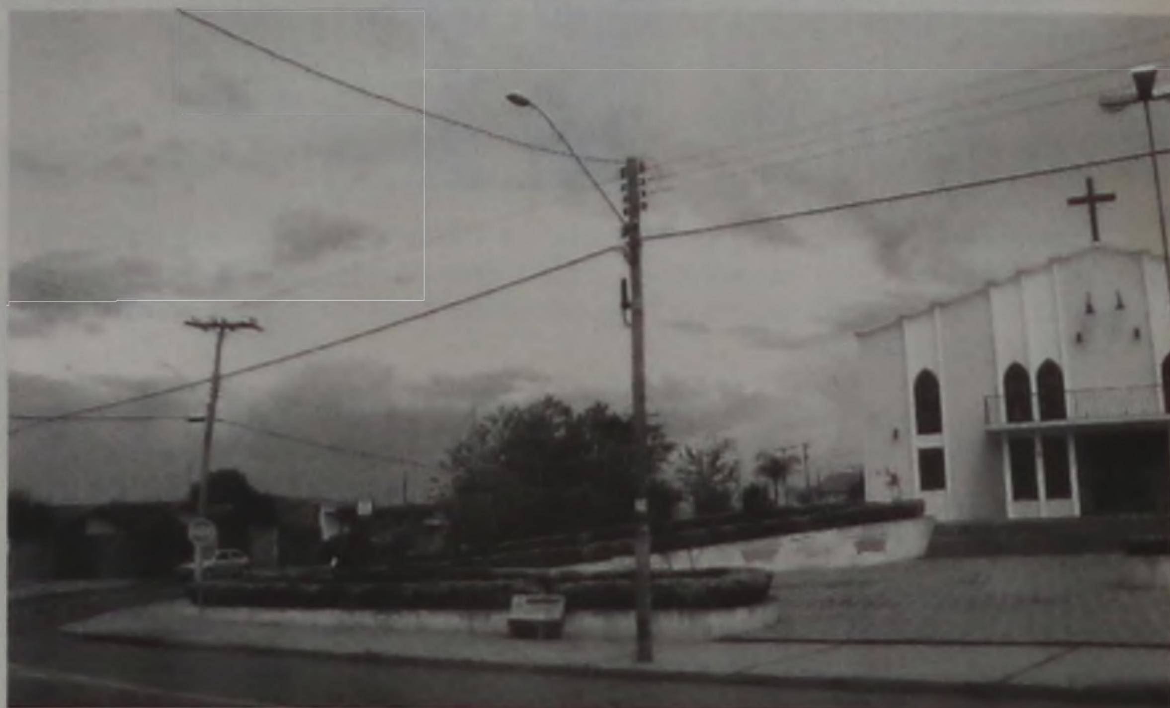
Eleições definem direção da Associação de Moradores da Cecap e Itapuã