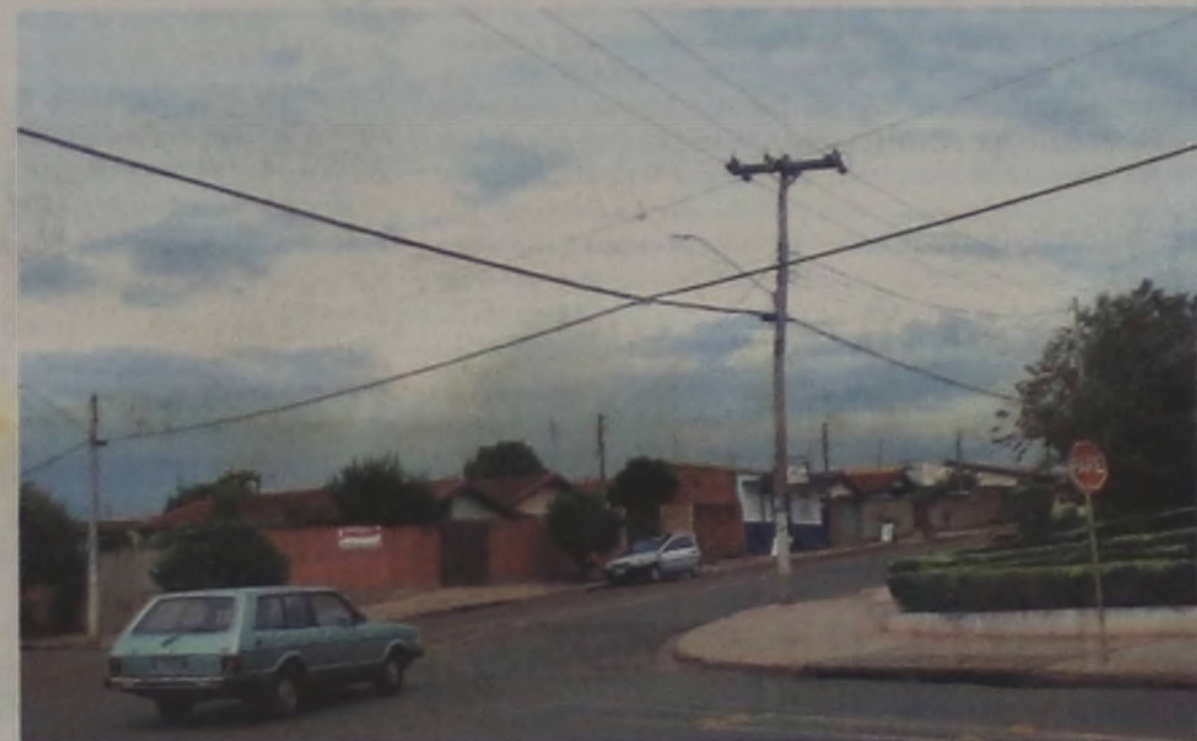
Cecap e Itapuã elegem amanhã o presidente da Associação de Moradores