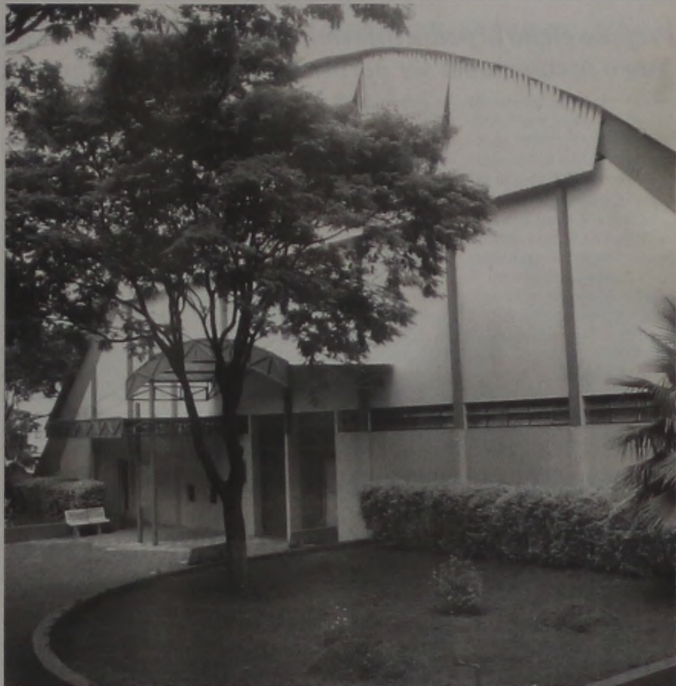
Tonicão é palco das partidas do campeonato

No grupo 1 estão Expressinho, Thundercats, Bustos Peredo e Cial. Sto Expedito. No grupo 2 estão Caju, Associação Primavera, Fortaleza e UME SUB-21. União Central/Atitude, São Caetano, União Primavera e Bicletaria Rondon formam o grupo 3. O grupo 4 é composto por Independente, Brec e Inter. No grupo 5 estão Prefeitura Municipal, Frigol e UME/Infanto. No grupo 6 estão Safra-Sul, Mônaco e Santa Luzia. Duratex, O Mais Querido e Grêmio Omitex B fecham o grupo 7. Grêmio Omitex A, Unimed/Polifer e New Star completam o grupo 8.