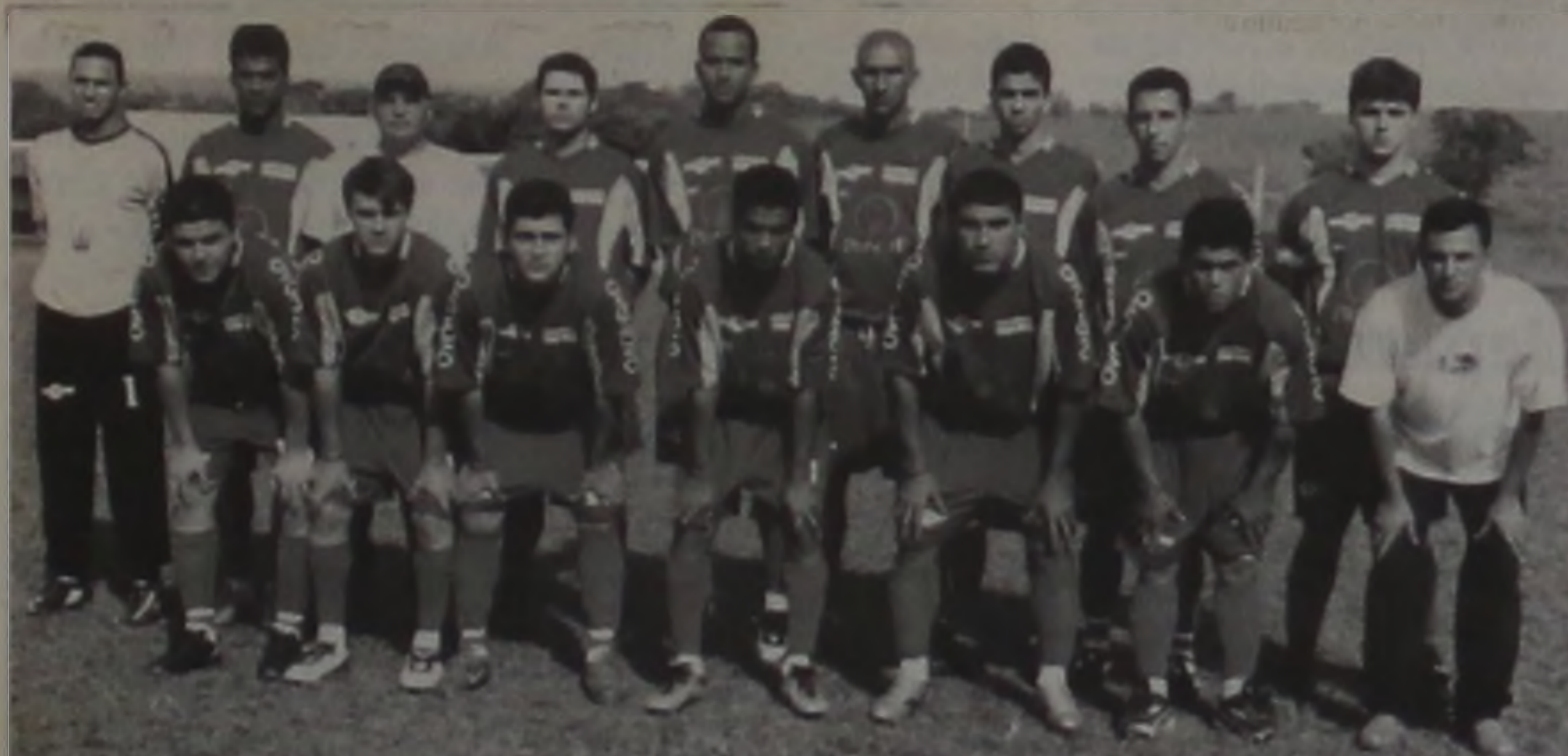
Novo Bayer, campeão da Série Prata

Em partida emocionante, a equipe da Padaria Pão Quente levou o título do Campeonato Varzeano 2004 – Série Ouro, promovido pelo Departamento de Esportes, Recreação e Lazer de Areiópolis. A final foi realizada no domingo dia 14, no estádio municipal Geraldo Pereira de Barros. No tempo normal Padaria Pão Quente e Novo Bayer terminaram a partida empatada em 0x0. Na prorrogação as duas equipes empataram em um gol; nas penalidades a Padaria Pão Quente levou a melhor e venceu por 2x0, ficando com o título do torneio.