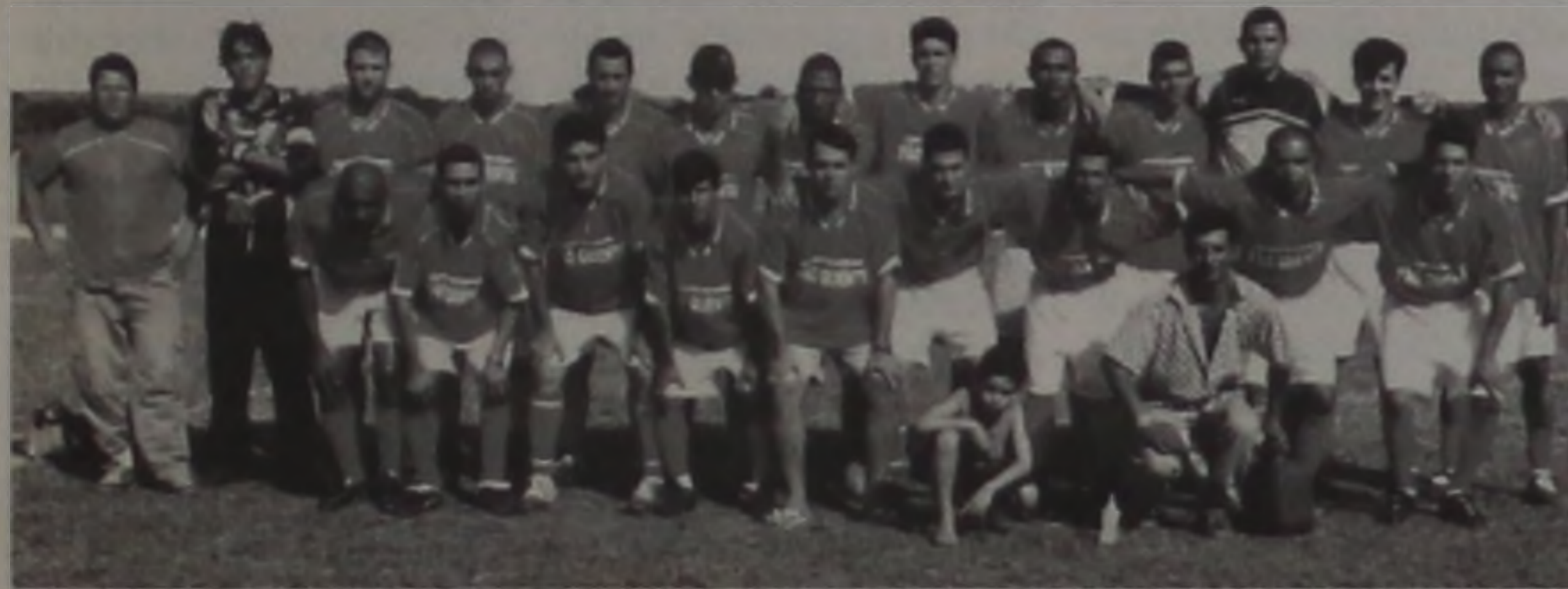
Equipe da Padaria Pão Quente, campeã da Série Ouro