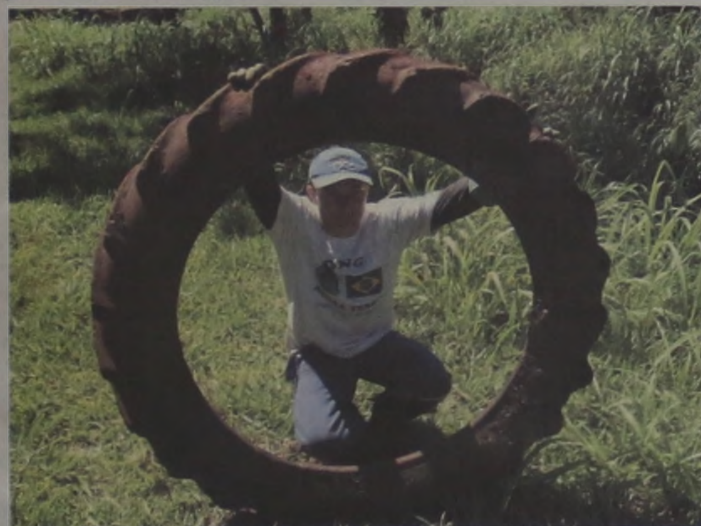
...ao todo, foram recolhidos cerca de 1,2 toneladas de lixo de todas as espécies, inclusive um pneu de trator que estava no leito do rio

Construção Civil perde desempenho e faz balanço do emprego fechar setembro no vermelho; no entanto, 2004 deve terminar com saldo positivo