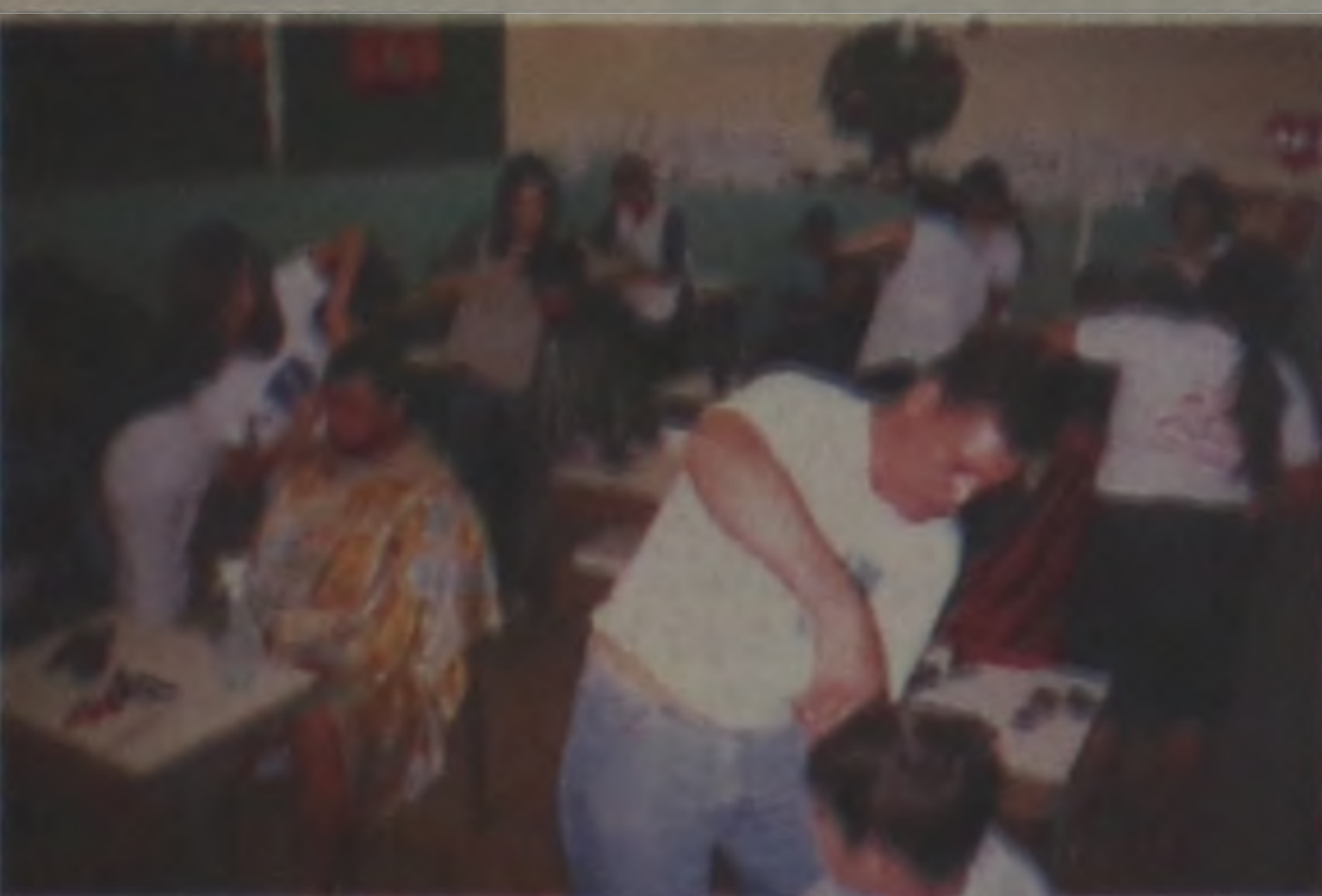
EFAC (Escola de Formação e Aperfeiçoamento de Cabeleireiro) dá show de solidariedade e cortam 106 cabelos na Escola Municipal de Borebi.

Quem faz e acontece em Lençóis não escapa às lentes da coluna Gente e você confere tudo, com exclusividade