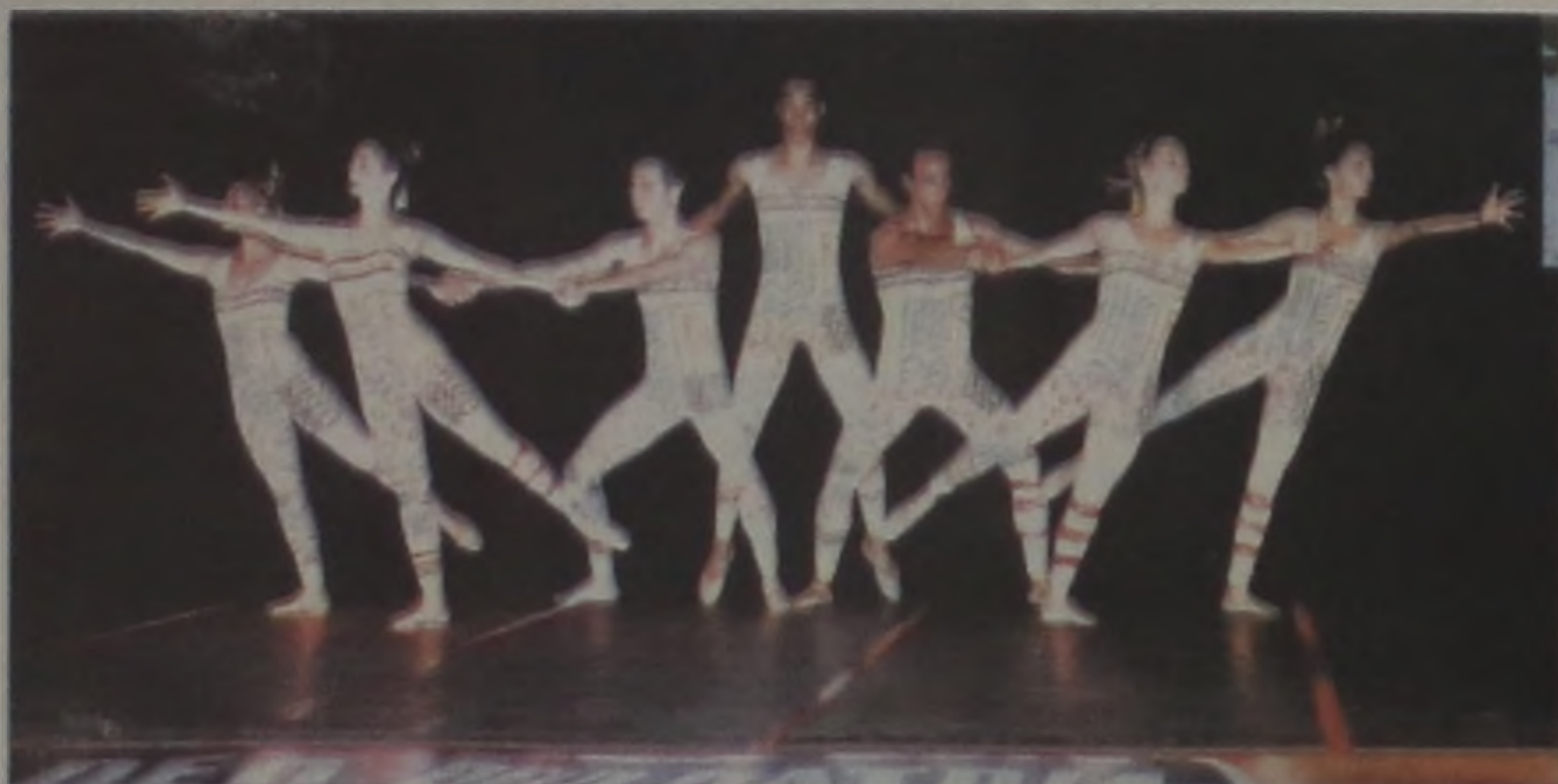
Da telona para o palco, a coreografia Lisbela e Prisioneiro é uma adaptação feita para o balé pela equipe da Academia Tablado Flamenco e que em breve poderá ser vista pelo público lençoiense