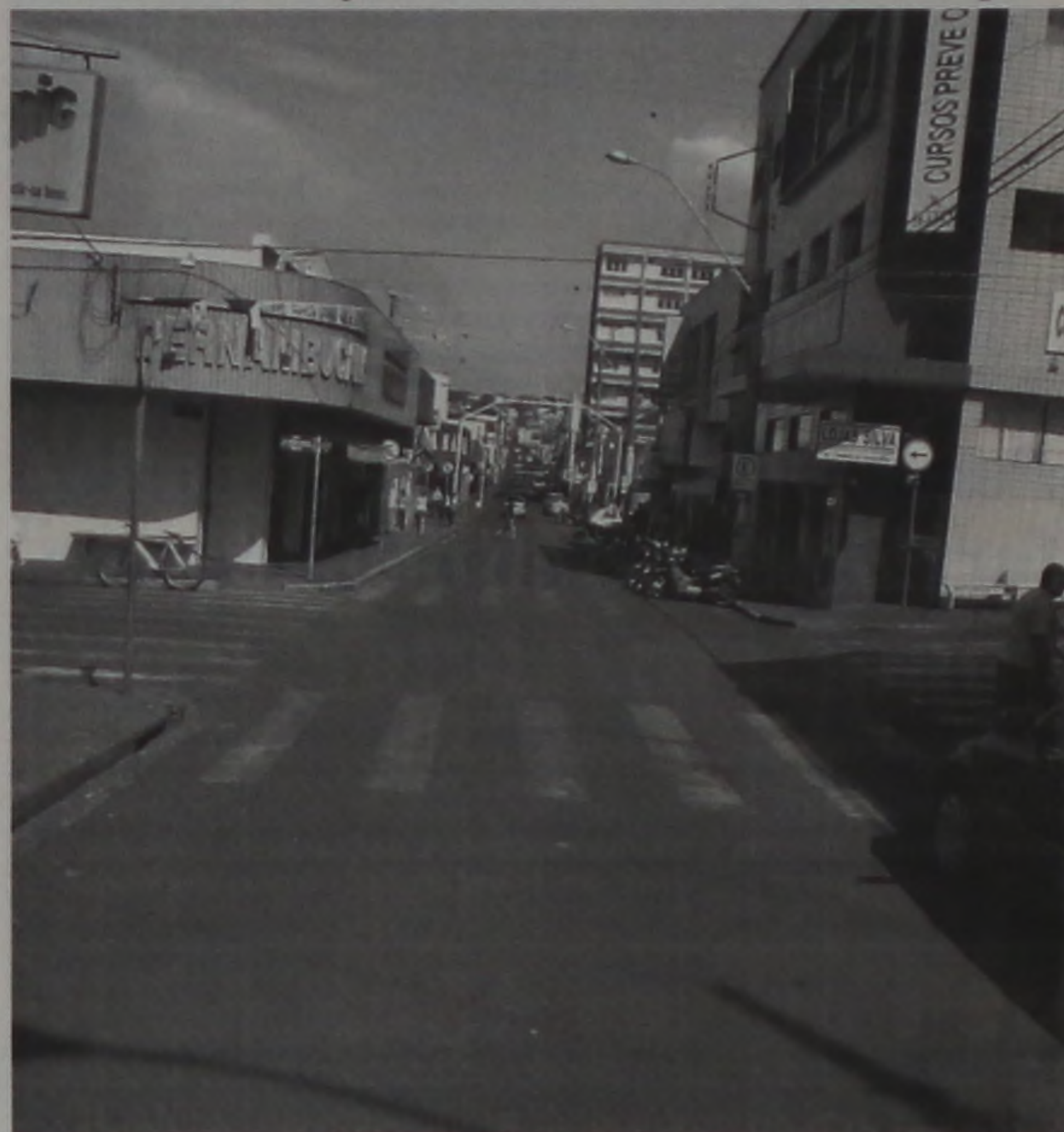
O comércio lençoense se prepara para o Natal de 2004

Comerciantes associados à entidade fazem promoção no início da semana; entidade estima que primeira parcela do 13º salário deve injetar cerca de R$ 10 mi no Município