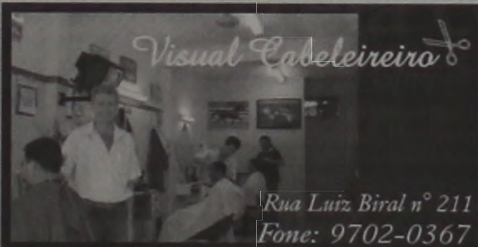
Rua Luiz Biral nº 211 Fone: 9702-0367