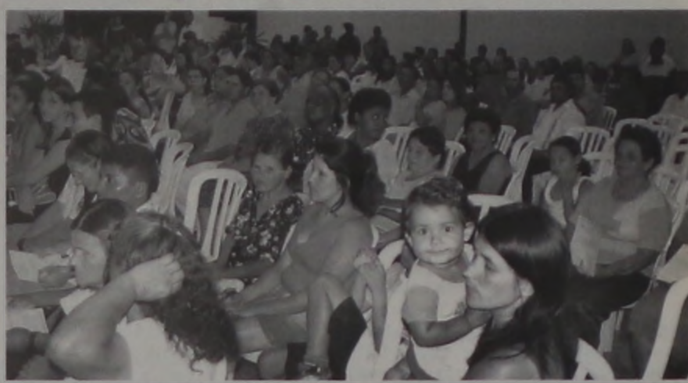
O primeiro grupo de adultos alfabetizados pelo programa Ciranda da Educação: socialização