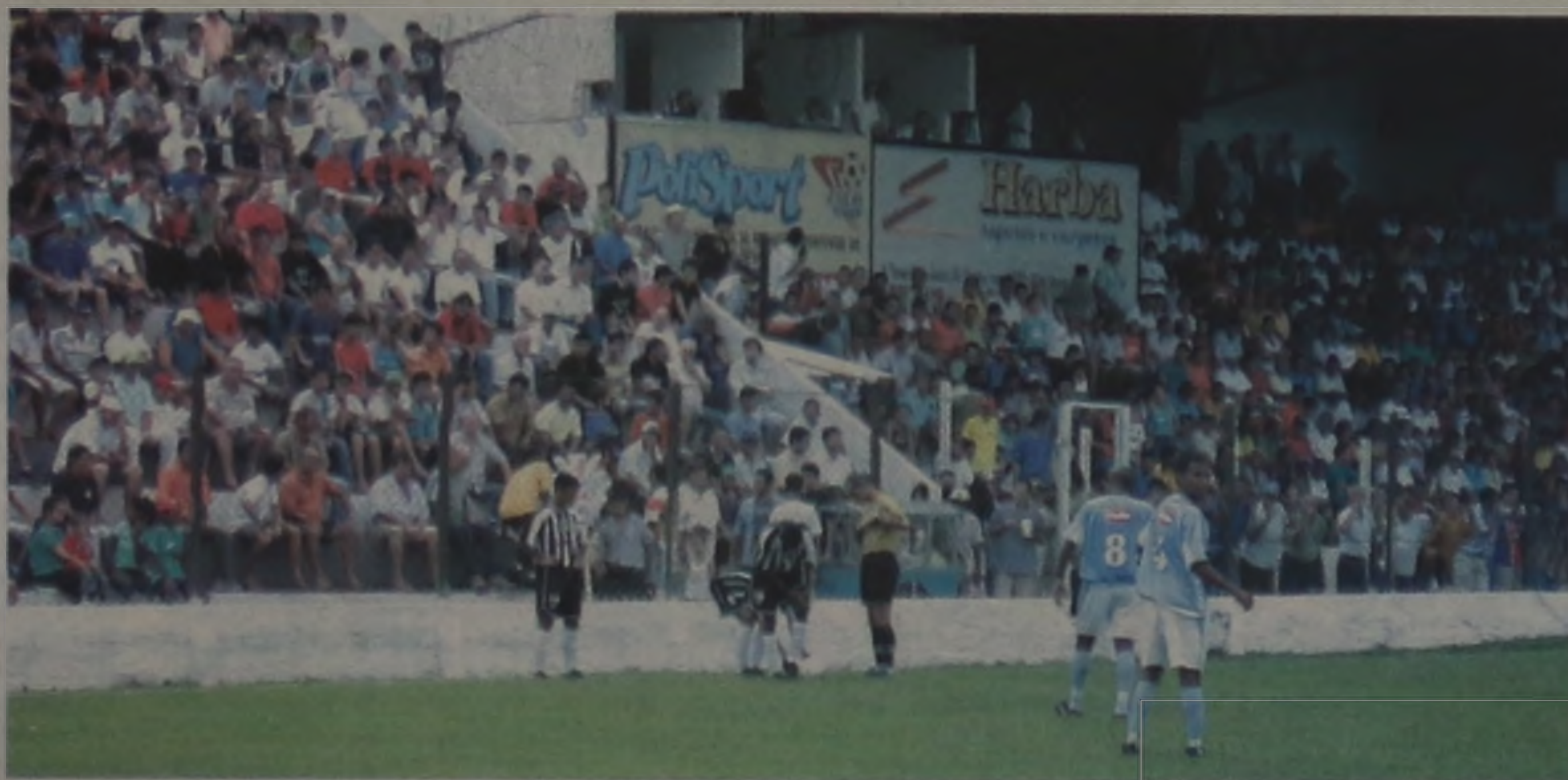
Em 2004, o grupo com sede em Lençóis Paulista trouxe Bahia, Goiás e Marília

Alvinegro fecha com Matsubara para receber Copa São Paulo de Futebol Júnior em janeiro, uma das principais competições do futebol nacional