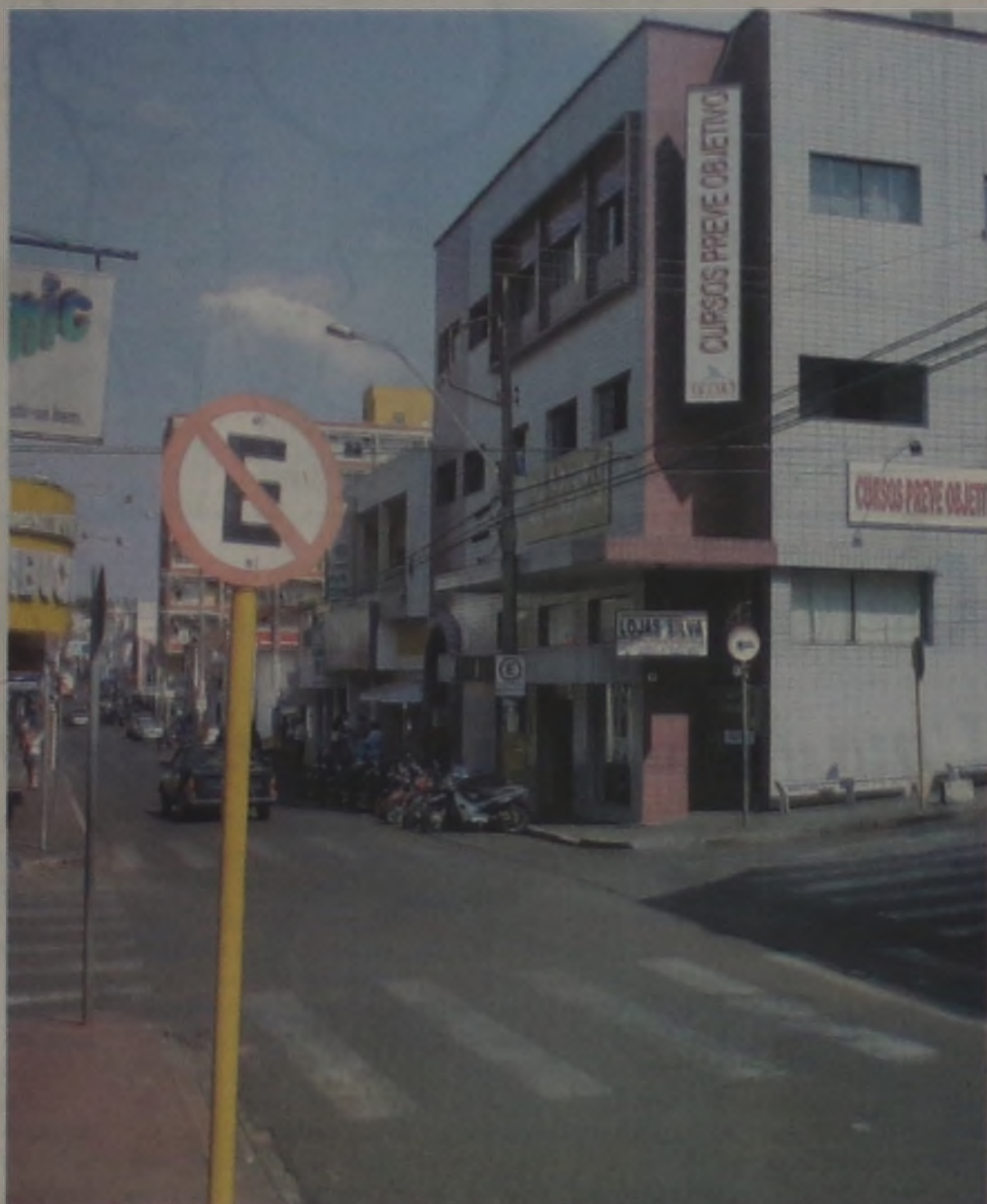
Comércio se prepara para vendas de final de ano