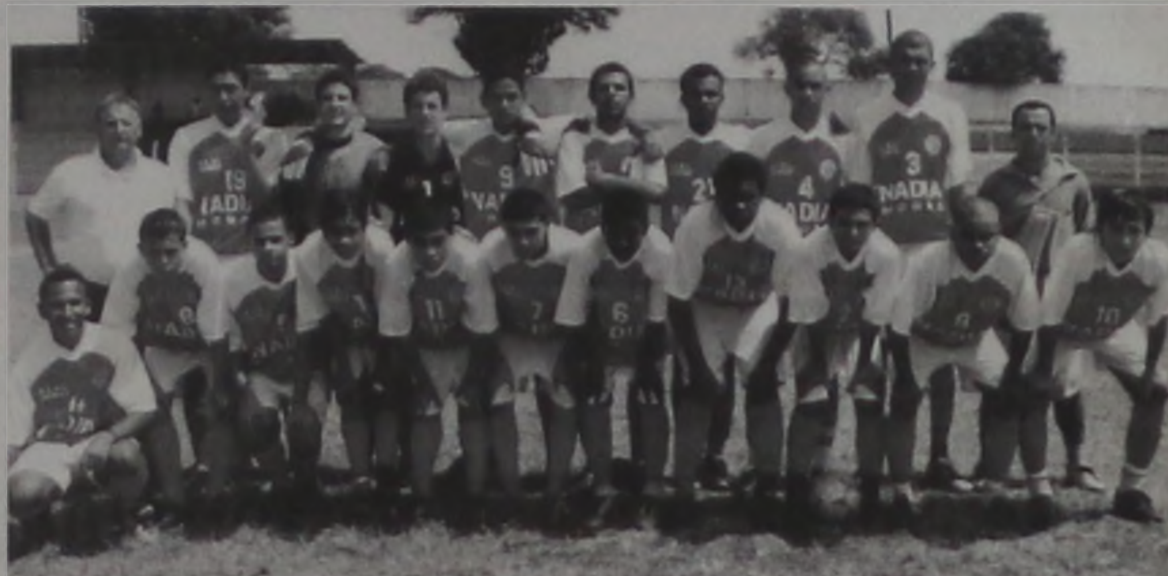
Equipe joga contra Botucatu amanhã, na casa do adversário

A equipe de futebol masculino de Areiópolis, categoria sub-18, disputa amanhã, contra Botucatu, a semifinal do Campeonato Re-