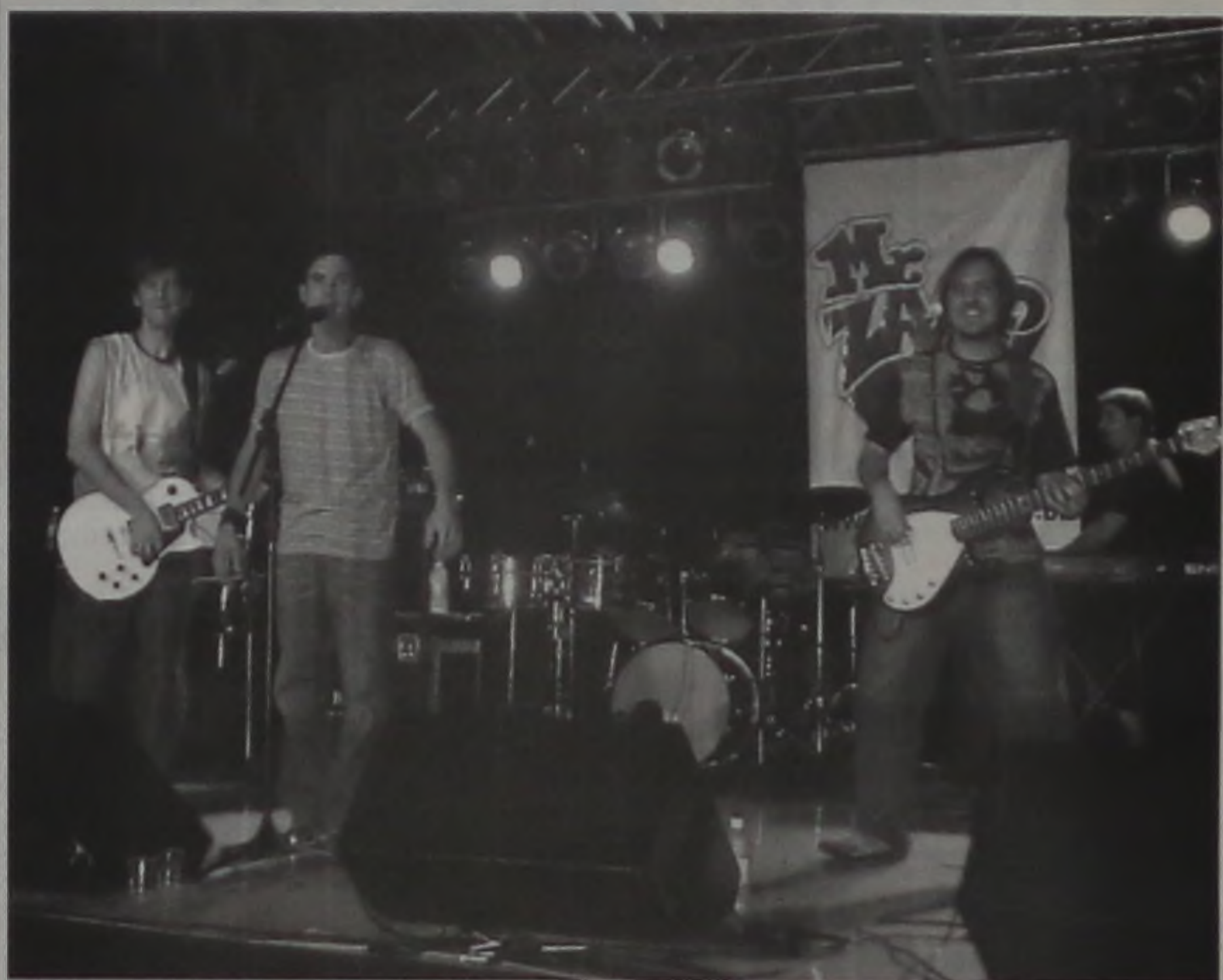
A Banda Mr Zaap encerra o evento em celebração à consciência negra

Acontece amanhã, a partir das 14h, na Praça Comendador José Zillo, a Concha Acústica, um evento em comemoração ao Dia Nacional da Consciência Negra (comemorado no dia 20 de novembro). A festa reúne grupos de capoeira, pagode e hip-hop, que comemorará o aniversário da morte