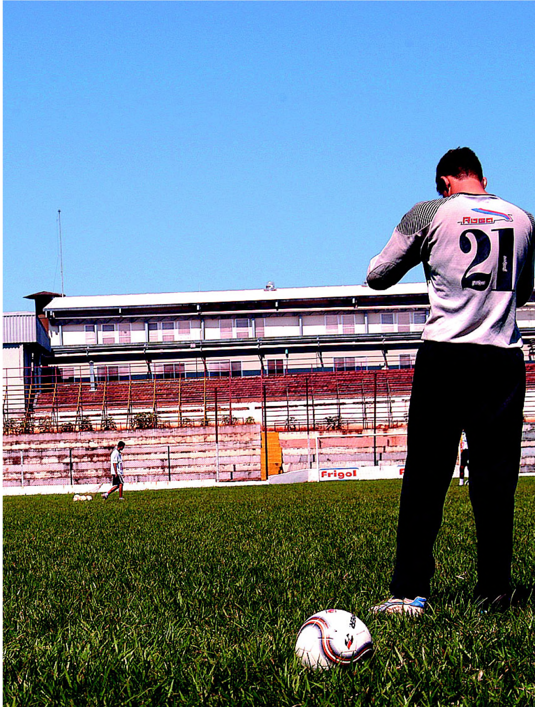
Equipe do CAL treina para a estreia no Paulista da Série B contra o Santacruzense

Jovens integrantes do projeto social Virando o Jogo abriram na sexta-feira a sua primeira exposição de trabalhos em serigrafia. Na mostra, montada na Casa da Cultura "Professora Maria Bove Coneglian", além das estamparias, estão fotos que registram o cotidiano do projeto. A mostra foi aberta na sexta-feira dia 1º, e vai até o dia 17. A exposição foi organizada pela equipe do projeto Virando o Jogo, com apoio da equipe da diretoria de Promoção Social. Também colaboraram o Mulheres Unimedias e o Centro Municipal de Formação Profissional "Prefeito Ideval Pacola". Na abertura da mostra, alunos e voluntários do projeto apresentaram um desfile de moda e demonstração de hip hop. O material foi produzido pelos jovens integrantes do projeto, que no dia-a-dia participam das atividades de hip-hop e grafite. Estão expostas 30 camisetas feitas em silk screen. Página 4