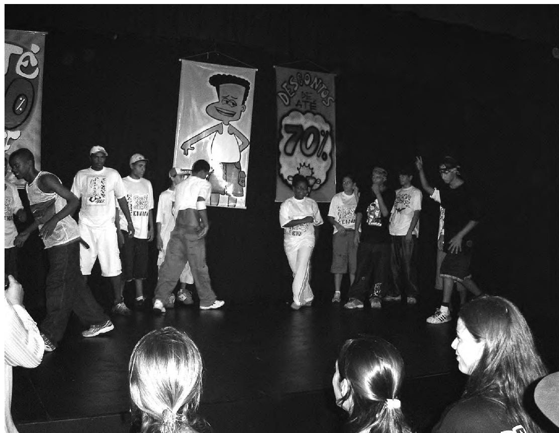
Equipe do projeto Virando o Jogo na abertura da exposição de silk na Casa da Cultura

Jovens integrantes do projeto social Virando o Jogo abriram na sexta-feira a sua primeira exposição de trabalhos em serigrafia. Na mostra, montada na Casa da Cultura “Professora Maria Bove Coneglian”, além das estamparias, estão fotos que registram o cotidiano do projeto. A mostra foi aberta na sexta-feira dia 1º, e vai até o dia 17.