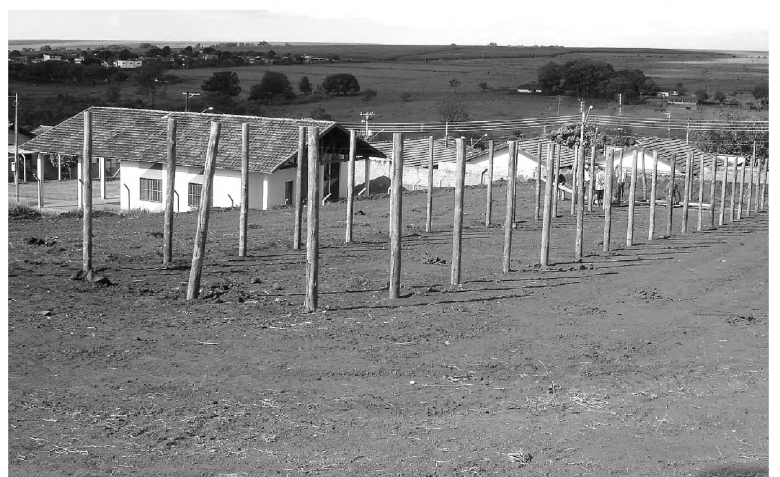
As obras para a construção da estufa já foram iniciadas pela Prefeitura de Areiópolis

"Nunca Areiópolis teve em sua história, um transporte interbairros gratuito. Antes de chegarmos a Prefeitura já sentíamos a necessidade de se colocar um transporte circular gratuito para a população areiópolense", diz o prefeito Peixeiro. Sempre víamos pessoas sem condições de se locomover de um bairro a outro e até mesmo ao centro. Hoje tudo isso acabou e o povo agora pode comemorar, porque tudo o que estamos fazendo é para o bem estar da população", disse o prefeito Peixeiro.