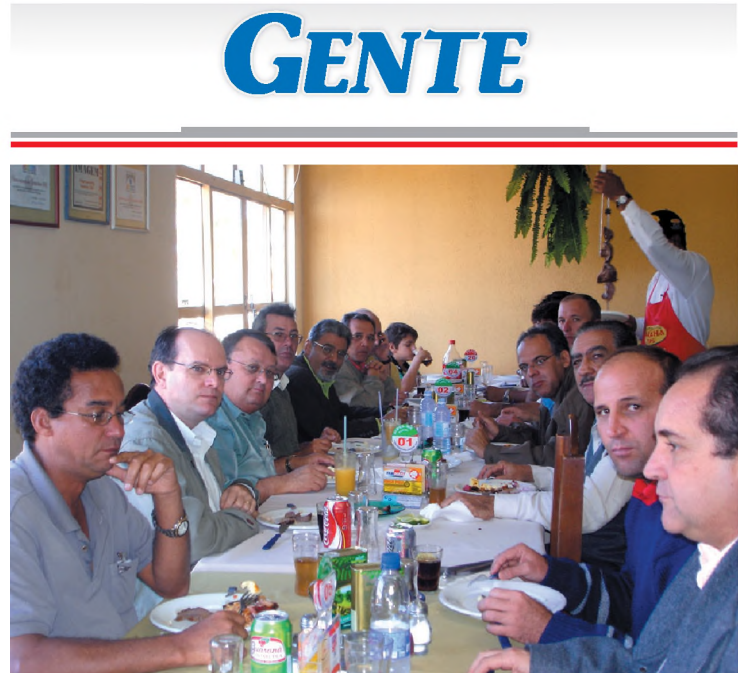
O prefeito Marise, vereadores, diretores da Prefeitura e correlegionários tucanos, receberam o deputado Pedro Tobias (PSDB) na quarta-feira, dia 21, na Churrascaria 295, durante sua visita a Lençóis.