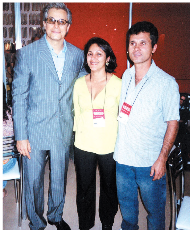
Lúcia e Cláudio proprietários da Ótica Óculos & Cia, juntos com Edson Celulari, na Abiótica 2005 (aqui o galã representando a grife Bulgari).