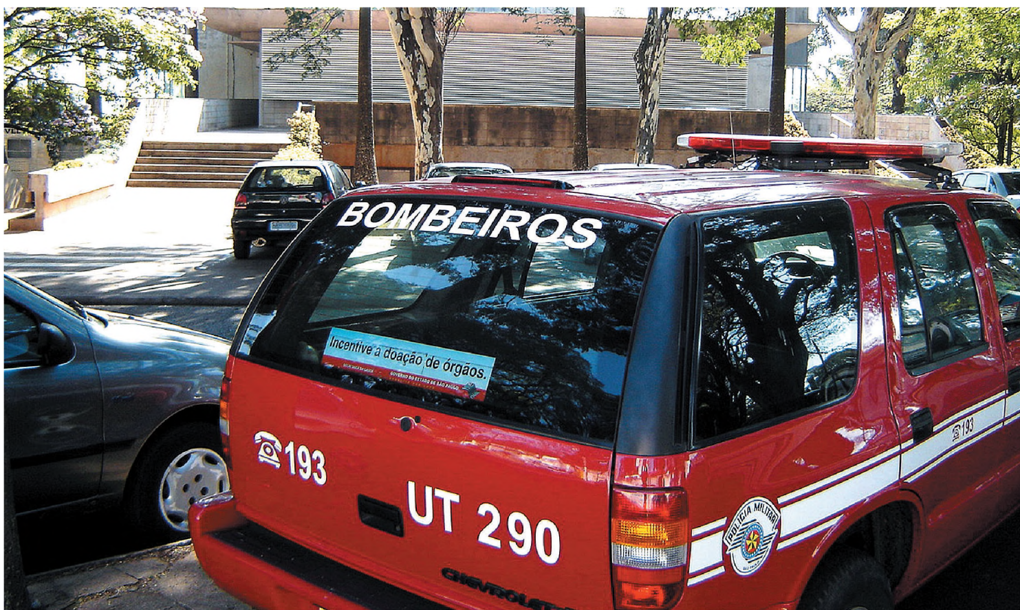
Viatura do Corpo de Bombeiros de Bauru no estacionamento do Paço das Palmeiras na manhã de quinta-feira

Termina amanhã a festa de São Cristóvão – padroeiro dos motoristas - que é realizada na Paróquia Cristo Ressuscitado, na Cecap. Às 8h, será celebrada santa missa em comemoração ao Dia de São Cristóvão, pelo arcebispo Dom Aloysio José Leal Penna e padre Silvano Palmeira. Depois haverá procissão e carreta pelas ruas da cidade, em seguida a bênção dos veículos, carteiras de motorista e chaves dos veículos. Após a bênção dos veículos será servido almoço com churrasco e show com a Banda Kid Caboclo. À noite, a partir das 19h acontece a quermesse com praça de alimentação e bebidas e às 21h a dupla sertaneja Tinoco & Toniquinho encerra a 15ª edição da festa de São Cristóvão.