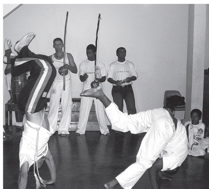
Batismo e troca de cordões começa às 17h no Csec