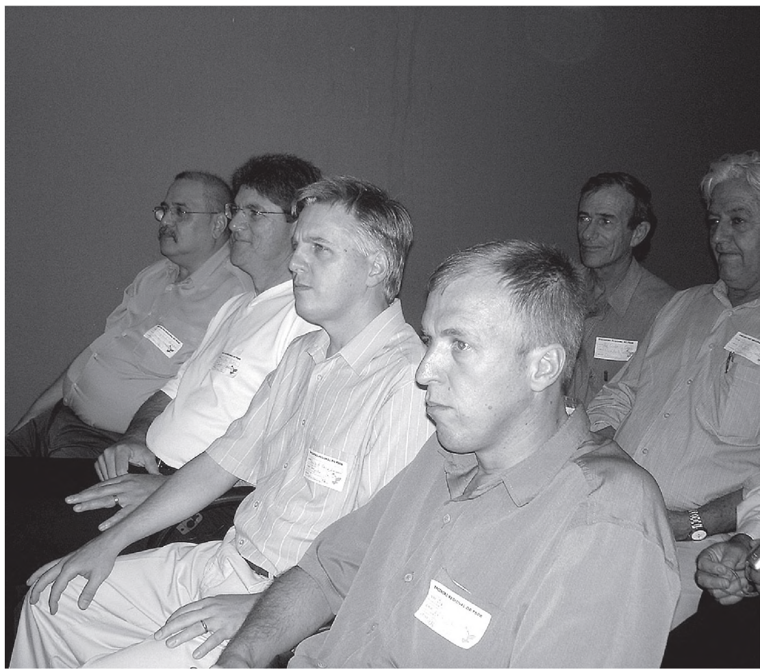
Tucanos lençoenses prestigiaram o evento sábado em Bauru