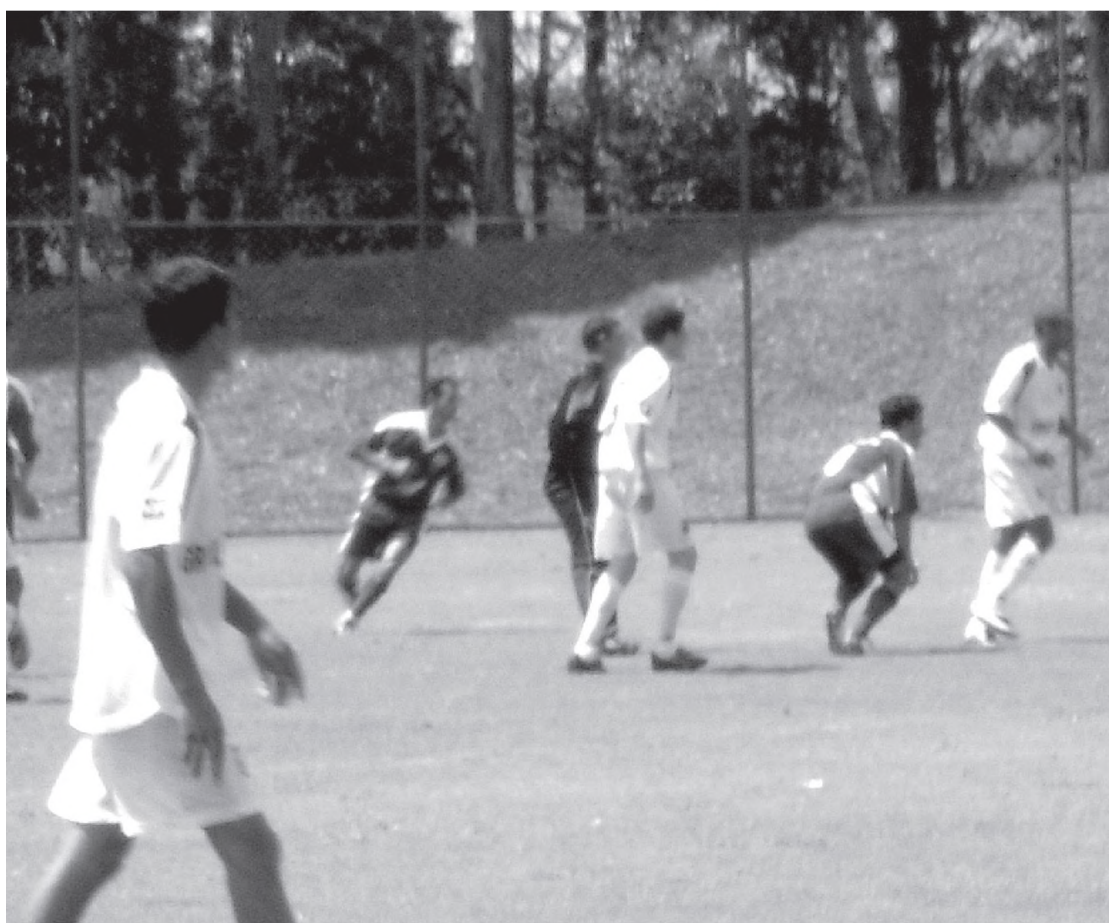
Na etapa final a Lwart (branco) dominou a partida

Pela segunda rodada da segunda fase da competição, a Areiopense pega a representação de Botucatu, às 10h, no campo do Grêmio Lwart. No estádio municipal Archangelo Brega, às 14h30, com transmissão pela rádio local, o Grêmio Cruzeiro encara o Porto de Areiópolis.