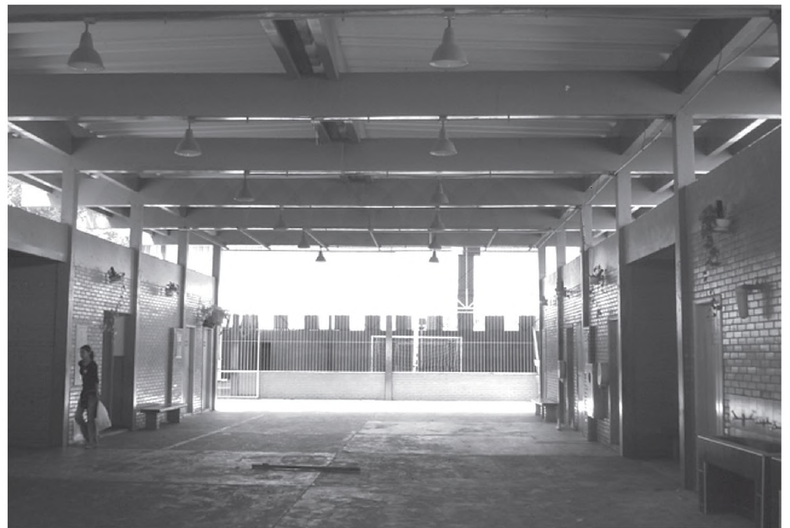
Escola Blanco é uma das beneficiadas com as obras