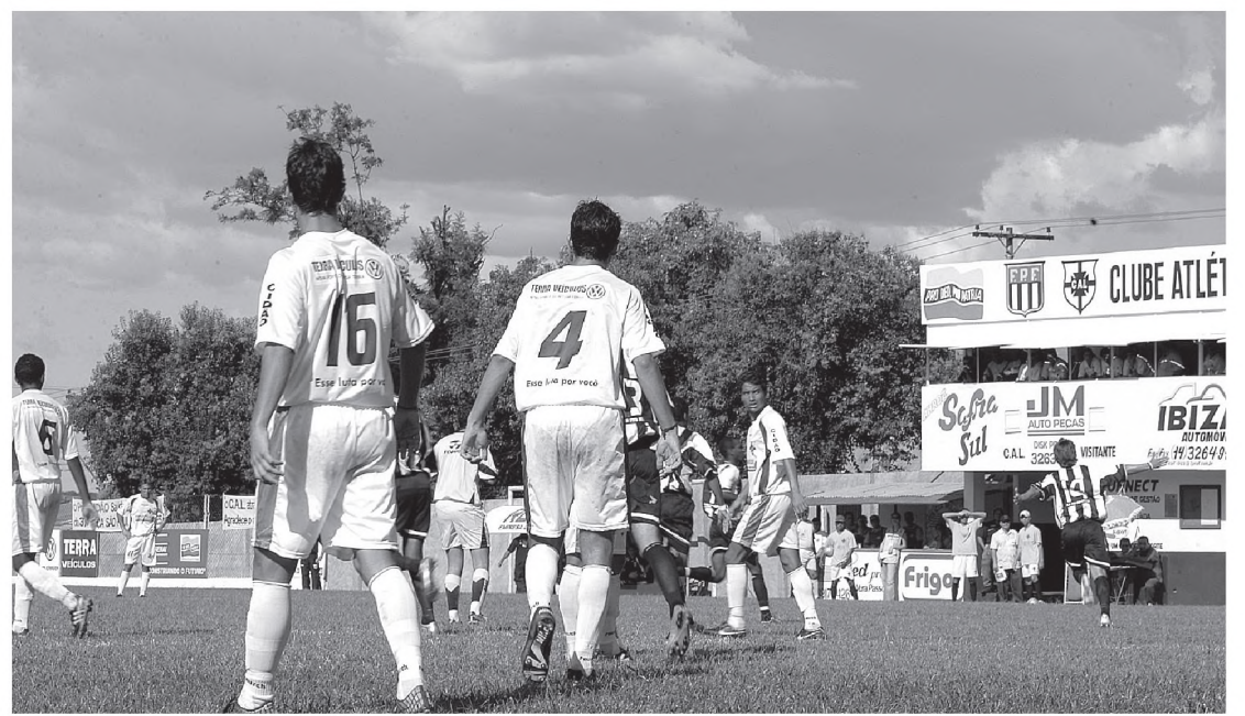
CAL (branco) se despediu da competição com derrota para o Figueirense