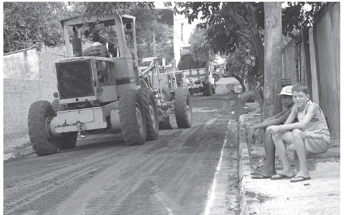
Júlio Ferrari recebe 6,6 mil metros quadrados de asfalto em seis ruas