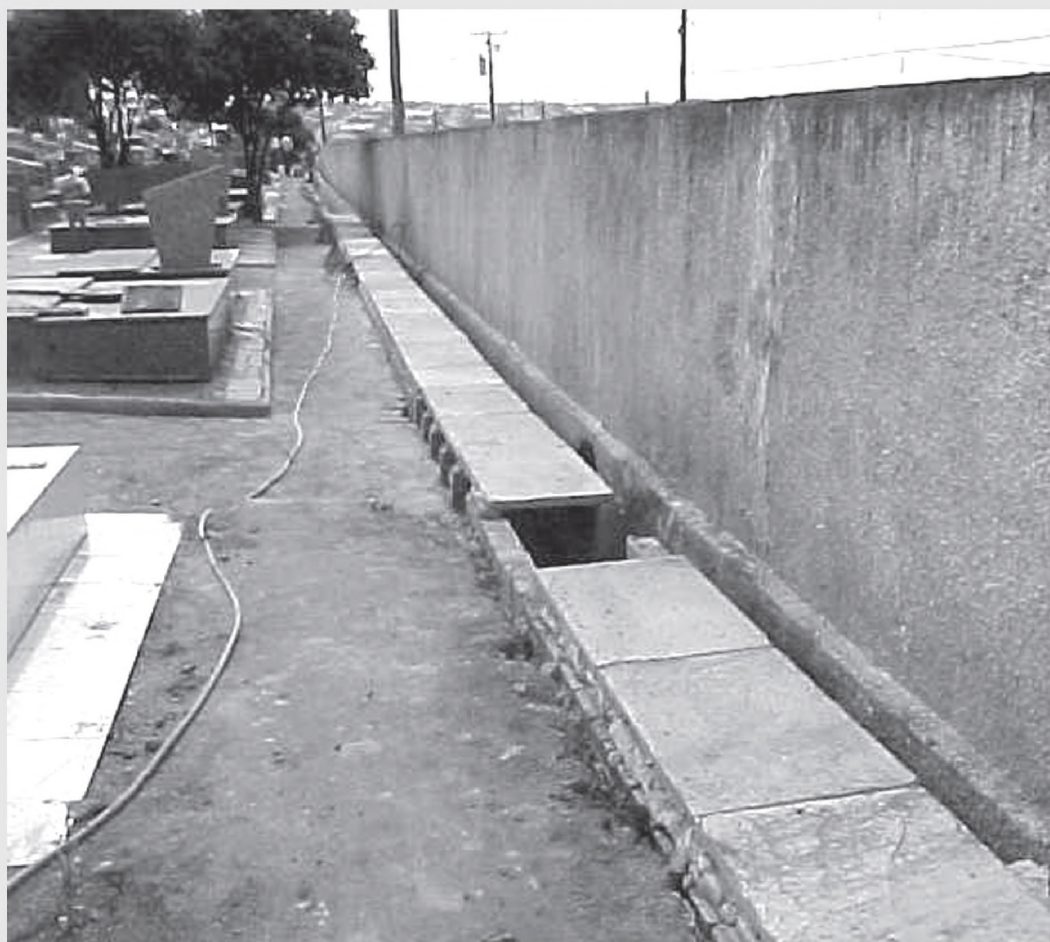
O cemitério vai receber cerca de 300 metros de galerias para captação de águas pluviais

Nesta semana, equipes da Prefeitura iniciaram as obras para a implantação de 300 metros de rede de galerias para captação de águas pluviais no Cemitério Municipal “Alcides Francisco”. A rede está sendo feita próxima ao muro de