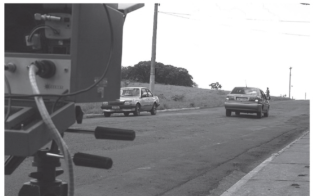
Radar eletrônico flagrou quase 600 motoristas acima do limite de velocidade

Segundo levantamento feito pelo Demutran (Departamento Municipal de Trânsito), na primeira semana de fiscalização da velocidade por radar móvel, 572 motoristas foram flagrados com velocidade acima da permitida nas ruas de Lençóis Paulista até quinta-feira dia 12. Nesta e na próxima semana, a fiscalização tem caráter educativo. Os motoristas flagrados em excesso de velocidade vão receber a notificação da multa apenas para conhecimento. Para a Sindata, empresa que opera o radar, o número de registros nos primeiros dias é compatível com a frota de veículos da cidade, que atualmente gira em torno de 23 mil.