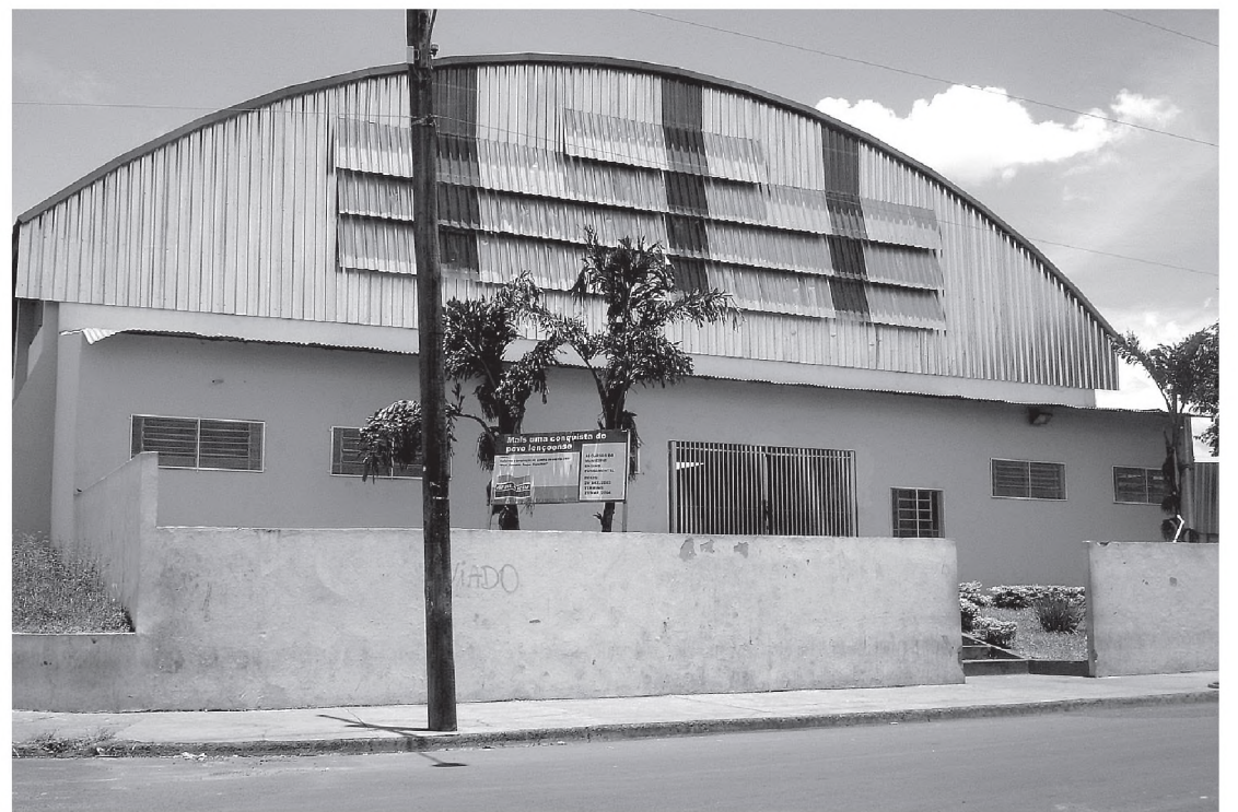
A quadra poliesportiva Maria Angelina Boso será palco das partidas do campeonato