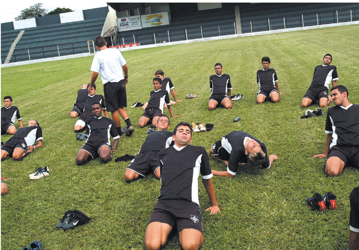
Equipe do CAL já treina pensando no Campeonato Paulista da Segunda Divisão, que tem início previsto para o dia 9 de abril