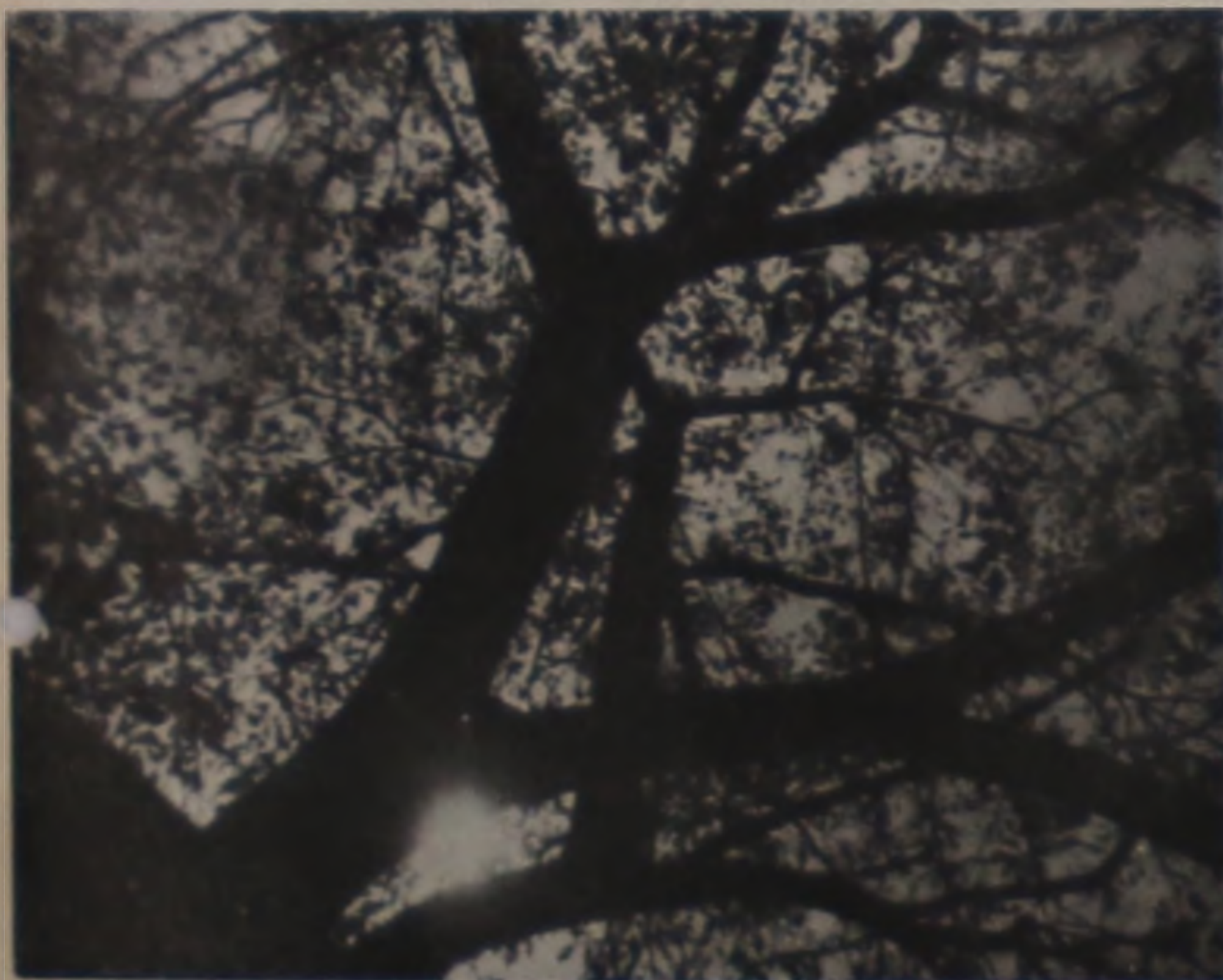
ENSINAR AS FORMAS ADEQUADAS PARA MANUTENÇÃO E PODA FOI O OBJETIVO DO CURSO.