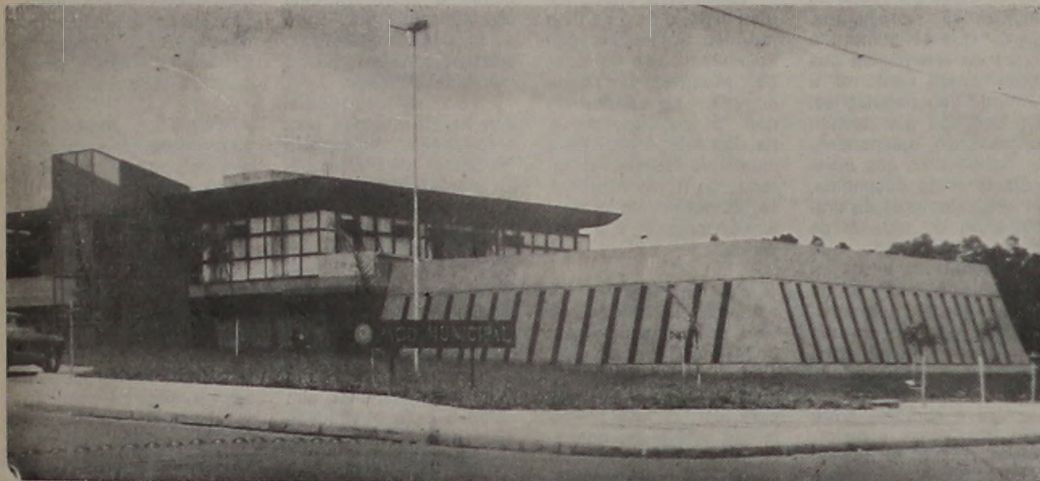
PALÁCIO DAS PALMEIRAS, A SEDE DO GOVERNO MUNICIPAL (ARQUIVO)

A posse do prefeito, vice-prefeito e vereadores eleitos para a sucessão dos mandatos atuais será formalizada em solenidade marcada para as 9h00 do dia 1.º de janeiro, na Câmara Municipal. O roteiro da cerimônia ainda está em fase de elaboração, mas não deverá fugir ao rito regimental, que prevê o juramento, leitura e assinatura do termo de posse.