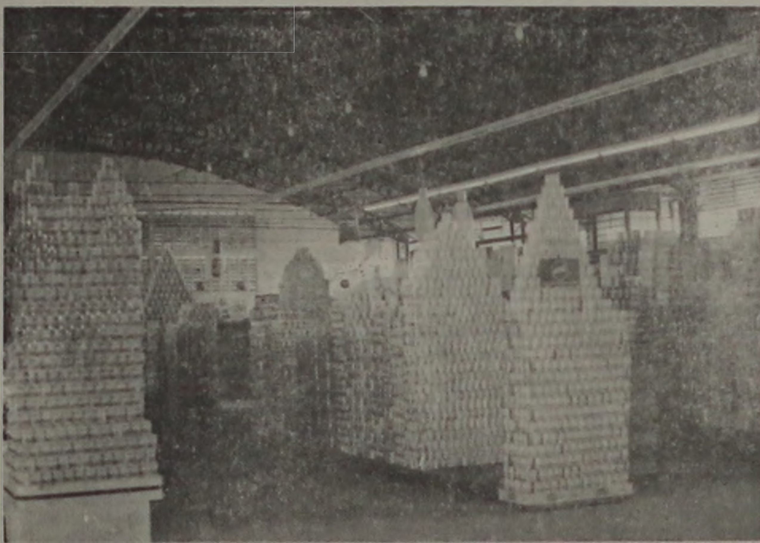
Prefeitura paga aluguel do prédio onde o SESI está instalado. Por isso, consumidores querem acesso sem restrições.