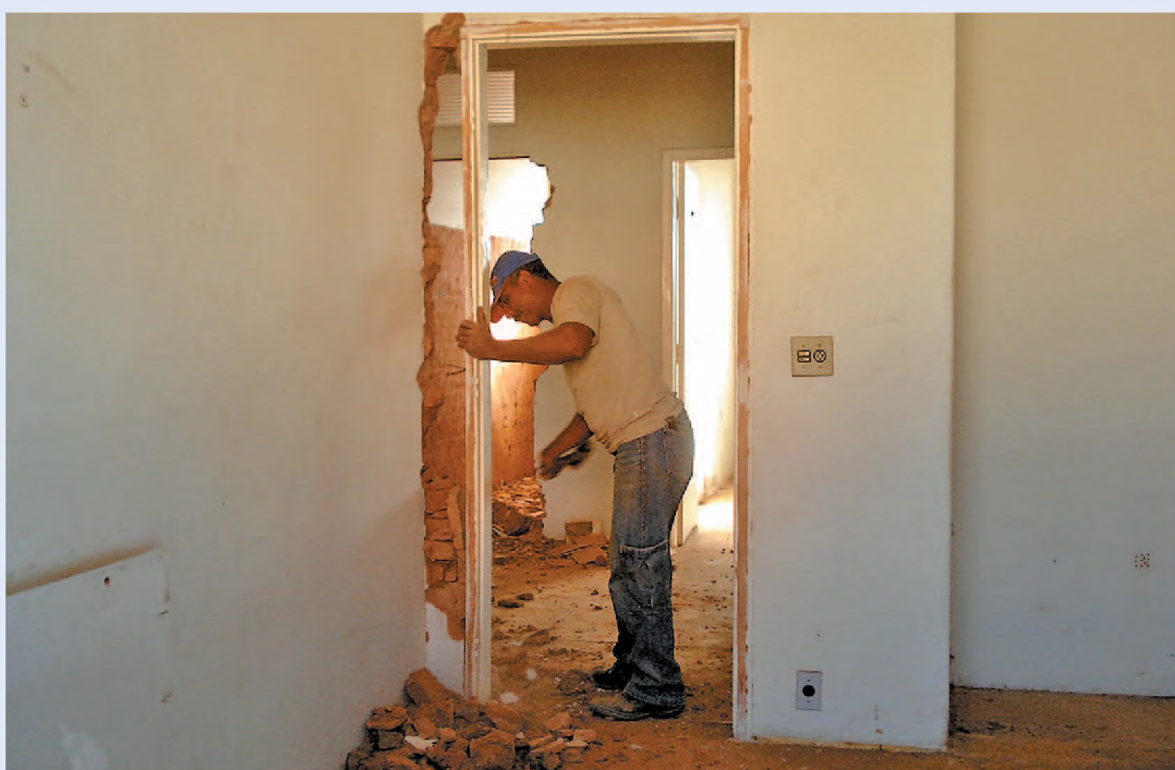
Reforma do antigo hotel vai custar R$ 300 mil; depois de pronto, prédio vai abrigar o paço

O prédio na rua São Paulo, onde está a prefeitura, vai passar a sediar a secretaria de Educação e a biblioteca Carlos Drummond de Andrade. A secretaria de Assistência Social, que divide espaço com secretaria de Educação