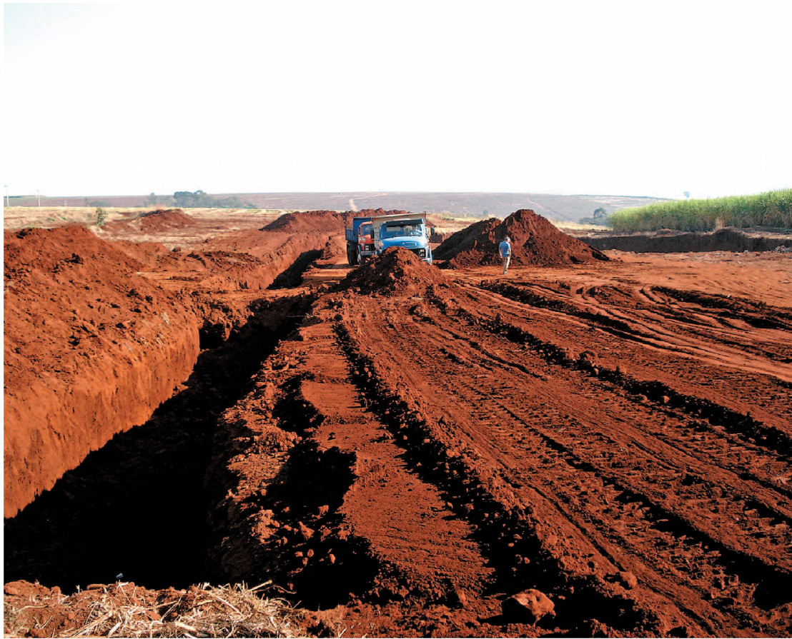
Obras executadas no "buraco da Aguinha" e que devem recolher o problema da erosão em definitivo