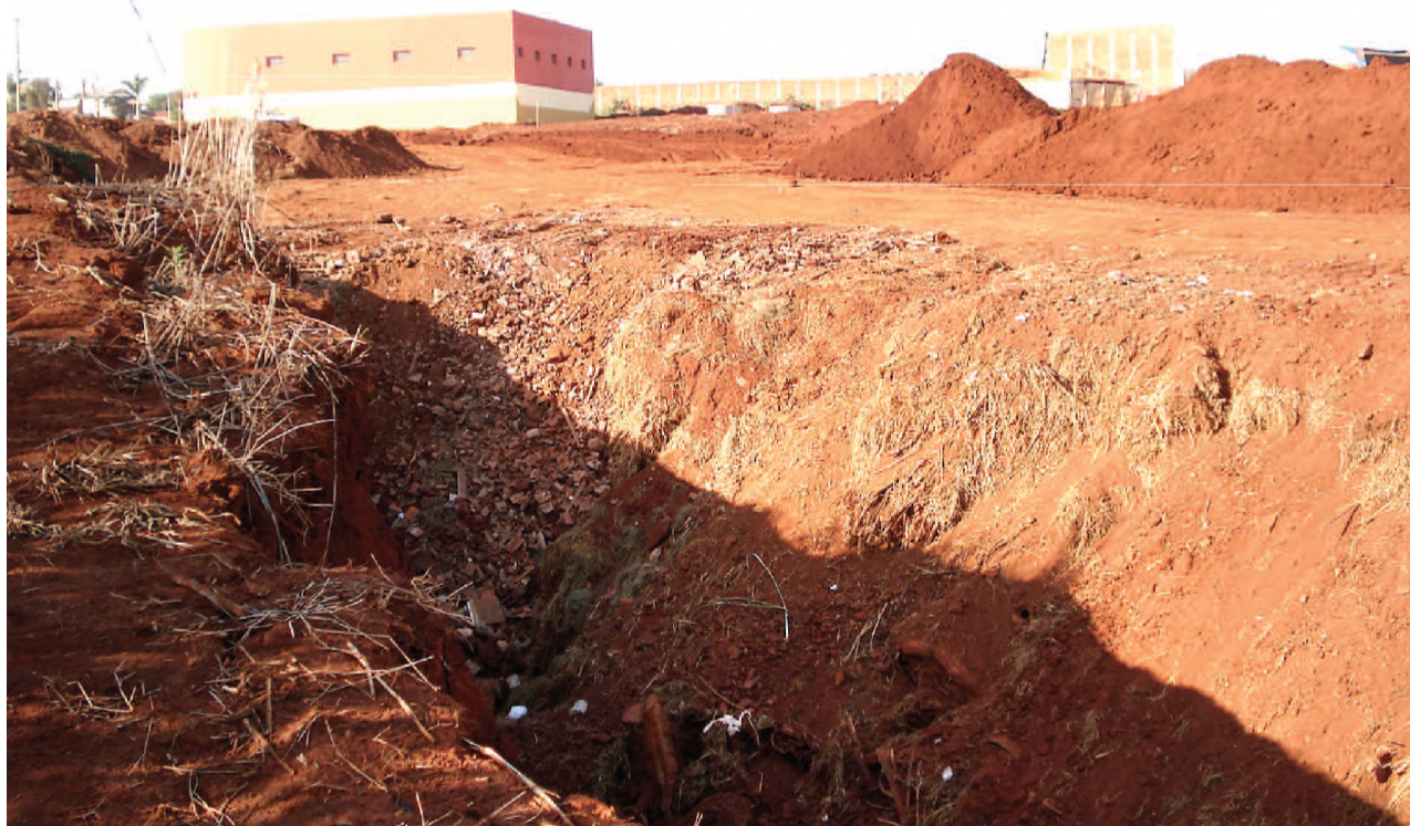
Obras da erosão da Agüinha começaram na segunda-feira 14; buraco foi provocado pelas águas pluviais

A prefeitura de Macatuba iniciou na segunda-feira a etapa definitiva para acabar com o 'buraco da Agüinha', uma erosão de quase 800 metros de extensão e que já completou 16 anos de dor de cabeça ambiental, no bairro rural de mesmo nome. A