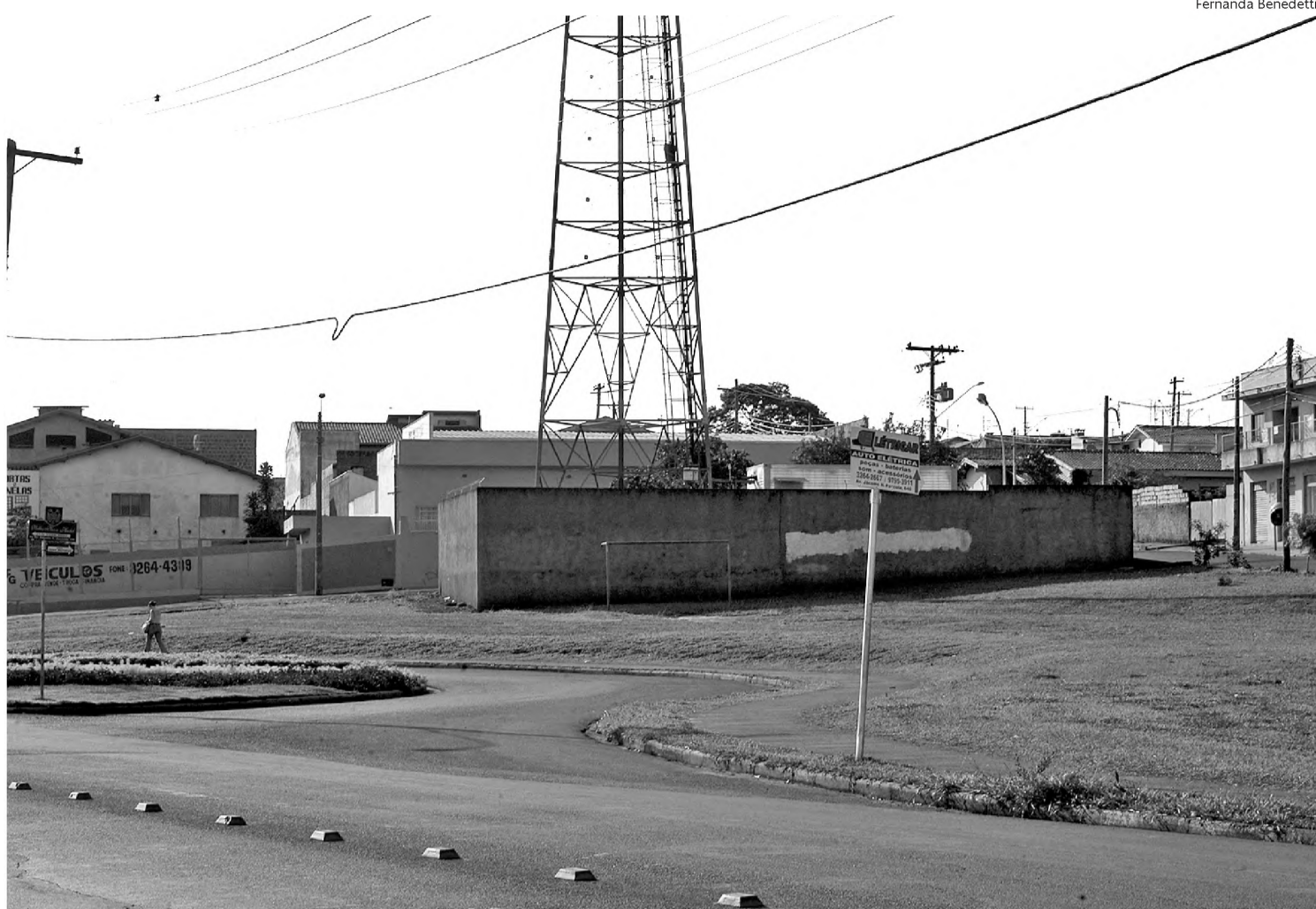
Vista geral do local onde será construída a base do Corpo de Bombeiros de Lençóis Paulista; área pertence à Prefeitura