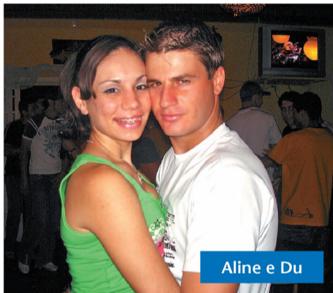
Aline e Du