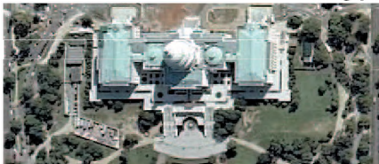
Vista geral da Casa Blanca, nos EUA