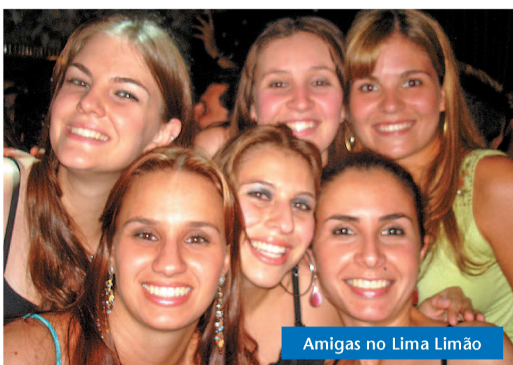
Amigas no Lima Limão