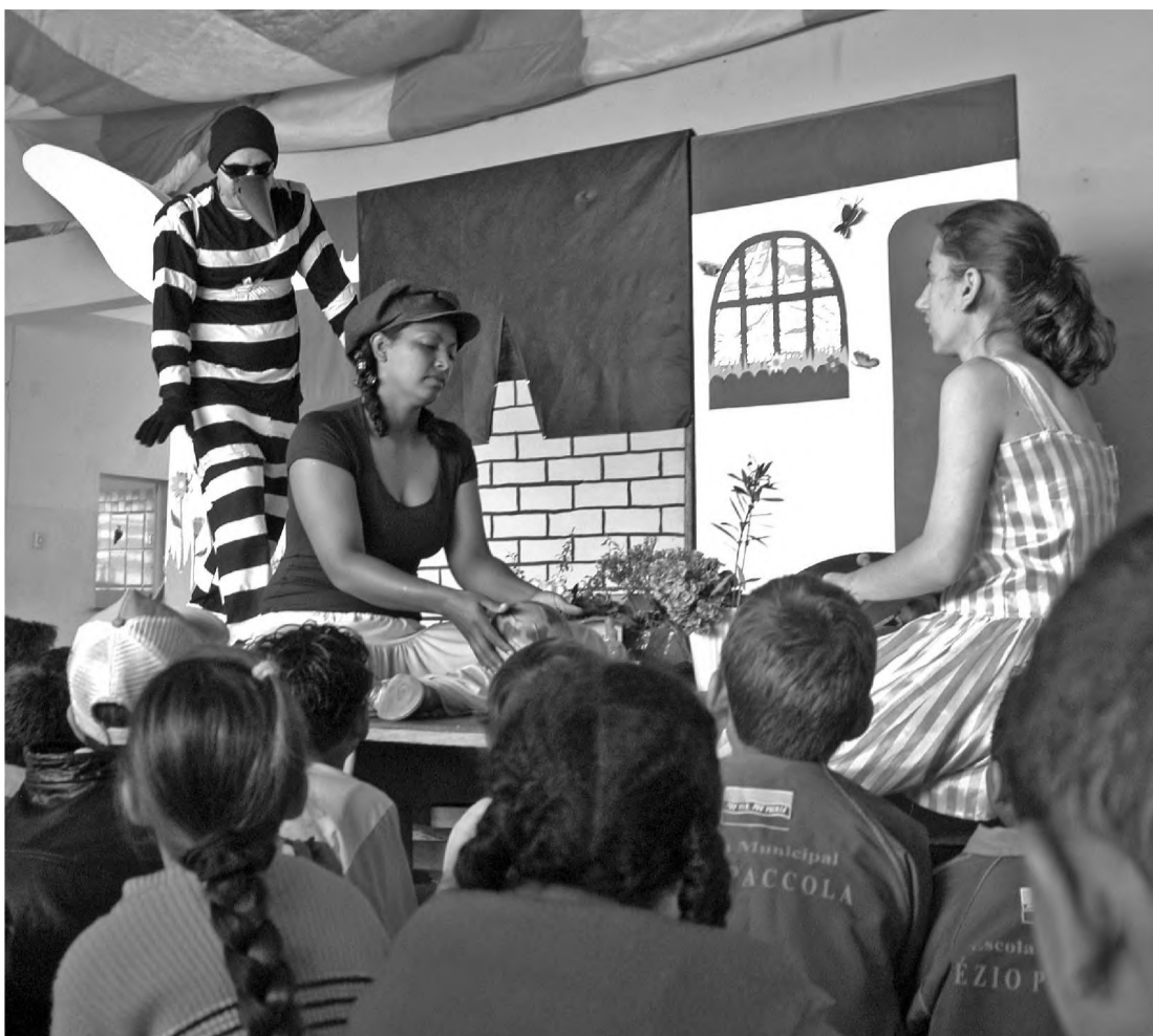
Na manhã de ontem, funcionários da Saúde foram às escolas falar sobre o mosquito da dengue

Para os adultos, o enfoque da campanha será diferente. A diretoria de Saúde pretende distribuir brindes para quem mantiver sua residência sem riscos de criar o mosquito aedes aegypti. No sábado 18, o dia D, a diretoria vai distribuir material informativo em pontos estratégicos do município, como postos de gasolina e ou-