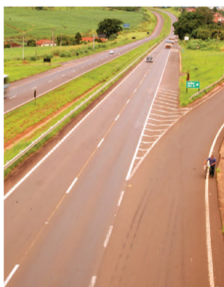
Rodovia Marechal Rondon

Os policiais rodoviários contaram que a vítima sempre trafegava com a bicicleta pelo acostamento da rodovia e que na semana retrasada ele também foi encontrado caído no acostamento com ferimentos nas mãos e alcoolizado.