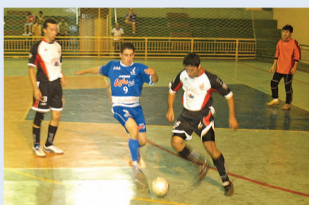
Safrá Sul sai na frente no futsal

acontece a última partida da final. Para levantar o caneco, a Lwart/Alf precisa vencer no tempo normal e na cobrança de pênaltis. Já o Safrá Sul, precisa apenas de uma vitória simples para ser a campeã.