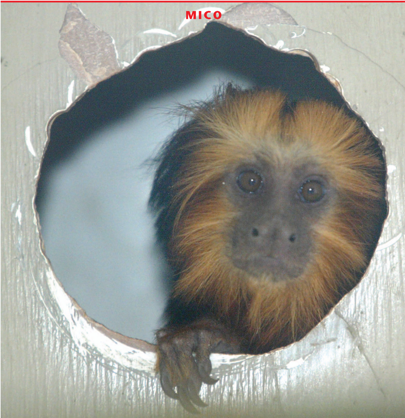
A Polícia Ambiental de Barra Bonita apreendeu dois animais silvestres em Macatuba, na manhã do sábado. Um casal de mico-leões de cara dourada, animal que está em extinção, foi encontrado com um motorista de caminhão. A apreensão foi feita depois de uma denúncia anônima. O motorista foi multado em mais de R$ 20 mil e tomou uma advertência. Os animais foram levados para o zoológico de Bauru. ► Página A2