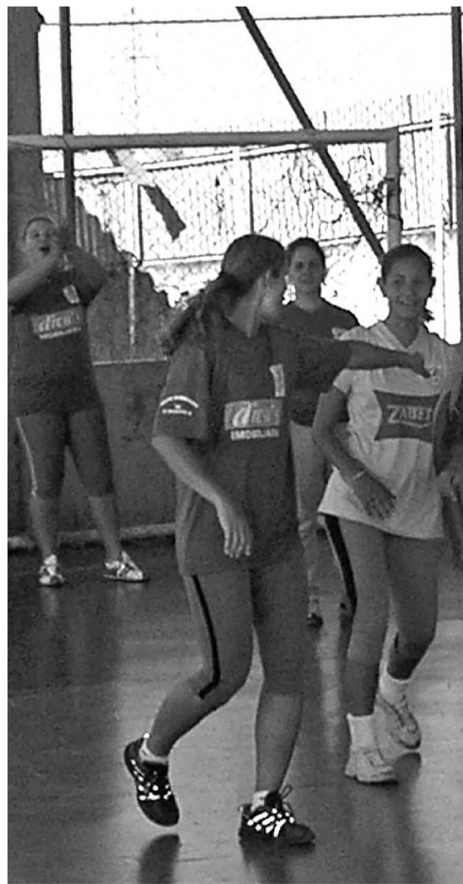
Na quinta-feira da semana passada, dia 9, a quadra da Escola Idalina Canova de Barros foi palco de um animado jogo entre as professoras da escola e as alunas da 8ª série. O jogo foi organizado pelas alunas. O resultado final foi de 6x5 para o time das professoras, com muita garra e algumas contusões.