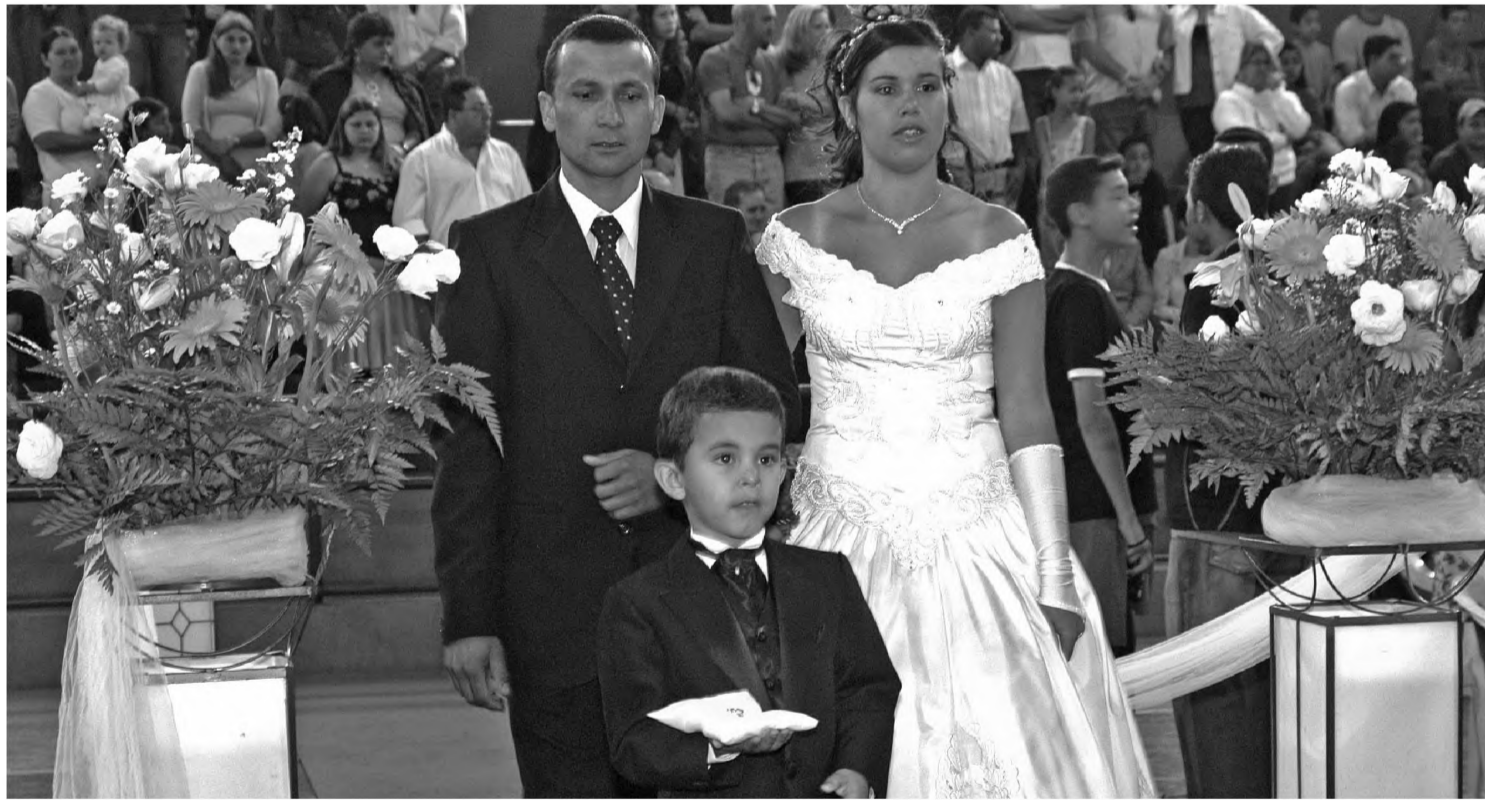
No domingo 12, 40 casais disseram o sim no casamento comunitário realizado no ginásio de esportes, em Areiópolis

Quarenta casais participaram do primeiro casamento comunitário realizado em Areiópolis no domingo 12. A cerimônia aconteceu no ginásio de esportes Odécio Vieira Pontes. Como manda a tradição, familiares e amigos foram abençoar os casais. Tapete vermelho e arranjos de flores também marcaram a celebração.