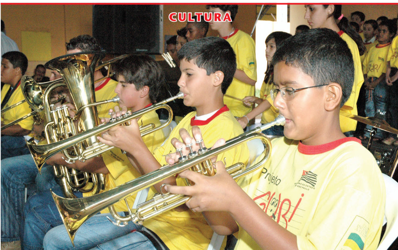
Primeira apresentação do projeto Guri reuniu centenas de pessoas na escola Maria Zélia Camargo Prandini, no sábado