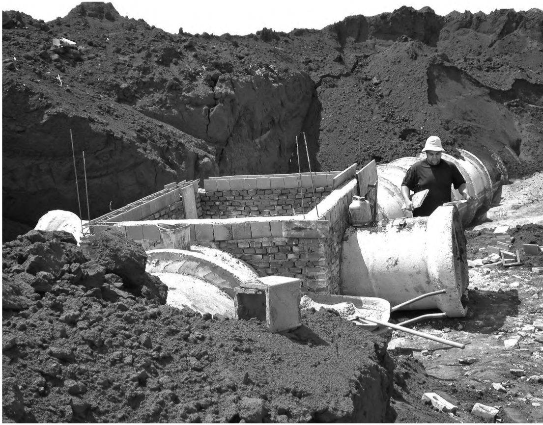
Vista das obras em que a Prefeitura de Macatuba constrói ligação entre as duas galerias

O novo conjunto de galerias vai se interligar e escoar toda a água que vem dos bairros Jardim Planalto e Bocaiúva para a bacia hidrográ-