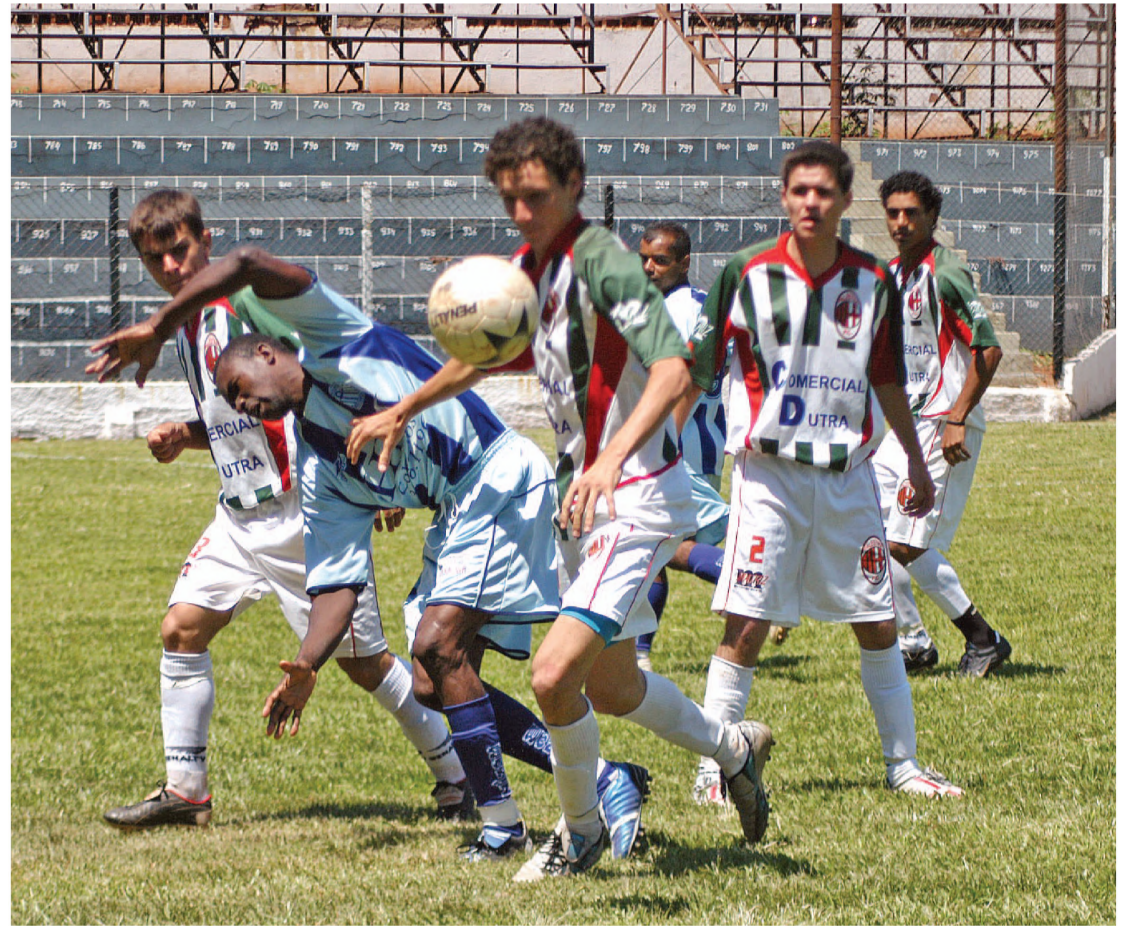
Lance da partida em que o Palestra venceu Areiópolis por 1 a 0 e garantiu a outra vaga do grupo B

Já no grupo B, a vaga ficou com o Palestra que na manhã de domingo, no Bregão, bateu Areiópolis por 1 a 0. O único