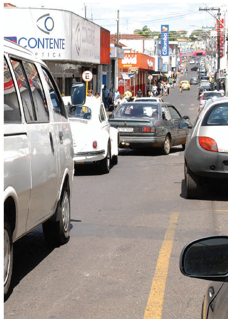
IPVA sobe mais que a inflação, aumento para 2007 é de 6,5%

O governo vai oferecer aos contribuintes três opções para quitar o imposto: à vista em janeiro com desconto de 3% no valor total do imposto, à vista sem desconto em fevereiro ou em três parcelas nos meses de janeiro, fevereiro e março, também sem o desconto. No caso de caminhões com o pagamento parcelado de IPVA, as cotas vencem em março, junho e setembro.