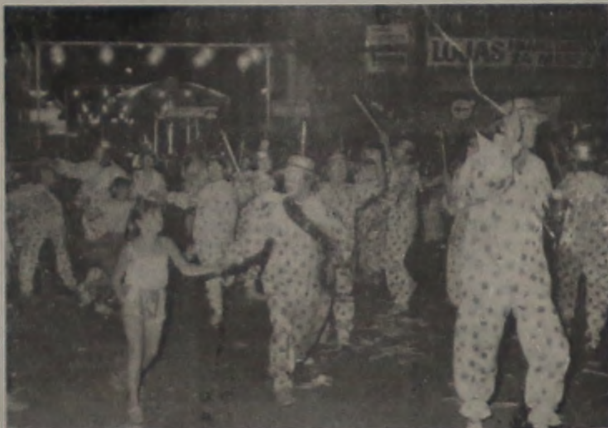
Prefeitura mantém a festa na Rua XV de Novembro.