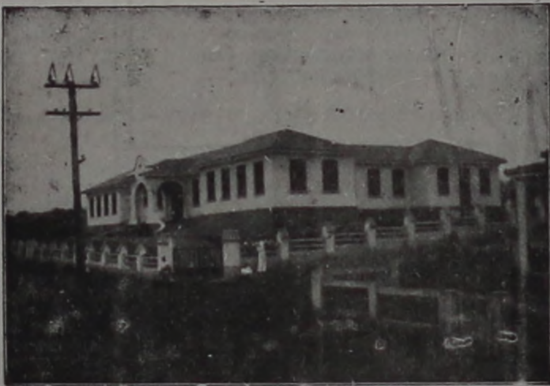
HOSPITAL NOSSA SENHORA DA PIEDADE

A PROCISSÃO — MISSA CAMPAL — BENÇÃO DA IMAGEM DA PADROEIRA — OS DISCURSOS — VISITA POPULAR — OUTRAS NOTAS