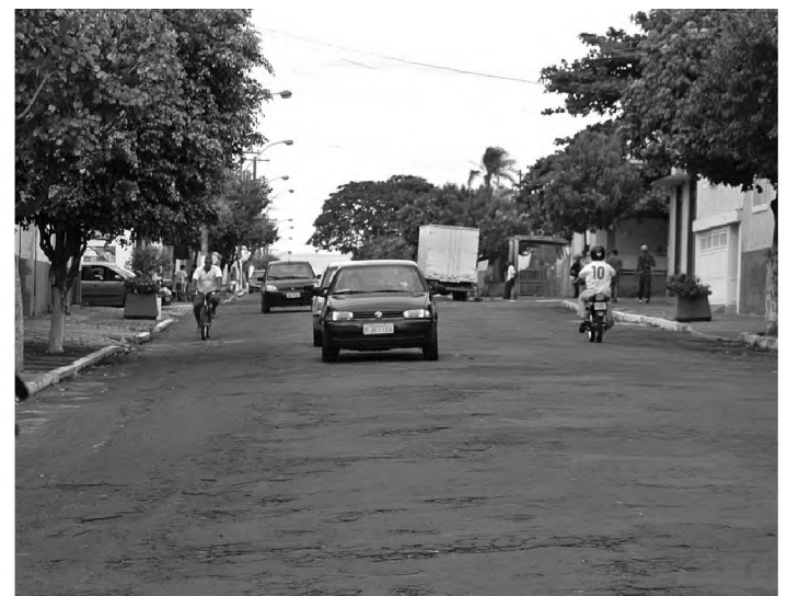
Área central de Piratininga que reúne maior número de lojas

O sorteio dos prêmios será no dia 29 de dezembro, às 20h, na Praça da Matriz. Para participar é só preencher o cupom e depositar nas urnas colocadas no Banco do Brasil e na agência da Nossa Caixa.