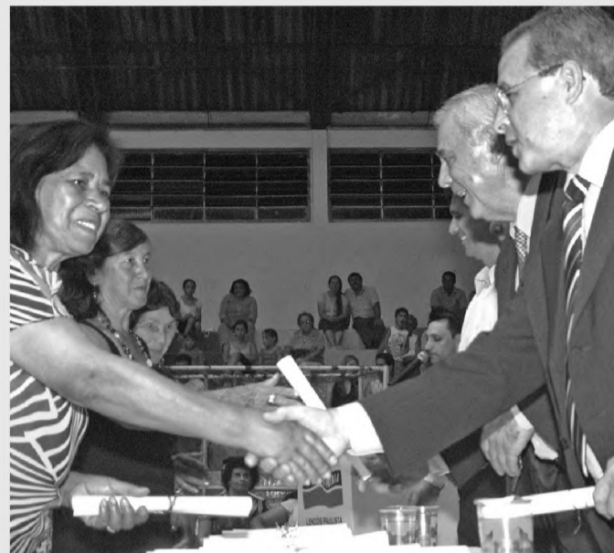
Mais de 400 pessoas receberam o certificado no Csec

O CMFP (Centro Municipal de Formação Profissional Prefeito Ideval Paccola), realizou na noite de sexta-feira 15, a formatura de mais de 400 alunos em 12 cursos diferentes, que iniciaram o curso profissionalizante no segundo semestre deste ano. Do total de formandos, 330 participaram da solenidade de entrega de diplomas no Csec (Centro Social Esportivo e Cultural). No dia seguinte, sábado 16, os formandos participaram de um almoço de confraternização no recinto da Facilpa (Feira Agropecuária Comercial e Industrial de Lençóis Paulista).