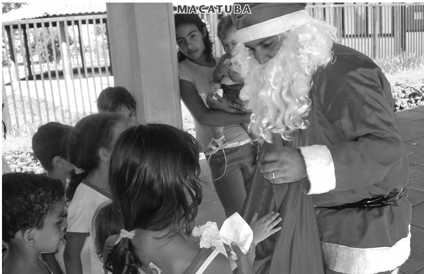
Em Macatuba, o Papai Noel entregou presentes para as crianças que são atendidas pela Pastoral da Criança, sábado no Caic