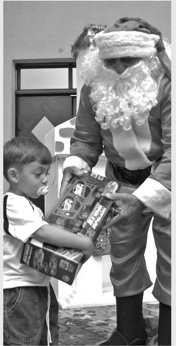
Em Borebi, Papai Noel chegou de helicóptero