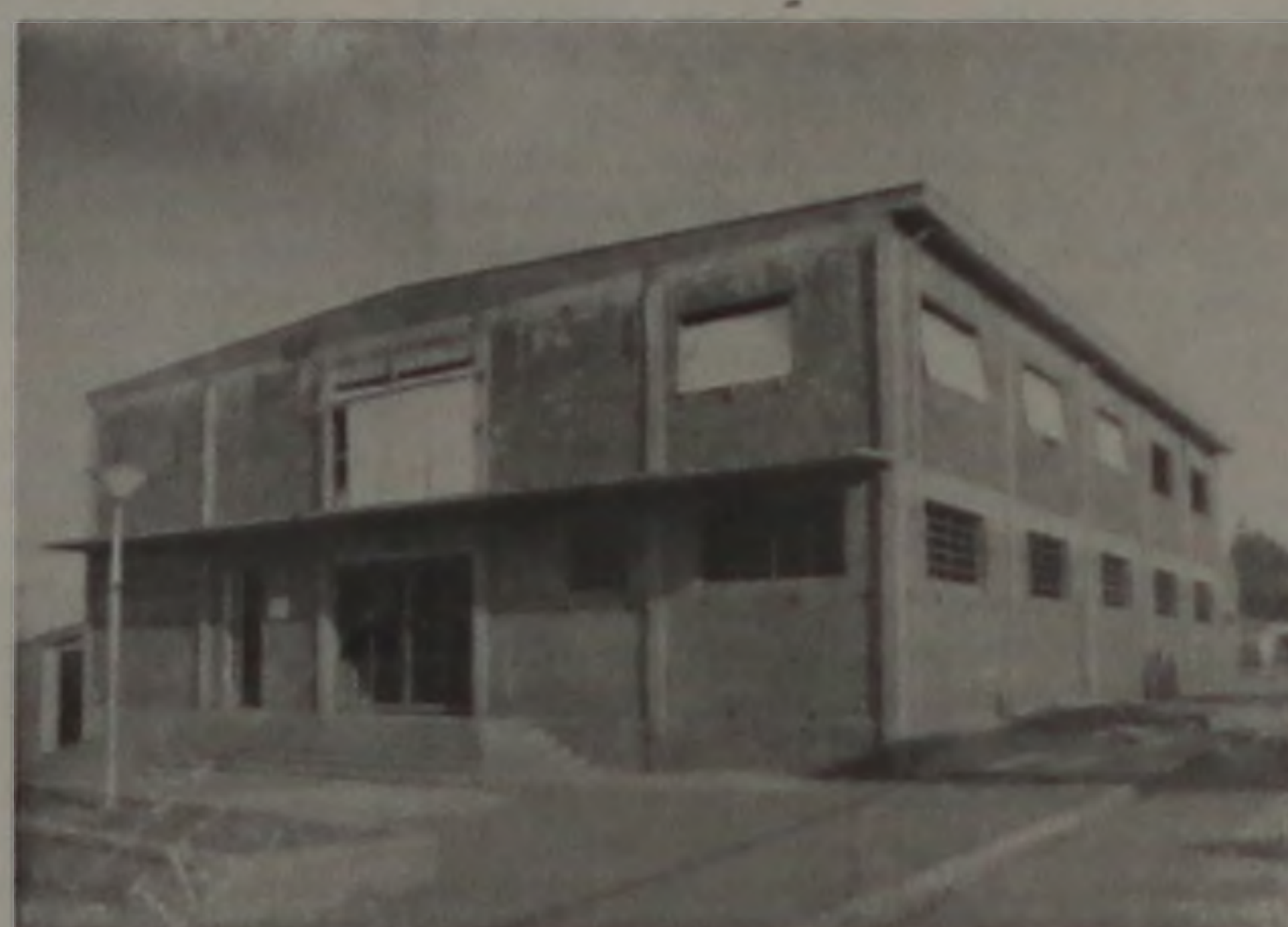
Centro Paroquial: dependências serão inauguradas

Prossegue neste final de semana a programação festiva e religiosa em honra aos padroeiros da Paróquia do núcleo Luiz Zillo, São Pedro e São Paulo. Além das atrações recreativas, que incluem shows musicais num palco arma-