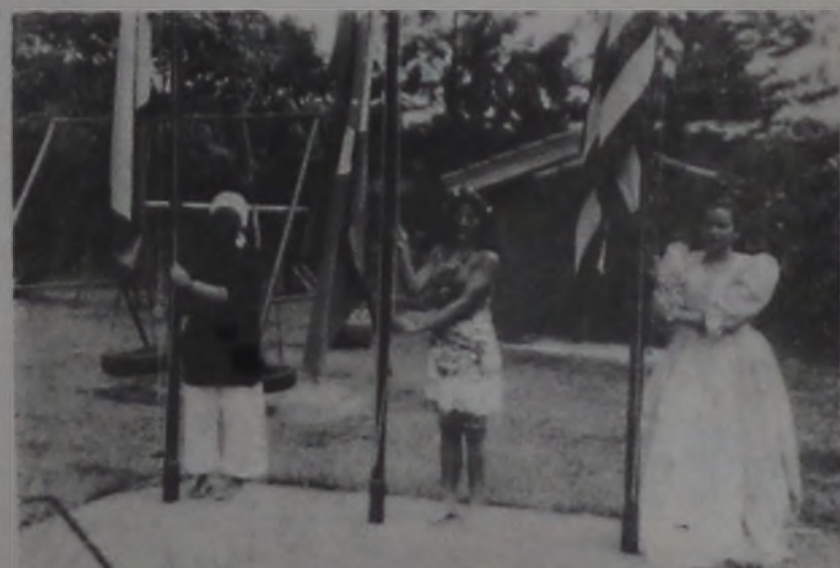
Representando negros, índios e brancos, 3 alunas hasteiam a bandeira brasileira na abertura da semana.

A DINÂMICA sente-se feliz em compartilhar com seus alunos momentos tão marcantes. Esperamos que cada um deles venha a tornar-se um brasileiro mais conhecedor de suas raízes e, assim, mais orgulhoso de seu país.