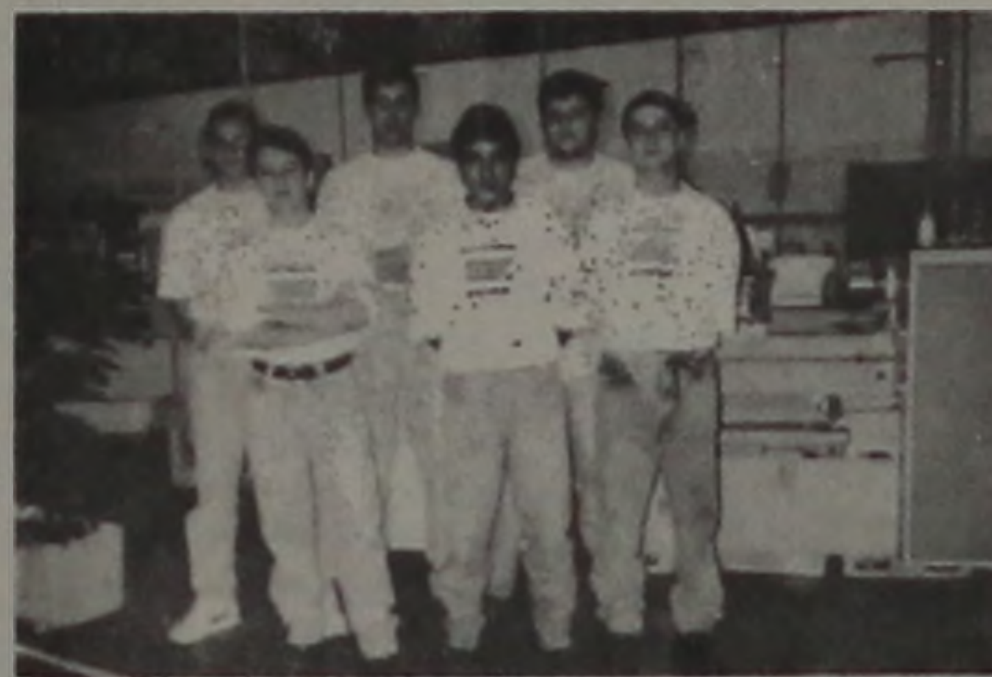
A seleção do CMFP Ideval Paccola teve sete integrantes.