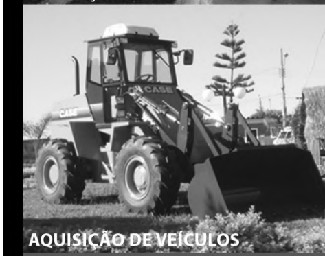
AQUISIÇÃO DE VEÍCULOS