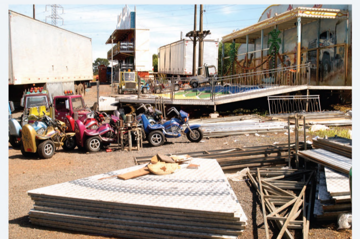
O parque de diversões atraiu um grande público no final de semana e César Menotti e Fabiano levaram quase 30 mil à feira; ontem pela manhã começou a operação de desmanche das barracas