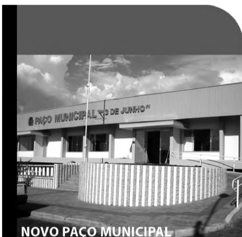
NOVO PAÇO MUNICIPAL