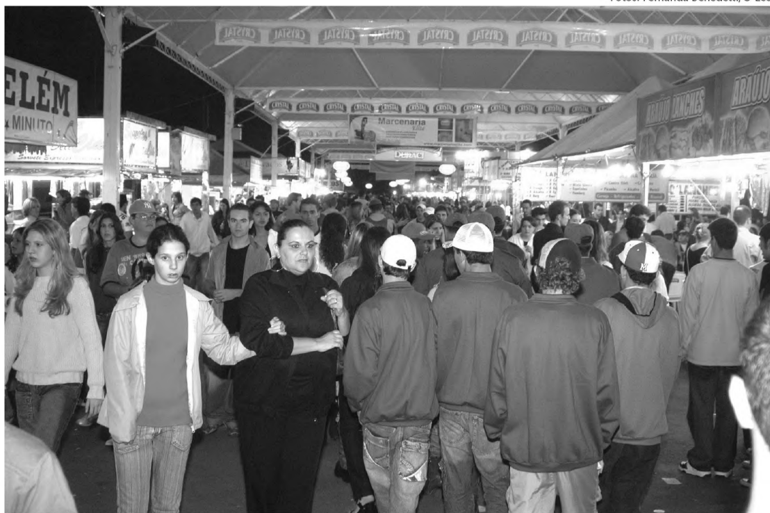
Na noite do sábado, a Facilpa recebeu um público de quase 30 mil pessoas

O grande público do domingo agradou os organizadores da feira. As atrações foram diversificadas nos três períodos. Pela manhã, as pessoas foram ao recinto para ver o tradicional concurso de cães. À tarde, a grande pedida era provar pela última vez a variedade de pratos da praça de alimentação, enquanto os comerciantes aproveitavam