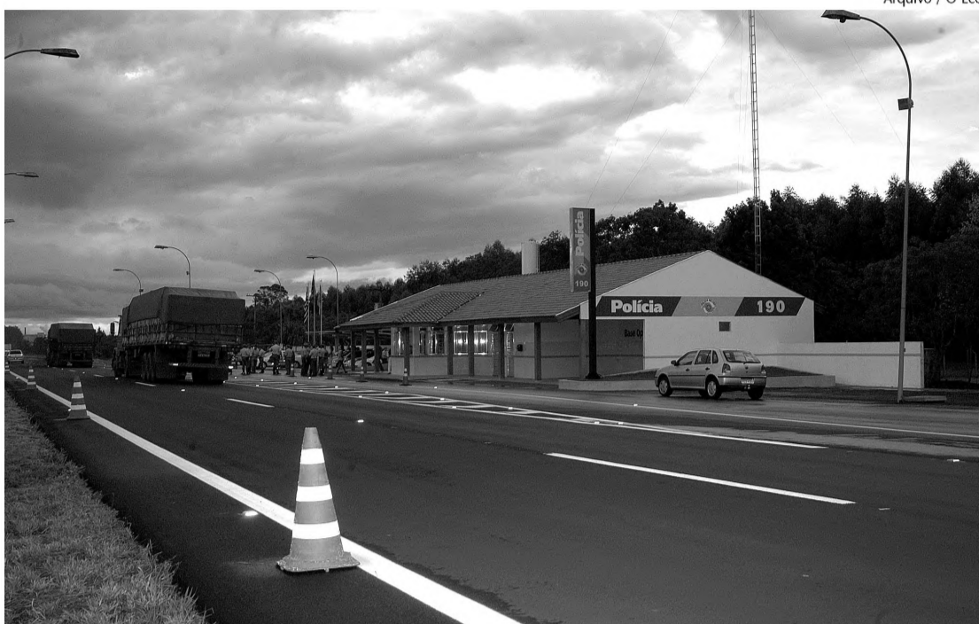
Base da Polícia Rodoviária de Agudos que atendeu as duas ocorrências