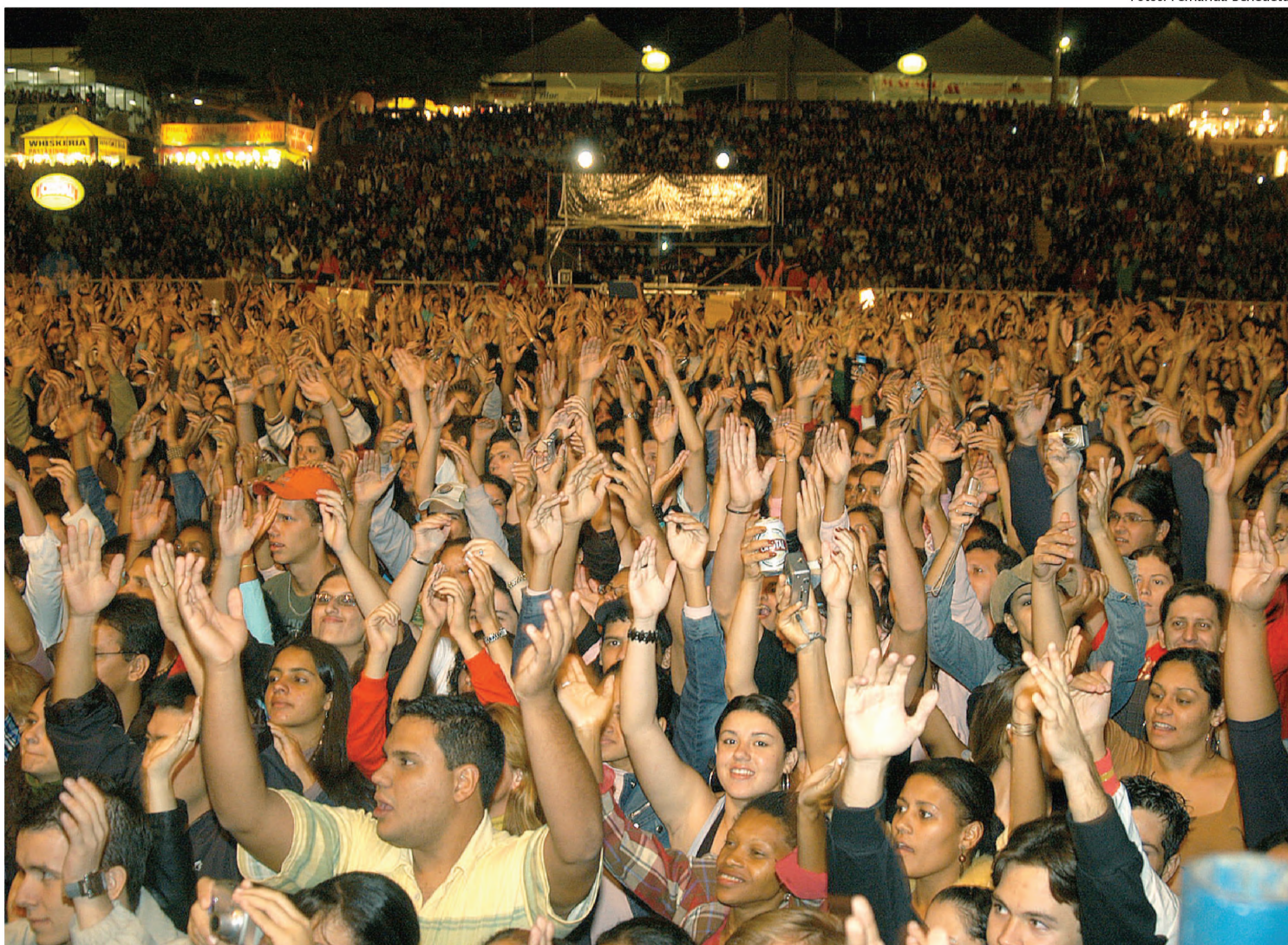
O show do grupo Roupa Nova agitou os fãs que cantaram o tempo todo; apresentação aconteceu na noite da sexta-feira

Em entrevista ao jornal O ECO, Menotti disse conhecer a expectativa do público, mas que ainda falta muito para a dupla alcançar o status de outros artistas. "Nós ainda estamos procurando nosso espaço. Sucesso quem tem é Bruno