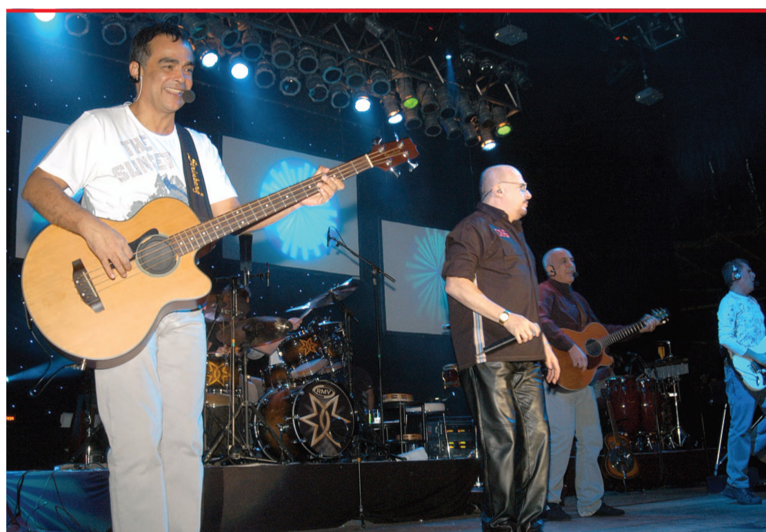
ROUPA NOVA Com público de 20 mil pessoas, o grupo Roupa Nova se apresentou na Facilpa (Feira Agropecuária, Comercial e Industrial de Lençóis Paulista), pelo segundo ano consecutivo, na sexta-feira 4.

"É muito bom saber que o nosso retorno a Lençóis Paulista foi pela escolha do público, saber que o grupo deixa esse gostinho de quero mais por onde passa é muito importante",