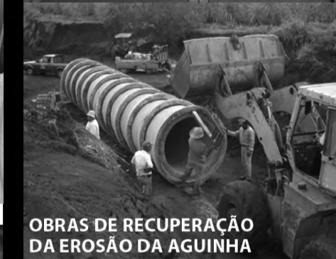
OBRAS DE RECUPERAÇÃO DA EROSIÃO DA AGUINHA