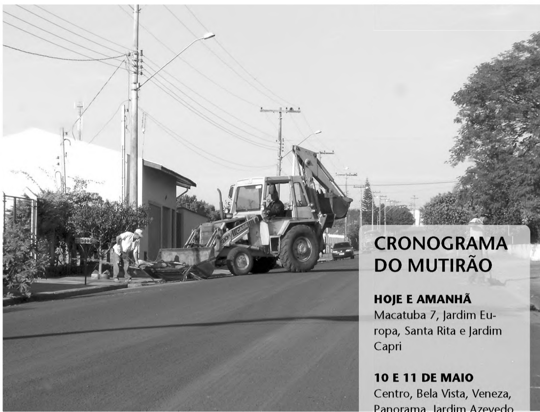
Mutirão de limpeza vai atingir todos os bairros de Macatuba

A orientação da secretaria de Saúde é para que a população colabore com as equipes de limpeza, colocando o material que está acumulando no quintal, como entulho, móveis que não tem mais serventia, garrafas e pneus na rua, no dia em que a equipe de limpeza