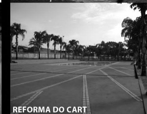
REFORMA DO CART