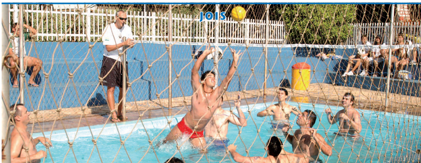
Todas as partidas de biribol foram realizadas nas piscinas do Clube Esportivo Marimbondo; equipe da Prefeitura ficou com o título

Começou ontem e vai até sexta-feira 11 um mutirão de limpeza para acabar com o criadouro do mosquito Aedes aegypti, transmissor da dengue. O mutirão é promovido pela Secretaria de Saúde de Macatuba. ► Página A6