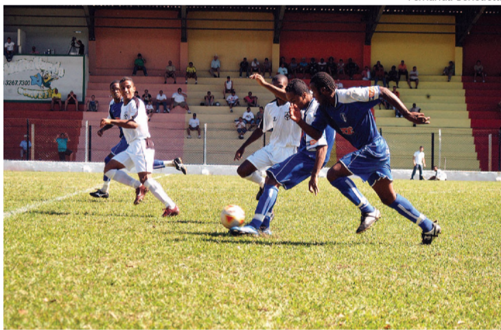
Lance da derrota do Lençoense para o Lemense no Bregão