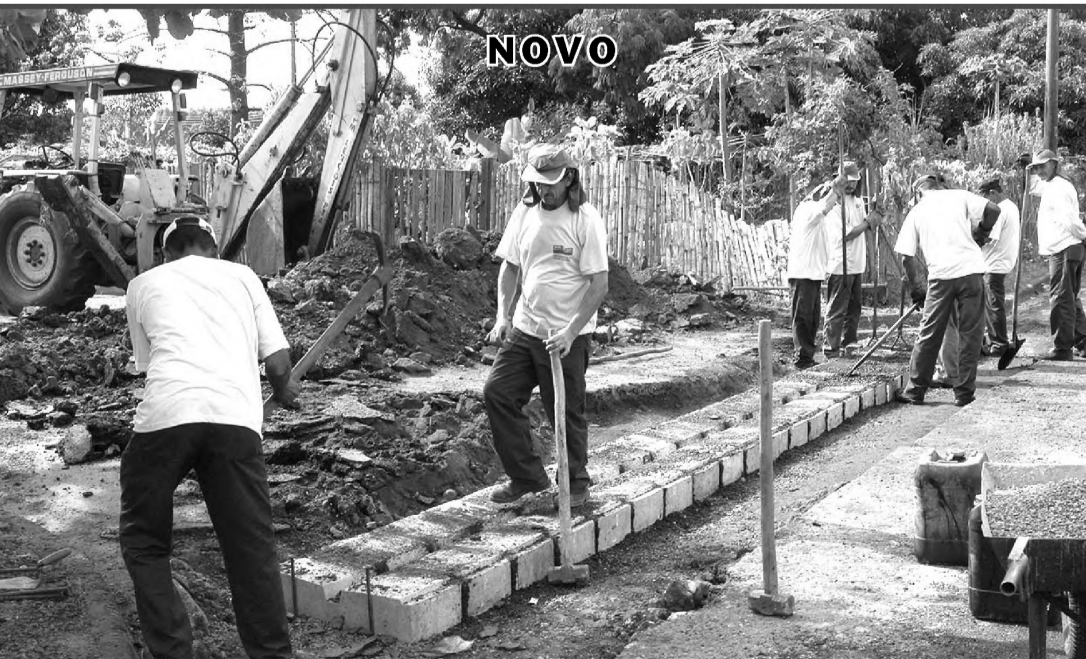
No cruzamento das ruas Luiz Biral e Rua Cantílio Orsi, no Núcleo Luiz Zillo, funcionários da prefeitura de Lençóis Paulista trabalhavam ontem na construção do sarjetão para melhorar o escoamento de água.