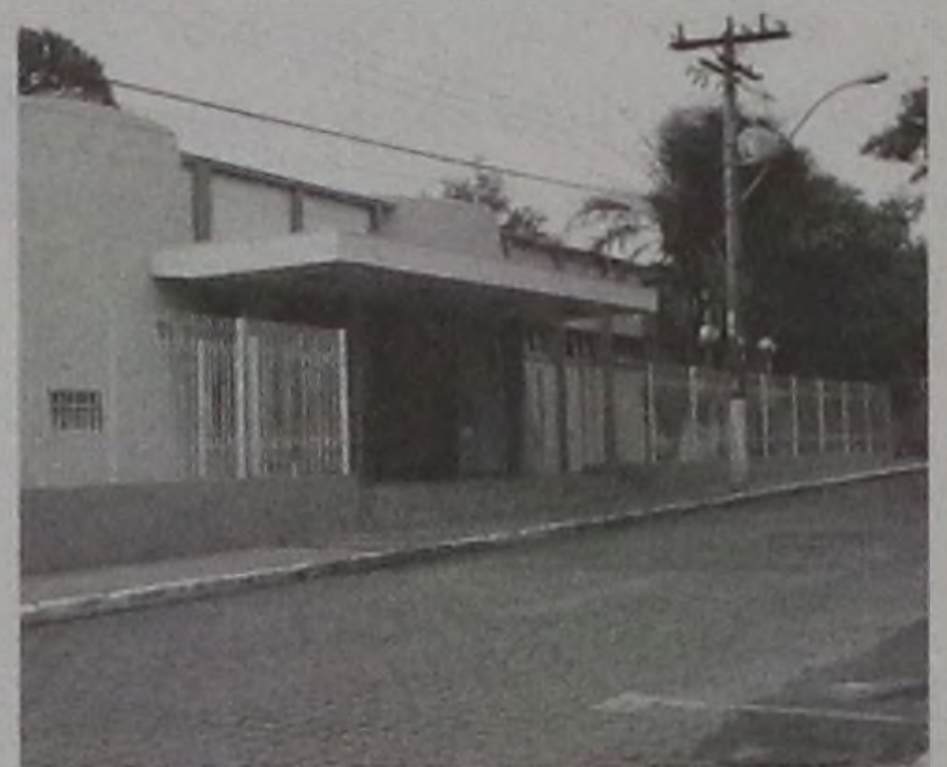
Encontro de jovens cristãos acontece sábado, no CEC

Em Macatuba, a Pastoral da Juventude da paróquia Missionária de Santo Antônio promove a 2ª Cristoteca. O evento está marcado para o sábado 29, a partir das 21h, no CEC (Clube Esportivo e Cultural).