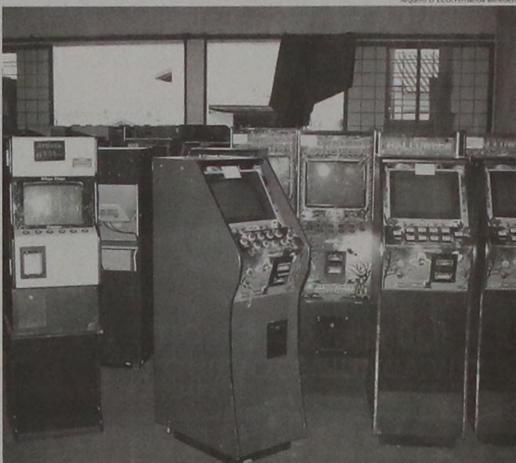
Em Lençóis Paulista, mais de 600 máquinas caça-níqueis foram apreendidas neste ano

O tenente Folkis disse que a Polícia Militar estará à disposição sempre que for requisitada e enfatizou que não tem deixado de trabalhar para apreender esse tipo de máquina. Massa lembrou que na região Lençóis Paulista foi quem mais apreendeu máquinas caça-níqueis. Foram mais de 600 desde o início do ano.