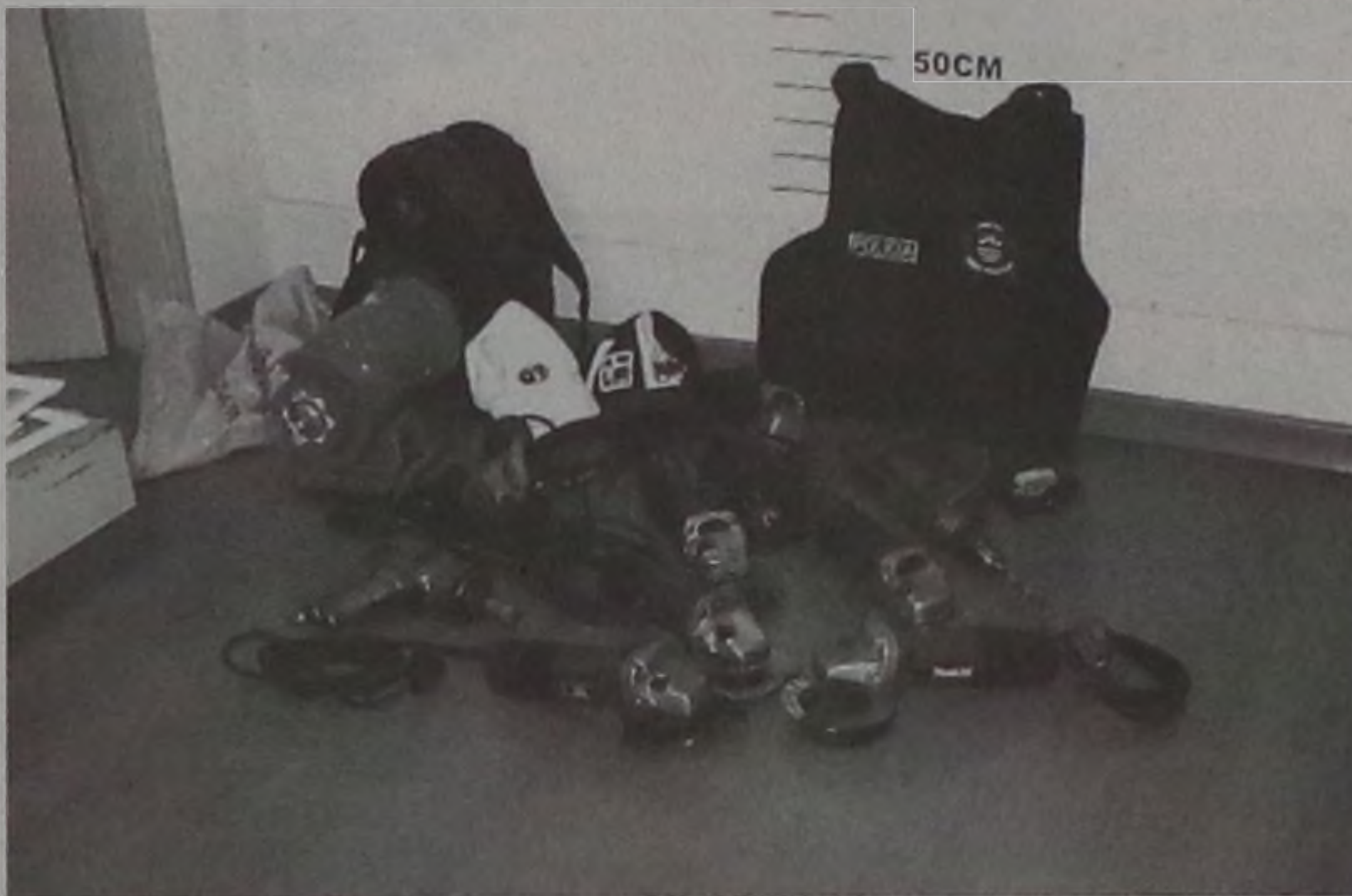
Equipamentos furtados encontrados na casa de acusado de roubo em Lençóis

Com um mandado de busca e apreensão, os policiais entraram na residência de Bui, localizada no Jardim Santa Angelina. Ele não resistiu à prisão. Na casa foram encontrados máquinas furtadas de uma indústria de implementos agrícolas de Agudos. Em cima da cama do acusado estavam sete lixadeiras, uma furadeira, um aparelho de esmeril e uma parafusadeira pneumática. As máquinas foram reconhecidas pelo proprietário da indústria localizada na rodovia Marechal