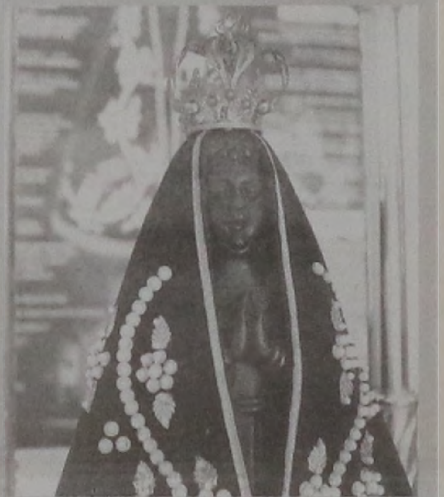
Imagem de Nossa Senhora Aparecida

No dia 19 de setembro, tem show de prêmios beneficente no Lions Clube de Lençóis Paulista. Um torneio de truco marcado para o dia 21 de outubro encerra a programação da festa. As disputas começam às 8h, no salão da igreja.