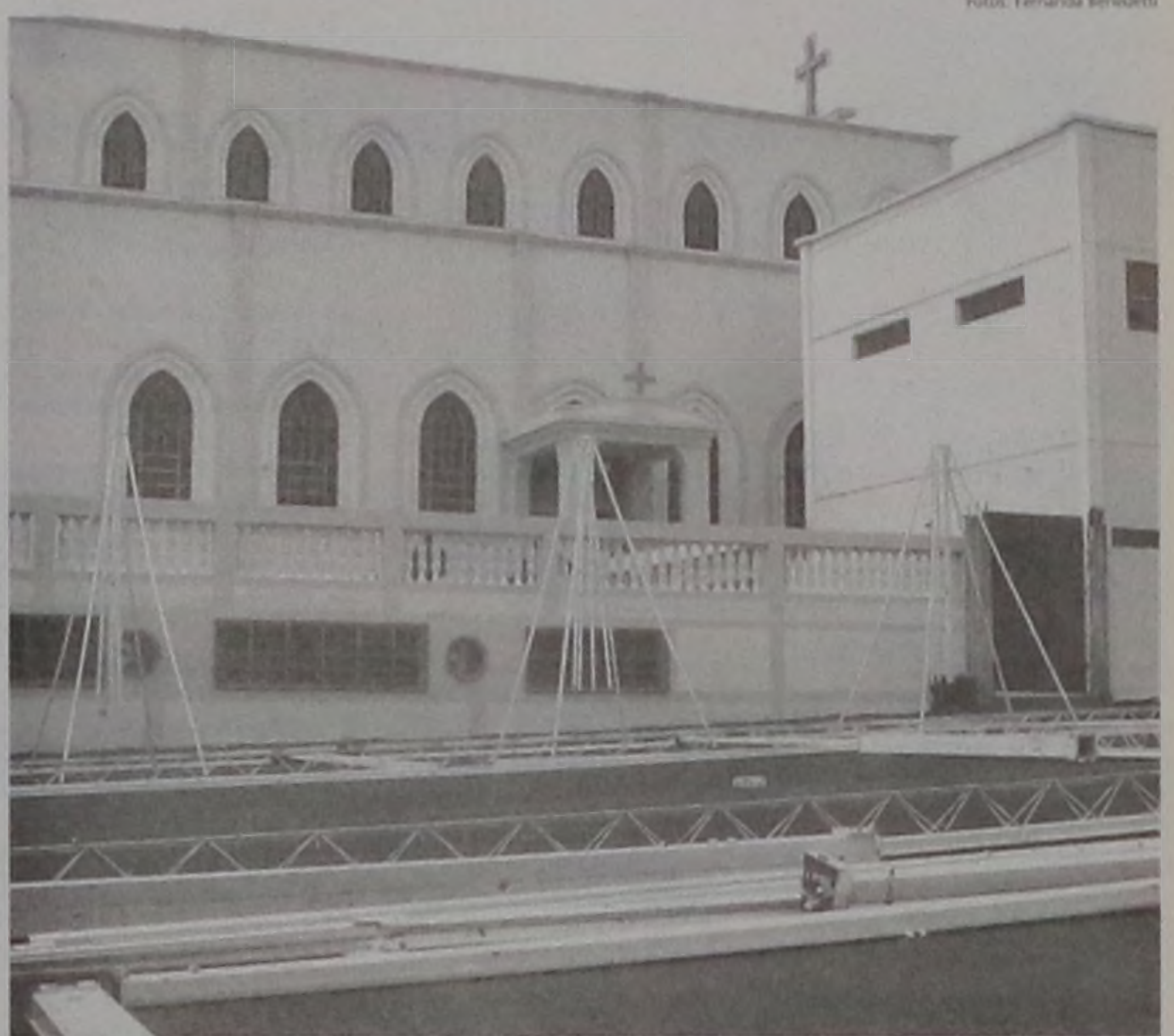
Renda arrecadada com a festa da padroeira será usada para concluir a reforma da igreja