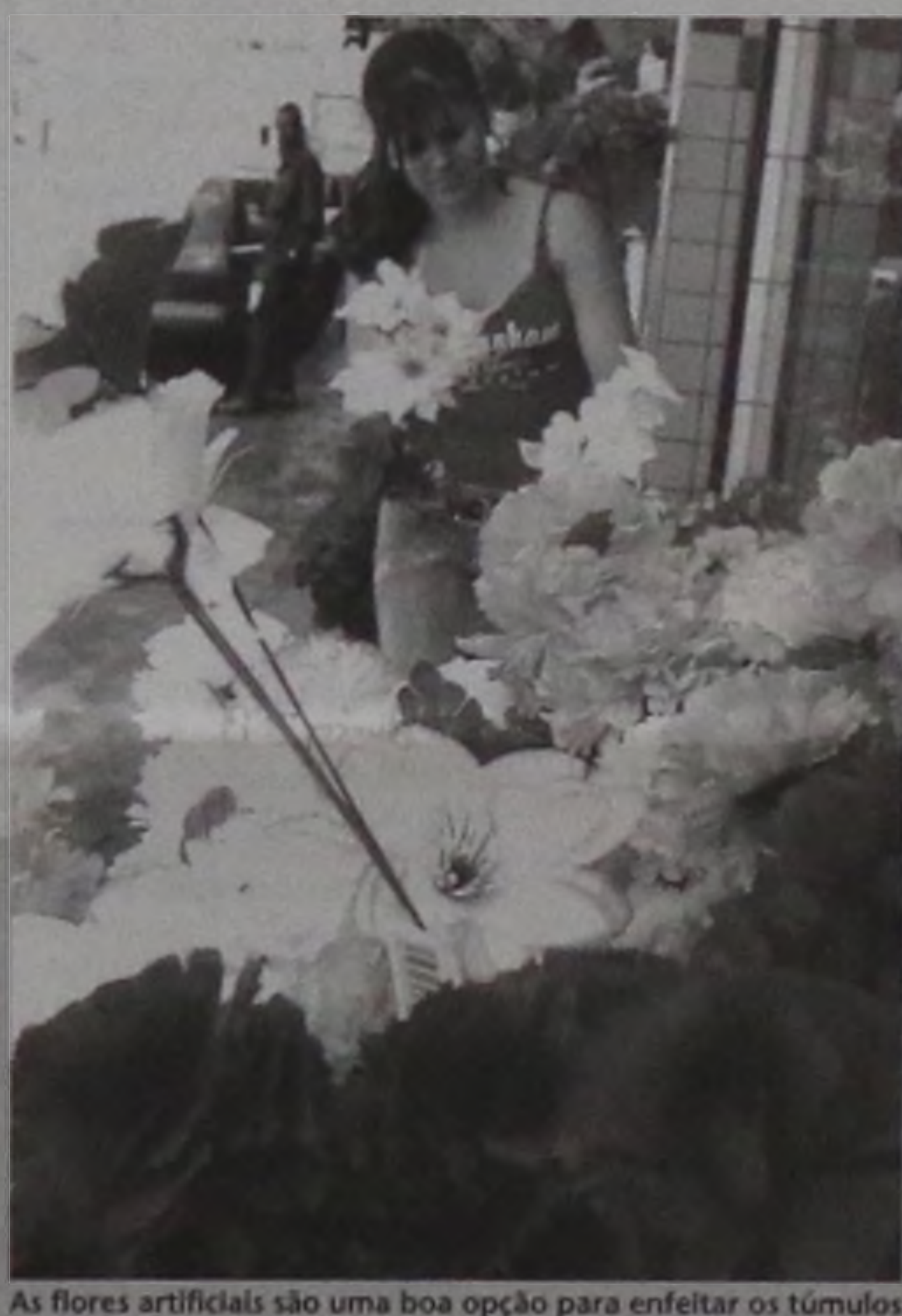
As flores artificiais são uma boa opção para enfeitar os túmulos