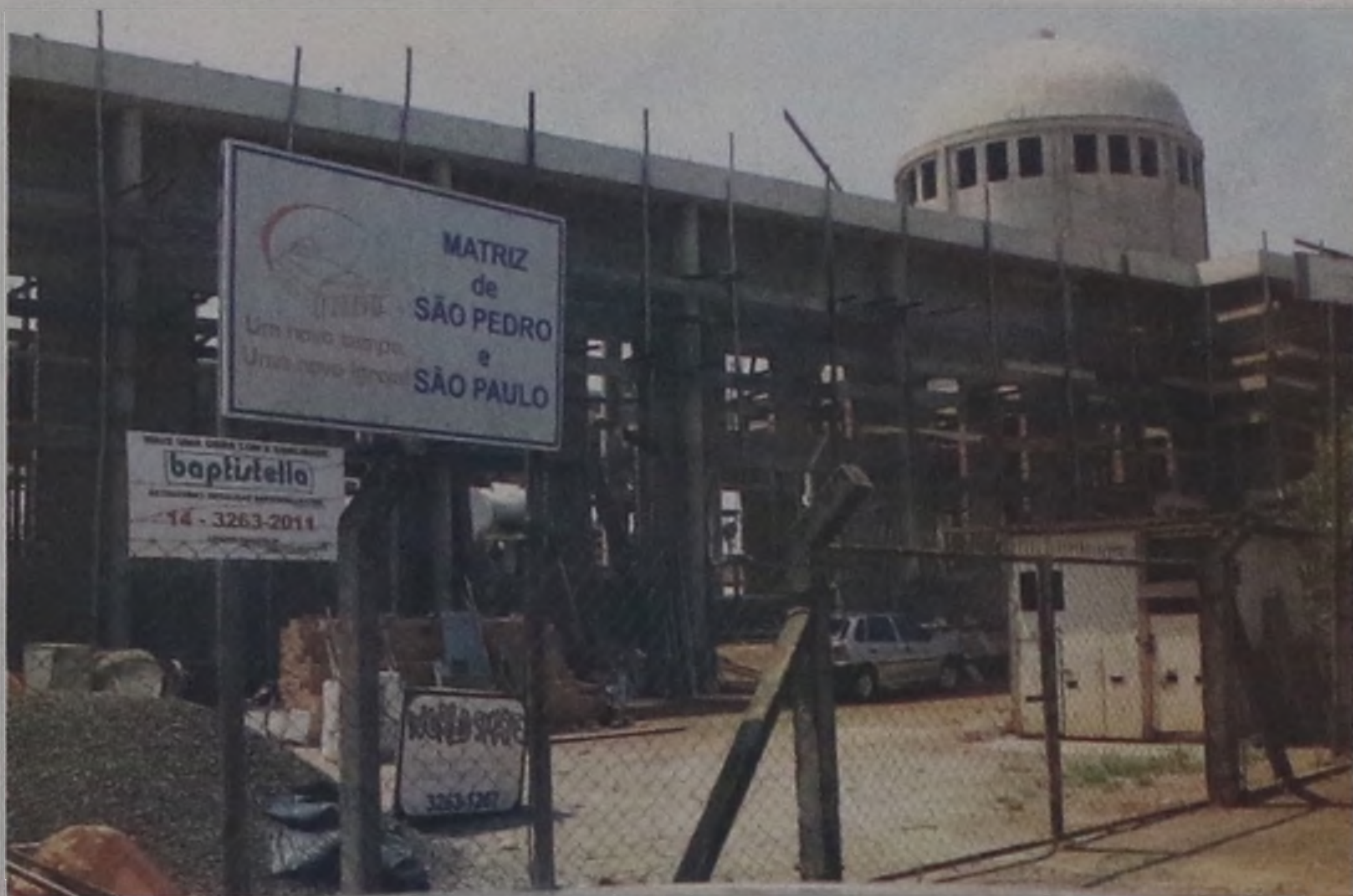
Toda a renda da Festa do Milho vai para as obras da nova matriz de São Pedro e São Paulo que não tem prazo para ser finalizada

Os visitantes terão a oportunidade de saborear uma dezena de produtos feitos à base de milho verde. Tem pamonha, cuscuz, suco, curau, sopa de milho, licor de milho, milho cozido, bolo, pastel,