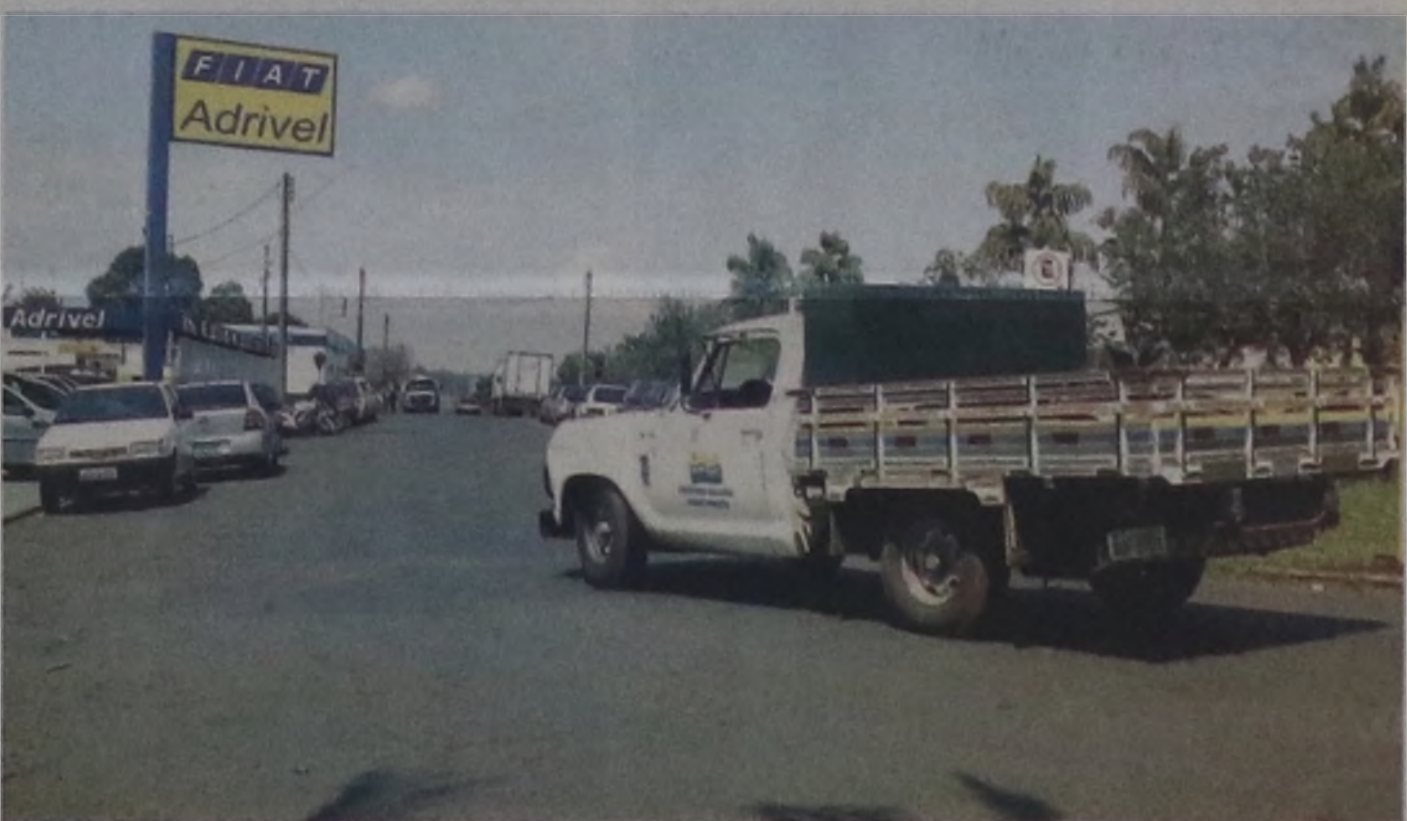
A rua José Paccola vai ser mão única no sentido centro/bairro na quadra que dá acesso a Adrive!; mudança vale a partir de amanhã

A alteração está sendo feita dentro do projeto de reordenamento do fluxo de veículos, que o Demutran vai implantar após a liberação da ponte construída para interligar as ruas Lúcio de Oliveira Lima, na Vila Antonieta, e Adriano da Gama Cury, na Cecap. A rua Lúcio de Oliveira Lima começa na rotatória e vai receber o fluxo em direção à ponte que dará ligação à Cecap e aos bairros da região, como o Jardim Monte Azul.