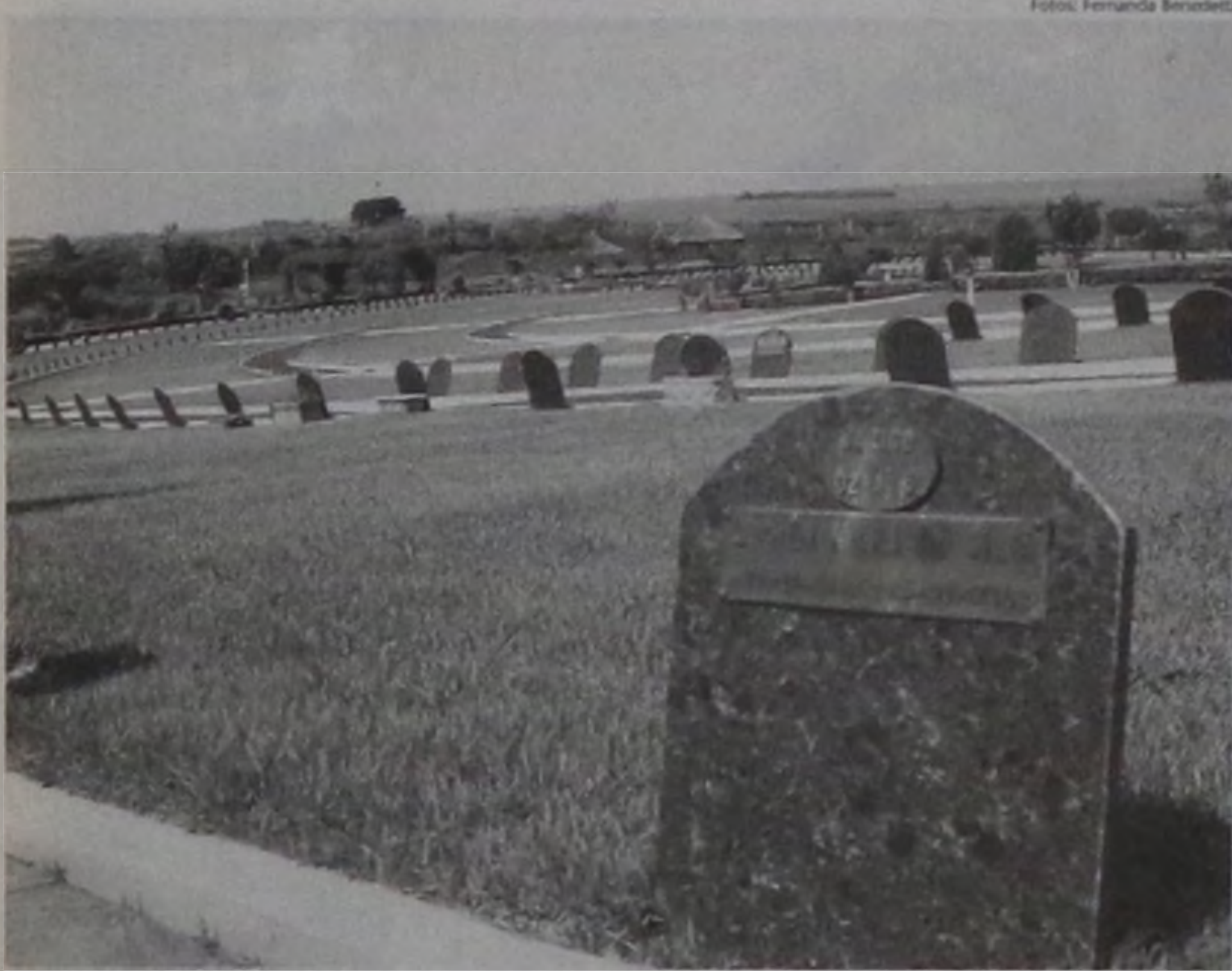
Cemitérios de Lençóis Paulista e região terão várias missas amanhã

No feriado de finados estão programadas seis missas e um culto ecumênico nos cemitérios de Lençóis Paulista