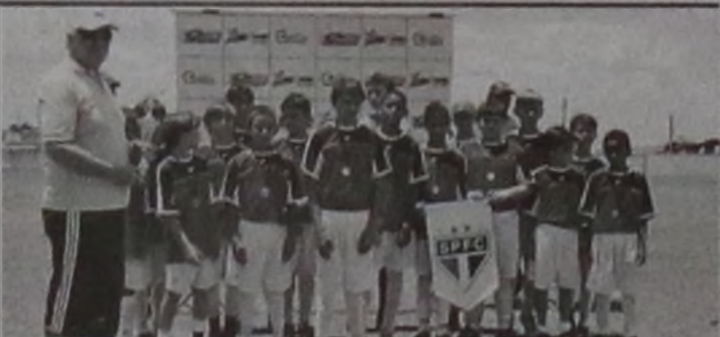
A equipe do São Paulinho que bateu o Progresso A por 2 a 1

A equipe Progresso A perdeu para o São Paulinho por 2 a 1. Já o Progresso B goleou o Comercial por 7 a 1. Os meninos do GERA bateram o Doça Sports por 3 a 2 e o MAC aplicou a segunda