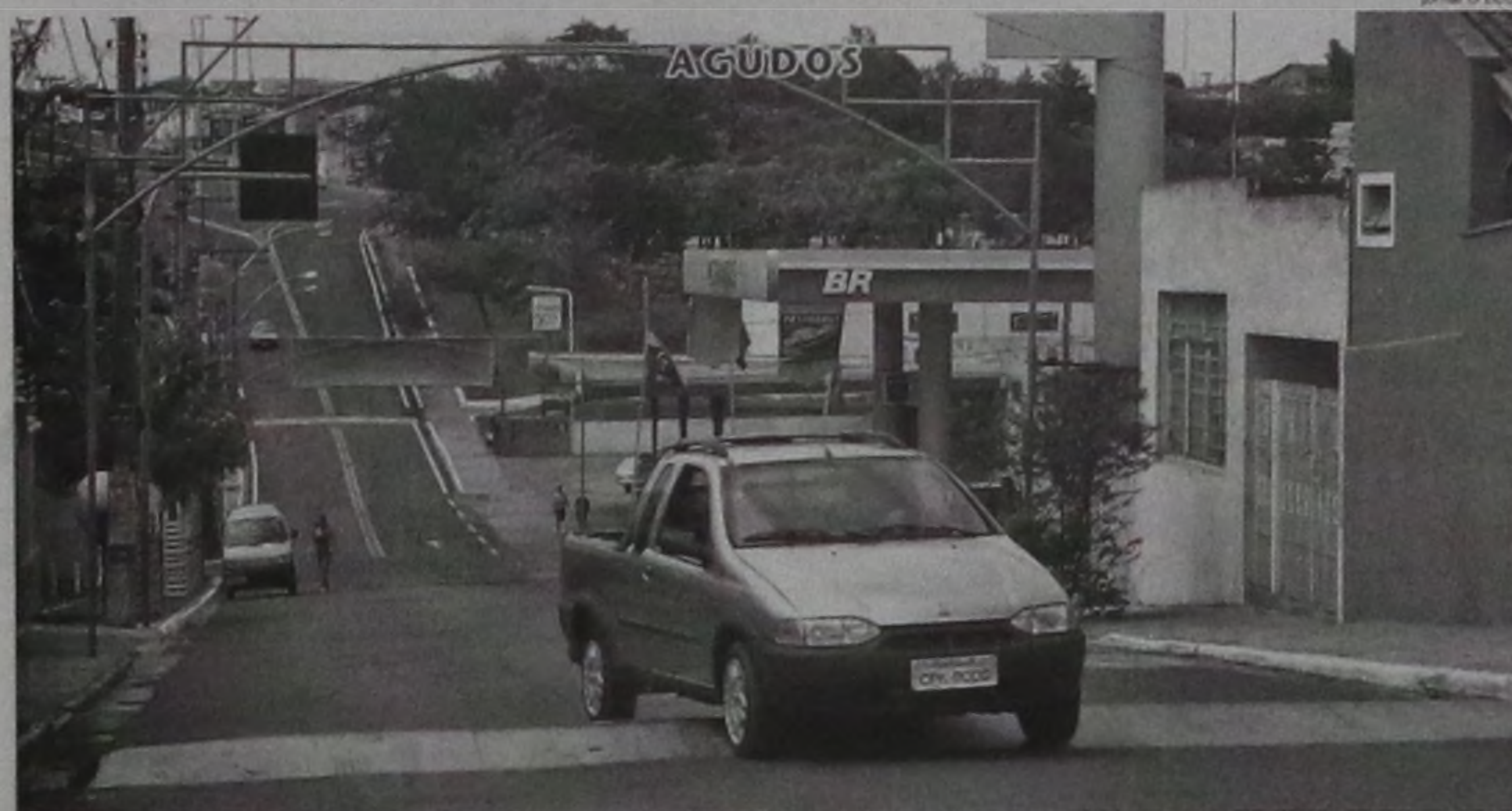
Na rua Sete de Setembro, as lombadas não resolvem o problema do trânsito