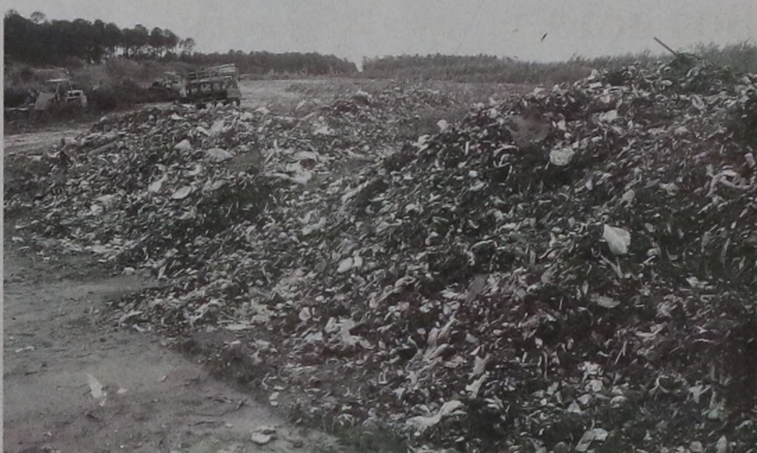
Prefeitura de Lençóis Paulista quer transformar lixo orgânico em créditos de carbono; projeto está em fase de implantação

O diretor de Meio Ambiente explica o processo. "Os resíduos orgânicos vão para as leiras e são degradados pela ação de microorganismos. Quando a degradação ocorre sem a utilização de oxigênio, ela é chamada de anaeróbia e nestas condições ocorre a formação de gás metano e gás carbônico. Quando a degradação ocorre com a utilização de oxigênio, ela é chamada de aeróbia e, neste caso, não forma gás metano, apenas gás