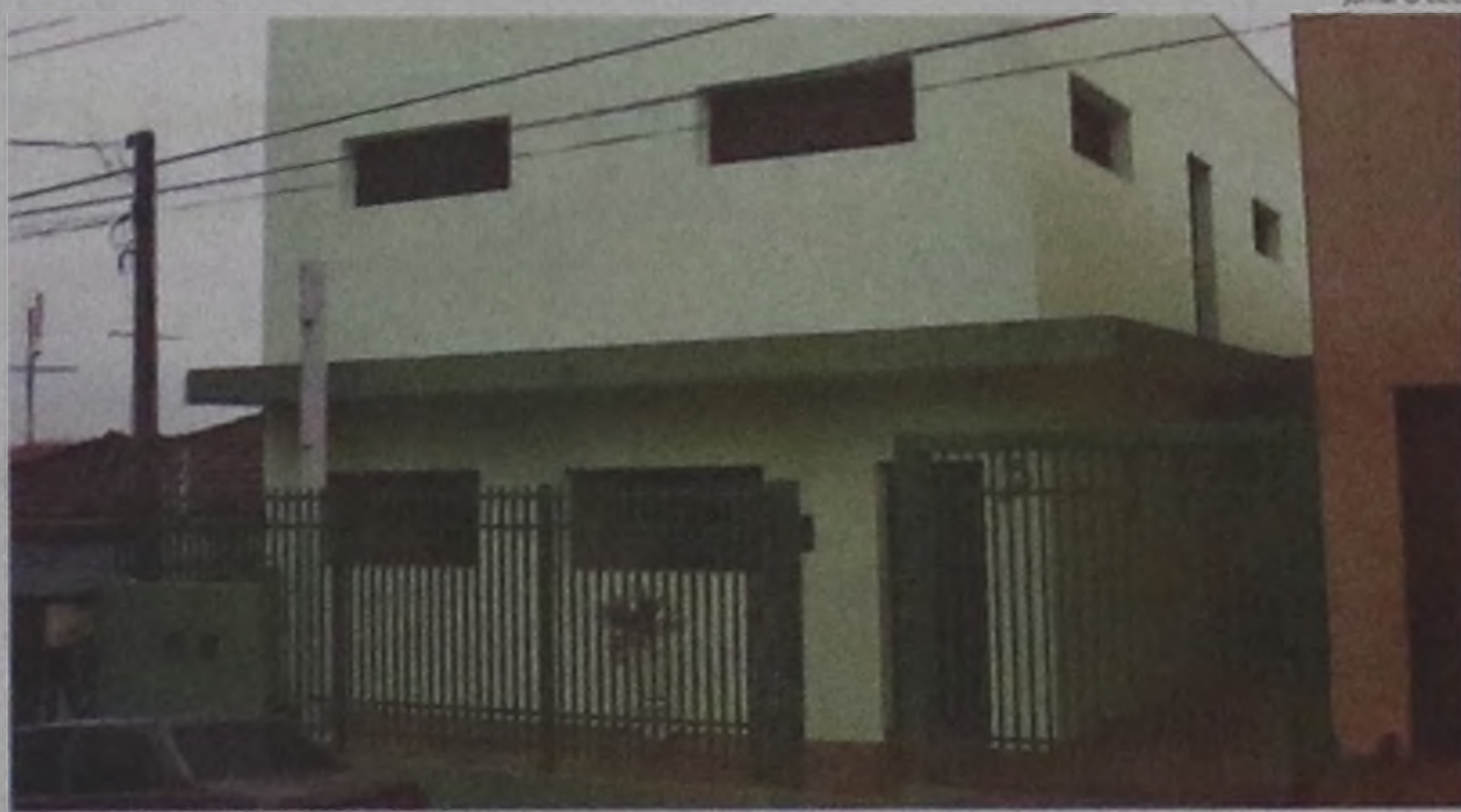
Fachada da Associação Comercial de Macatuba que coloca campanha de final de ano nas ruas