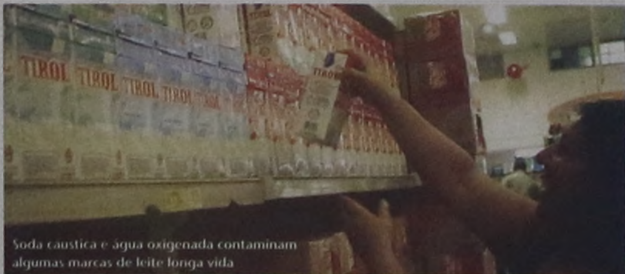
Soda cáustica e água oxigenada contaminam algumas marcas de leite longa vida