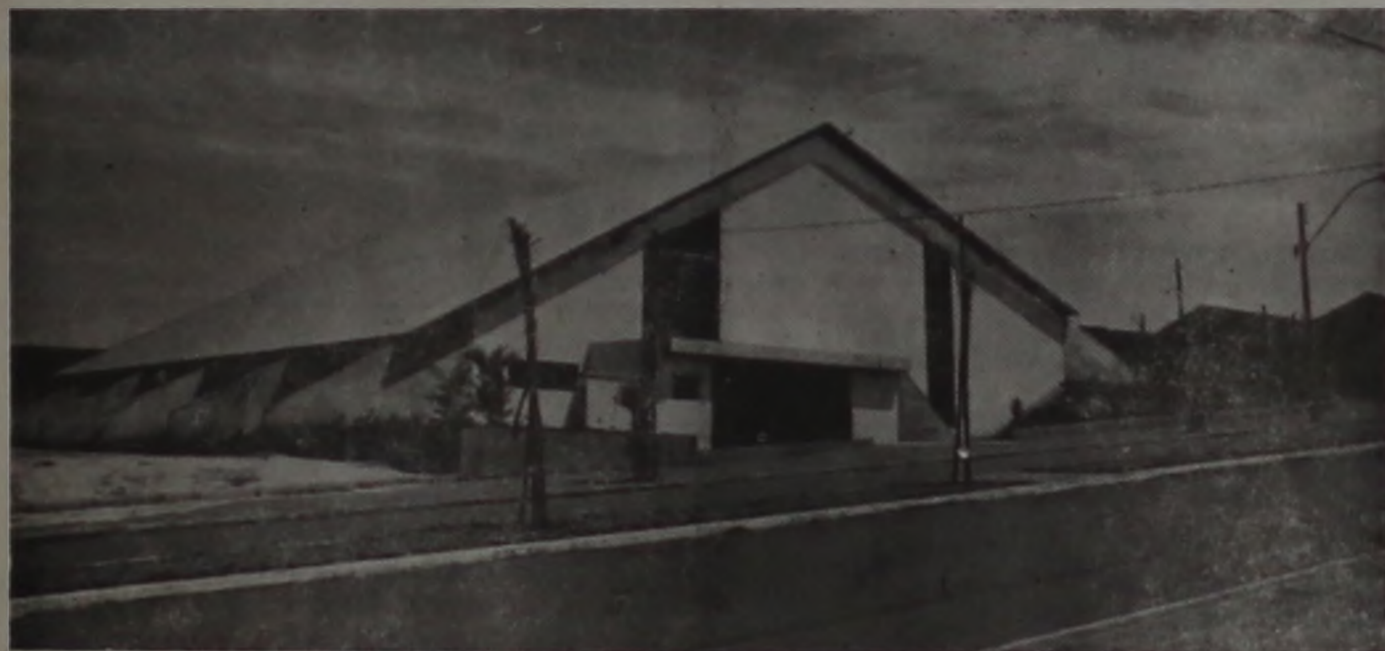
O Centro de Lazer do Trabalhador (Toniquinho) pode abrigar bailes populares animados por banda carnavalesca

O carnaval popular em Lençóis terá bailes em recintos fechados com portas abertas ao público. A decisão do prefeito Pradinho deve-se à