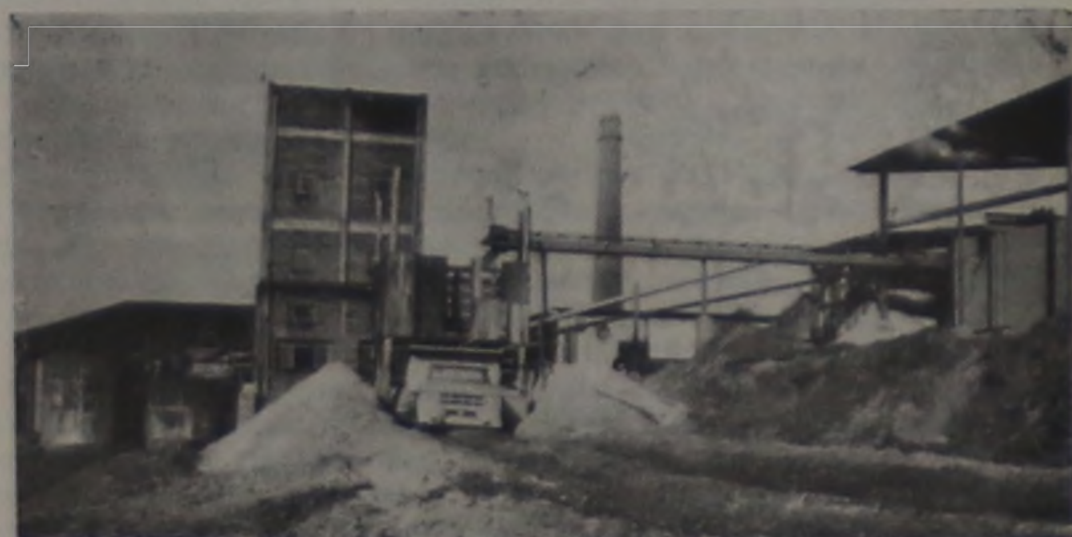
Lençóis já possuiu dezenas de engenhos e ficou famosa pela qualidade da cachaça aqui produzida.

Pouca gente sabe que a cachaça, também chamada de pinga, ou caninha, é a bebida destilada de maior consumo em todo o mundo. Um produto tipicamente brasileiro, sua produção é de 1,3 bilhões de litros por ano e supera até o volume de fabricação de uísque pela Escócia, que é de 1,2 bilhões de litros.