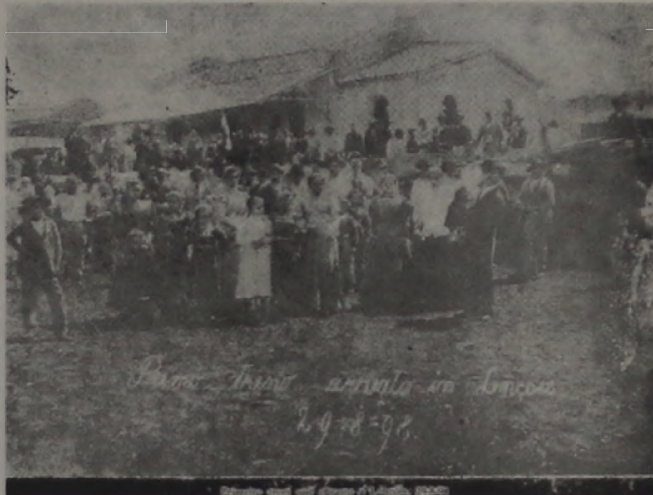
Solenidade de inauguração do primeiro trem que chegou a Lençóis, em 29 de agosto de 1898.

Desde 1835, o Governo Imperial brasileiro já intencionava construir estradas de ferro no Brasil. Mas a idéia não saía dos projetos. Assim, a primeira estrada de ferro brasileira, a E. F. Leopoldina, só foi inaugurada em 1854. Após essa, muitas outras surgiram, contando o Brasil em 1860 com 208 Km de estradas de fer-