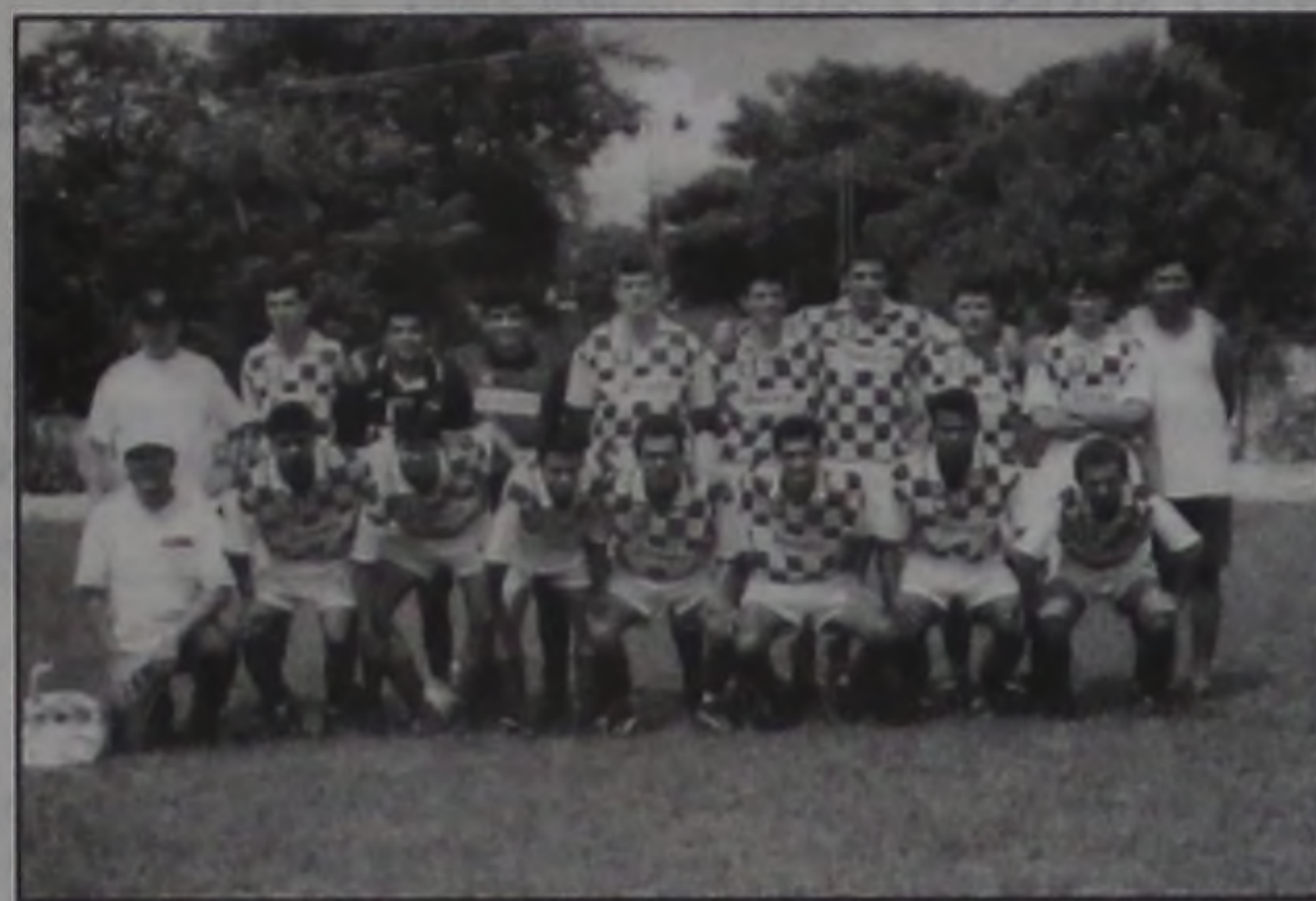
ADC-ZL: Goleada na primeira partida das semifinais