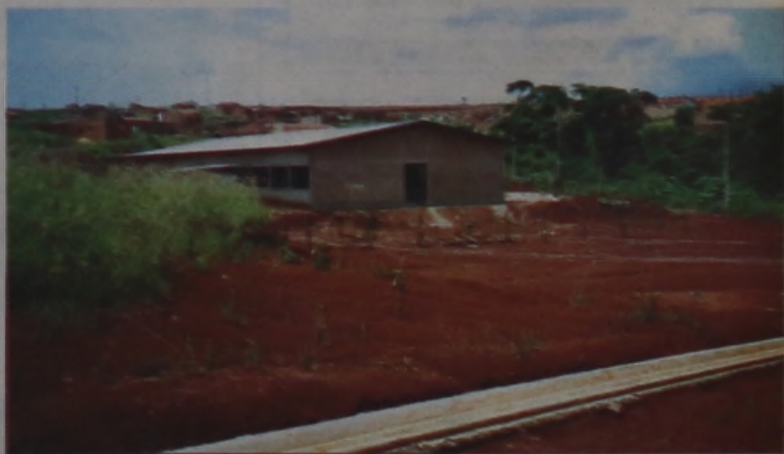
escola no Jardim Monte Azul

O prefeito José Prado de Lima ressalta que a Lei 2574/97, de sua autoria, que disciplina a implantação de toda a infra-estrutura básica (guias, sarjetas, iluminação e asfalto). Pradinho destaca, também, o entendimento mantido com a comunidade, empresas e o Legislativo, na busca de soluções para os problemas do município.