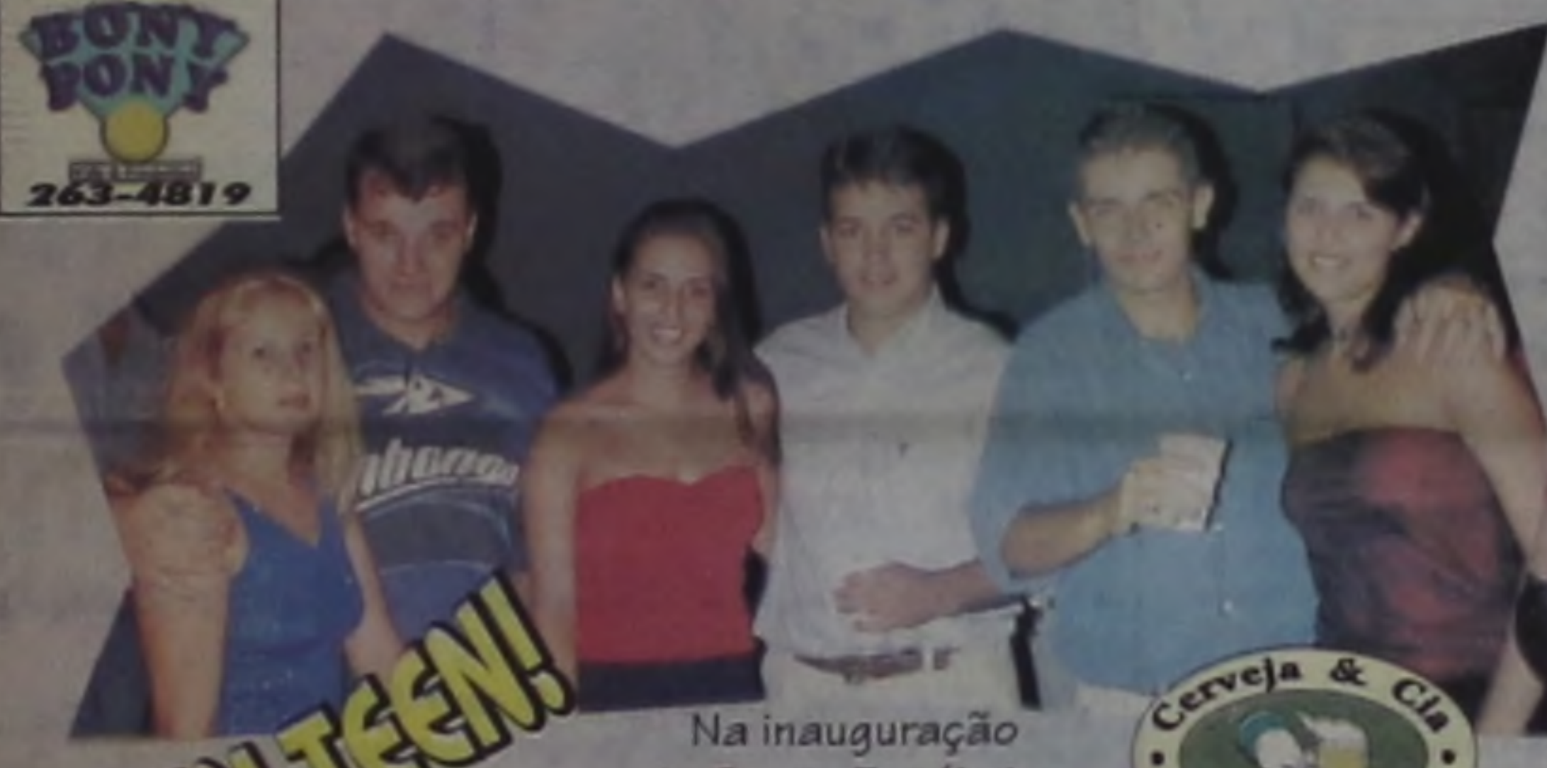
Na inauguração da Boate Estábulo