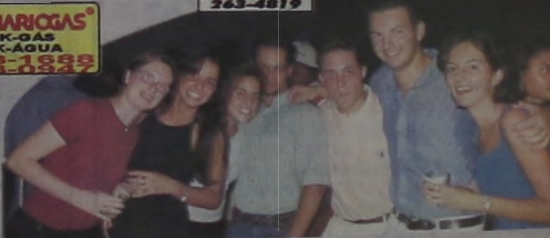
A galera agitou na noite.