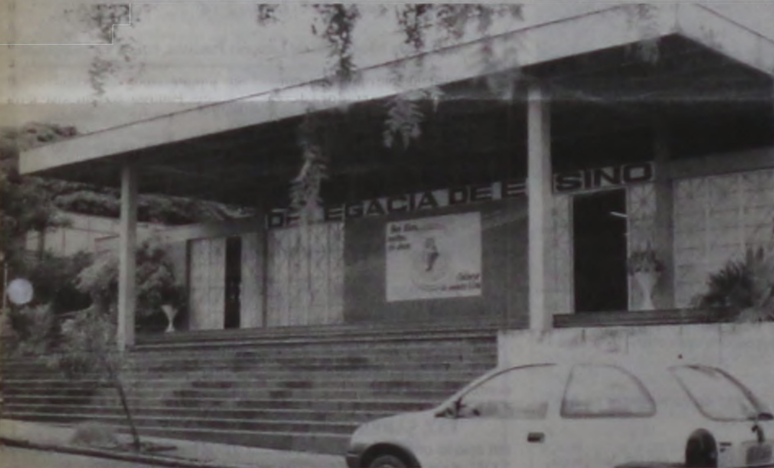
Delegacia de Ensino de Lençóis Paulista, responsável pelos municípios de Borebi e Macatuba

Macatuba consegue avanços consideráveis na educação e Borebi tenta a municipalização da E.E Iracema Leite Silva