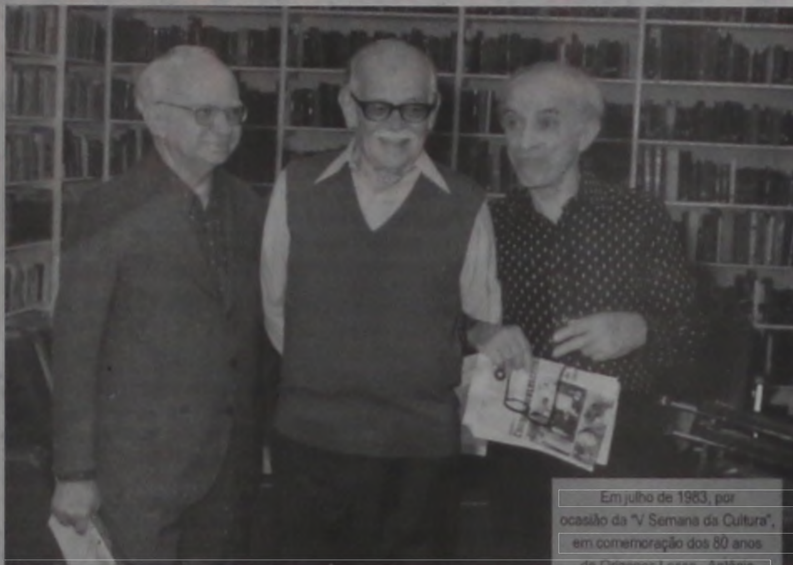
Em julho de 1983, por ocasião da "V Semana da Cultura", em comemoração dos 80 anos de Orígenes Lessa, Antônio Houaiss (segurando o jornal "O Eco"), na Biblioteca Municipal de Lençóis Paulista (BMOL), juntamente com Josué Montello e o próprio homenageado.