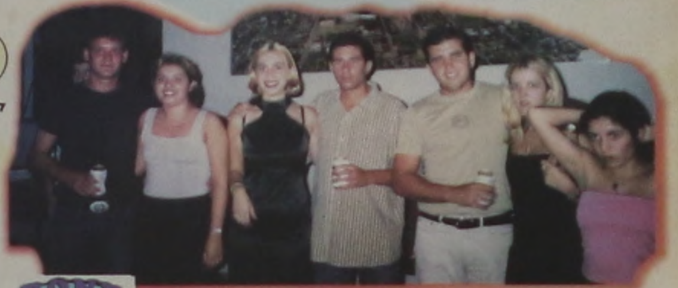
Dançando no CEM - Domingueira com Evidence.