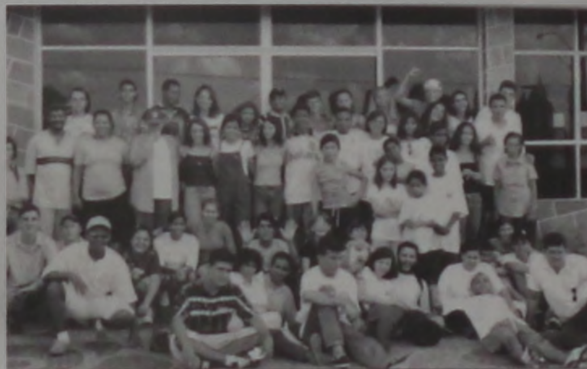
Jovens Unidos em Cristo: confraternização e muito esporte na cidade de Avaré

O Grupo de Jovens JUC (Jovens Unidos em Cristo), da Igreja Santa Lúzia e São Cristóvão da Cecap, realizou no último domingo, na cidade de Avaré, jogos amistosos contra a equipe do grupo de jovens daquela cidade.