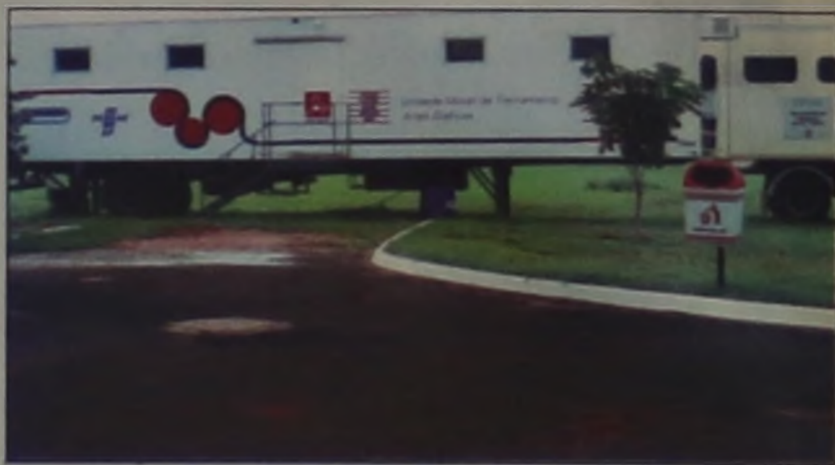
Unidade Móvel de Treinamento: Artes gráficas é uma das mais concorridas do Senai

O curso para pré-impressão, com dez vagas, tem duração de 100 horas e o de impressão, com seis vagas, tem duração de 80 horas, divididas em quatro horas diárias de treinamento, que deverão ser cumpridas em cerca de 20 dias. Os alunos colaborarão com o custo referente ao material.