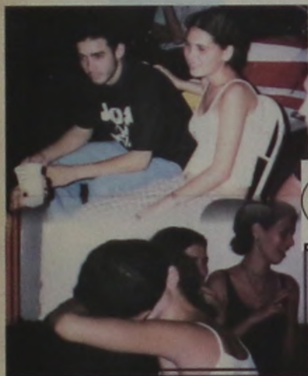
Sem papo... splish, splash!