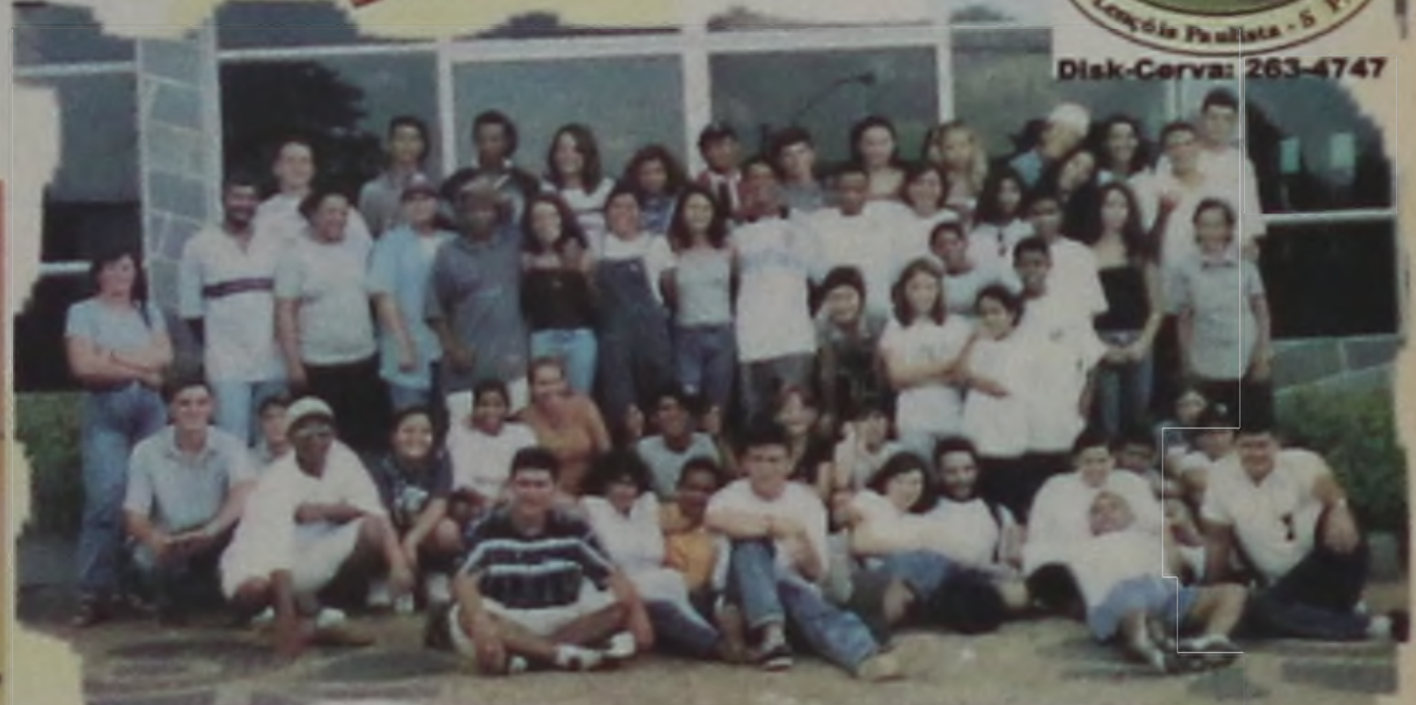
"Andar com fé eu vou, que a fé não costuma falá". Grupo de Jovens "JUC" em Avaré.