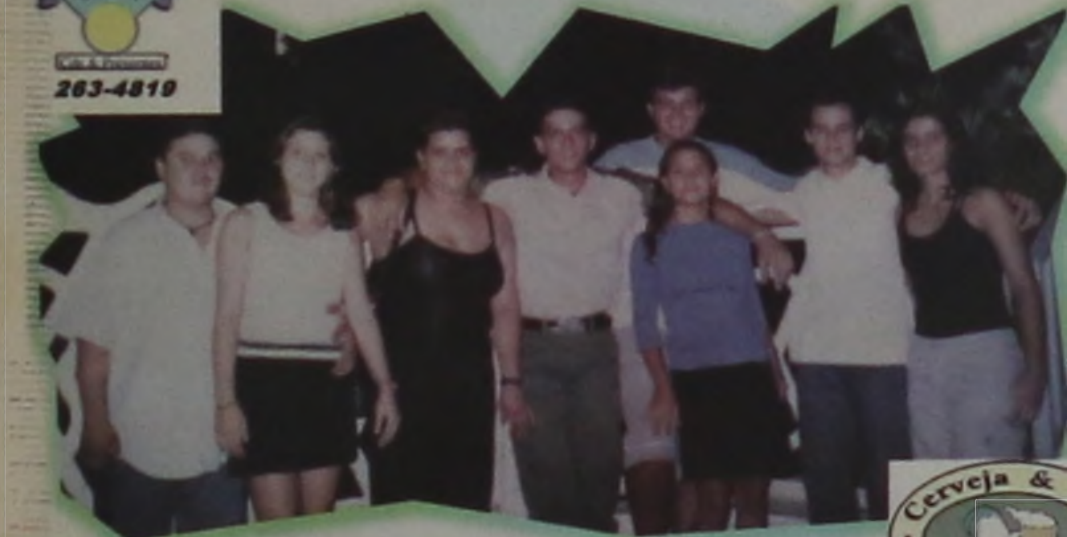
Veja bem! Sem citar nomes, citando-os.