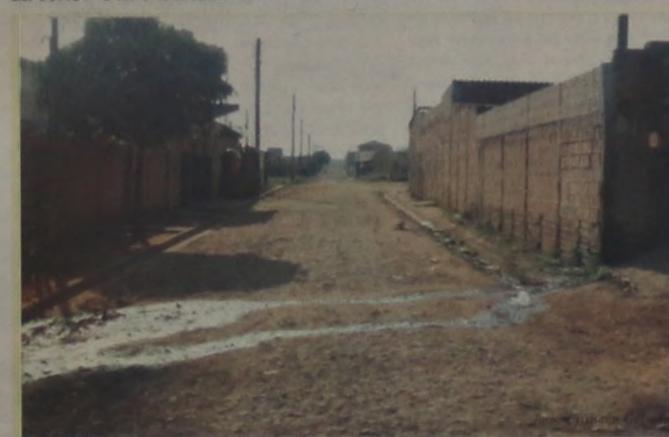
MISÉRIA: “Riquezas são diferentes / Índio, mulato, preto, branco / Miséria é miséria em qualquer canto...” (Miséria, Titãs)