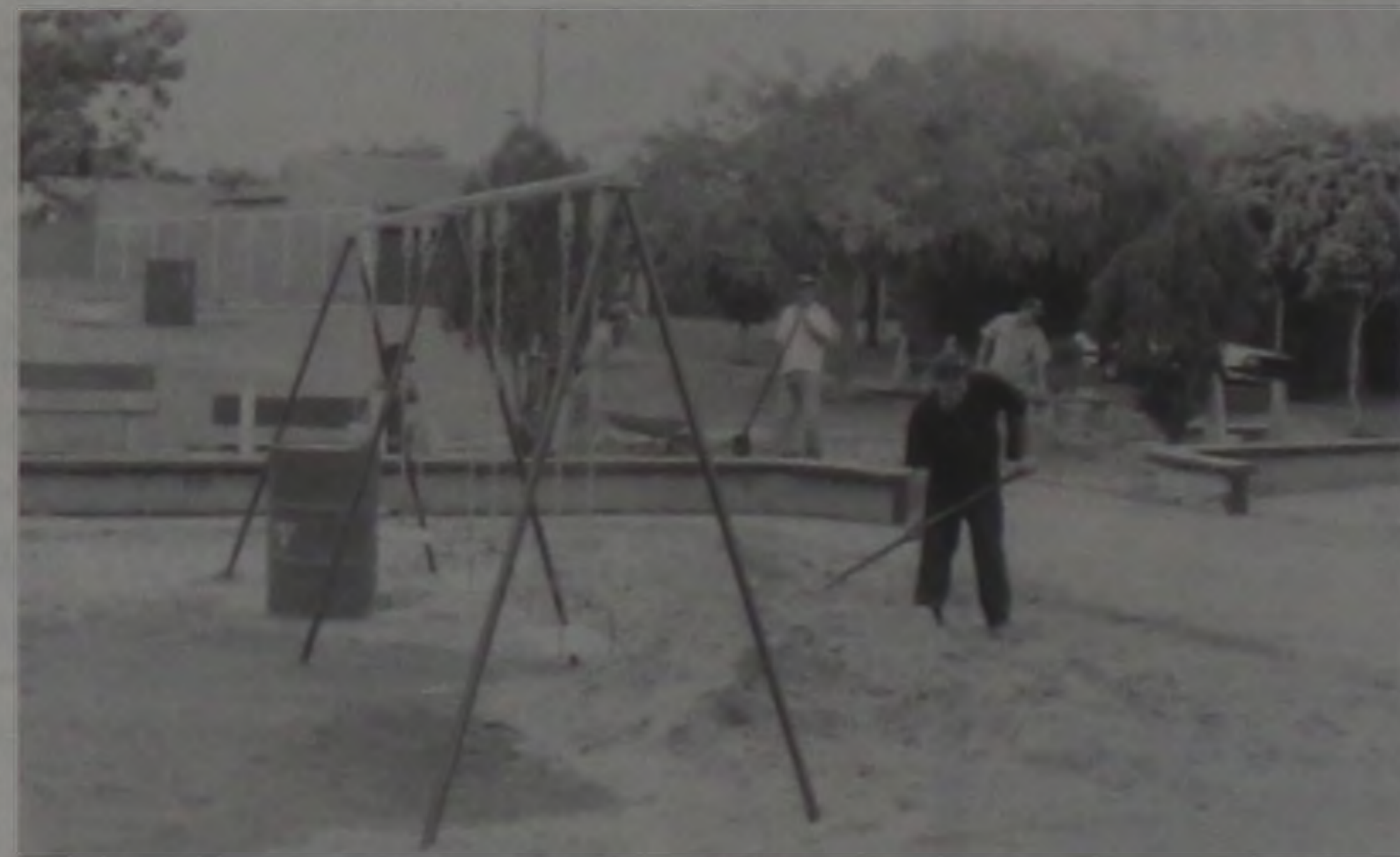
CIDADANIA: Grupo de voluntários fazendo a manutenção de um parque. Esse grupo se reúne todos os finais de semana para esse fim

MACATUBA - Há aproximadamente um mês, um grupo de pessoas dos bairros Jardim Europa e Santa Rita, se reúne nos finais de semana para executar reformas e algumas obras de manutenção em jardins e parques da cidade.