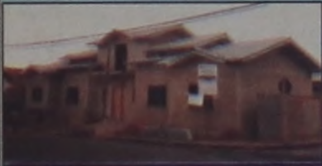
Residência estilo Colonial Americano

A profissional atende em seu escritório à rua Antônio Saens Surita, 80/62 (Prédio Estoril - São Manuel - SP.)