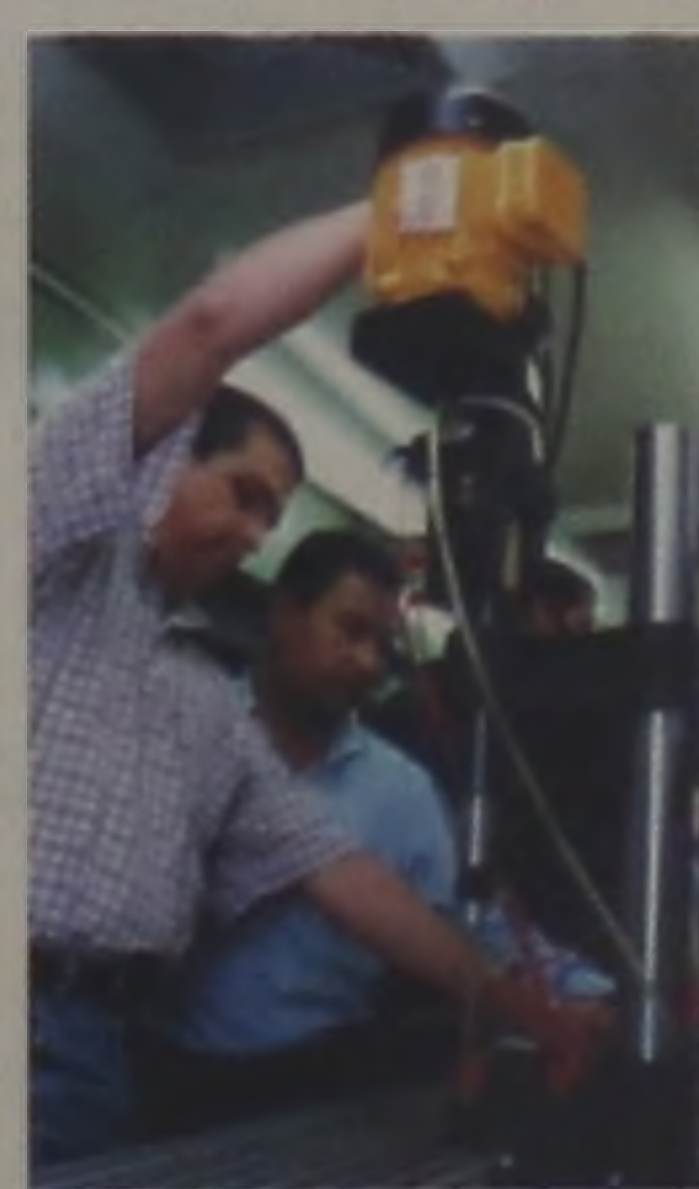
Unidade Móvel de Automação Pneumática, inaugurada pelo Senai/SP em julho. Na página 4, a cobertura da participação do Senai/Lençóis no Fórum Nacional de Lubrificantes