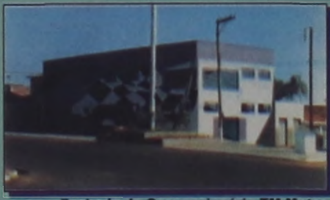
Fachada da Concessionária TM Motos

Vencedora do Troféu Brasil 2.000 como melhor arquiteta (1.999)