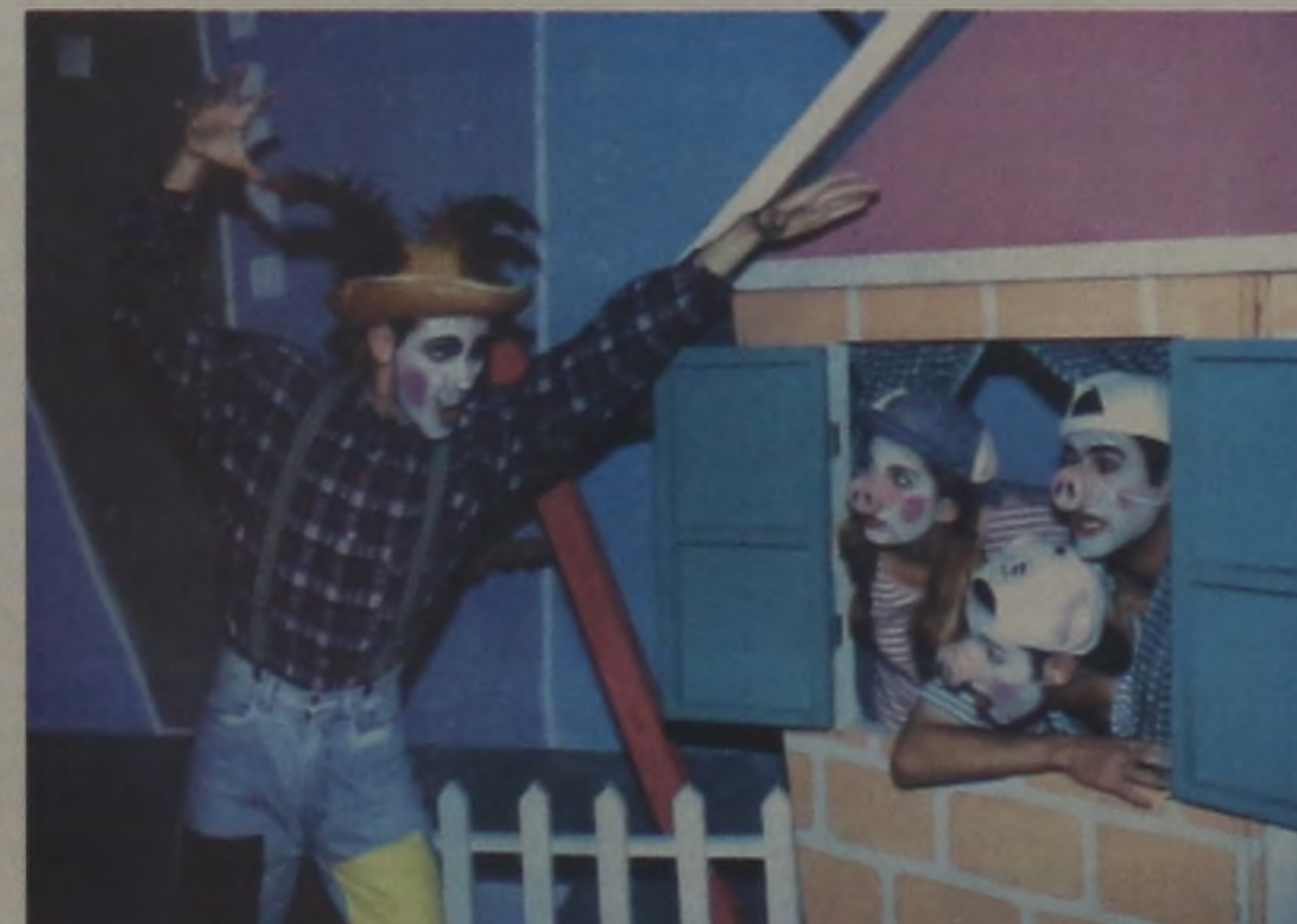
SUSTO: Na janela “Os três porquinhos”, comida para o lobo