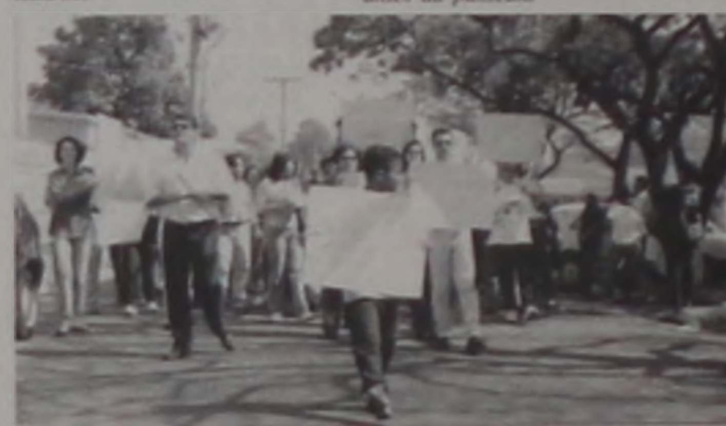
CAMINHANDO E CANTANDO: Carregando cartazes com frases de protesto contra o projeto do governador Mário Covas, os professores estaduais de Lençóis Paulista fizeram a passeata