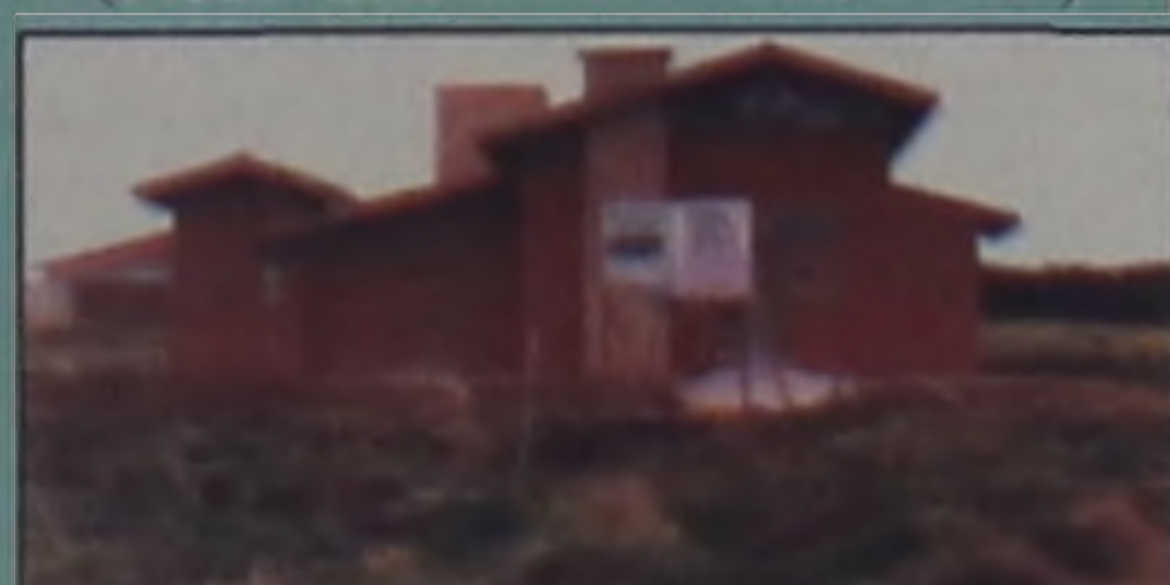
Residência estilo Moderno/Rústico