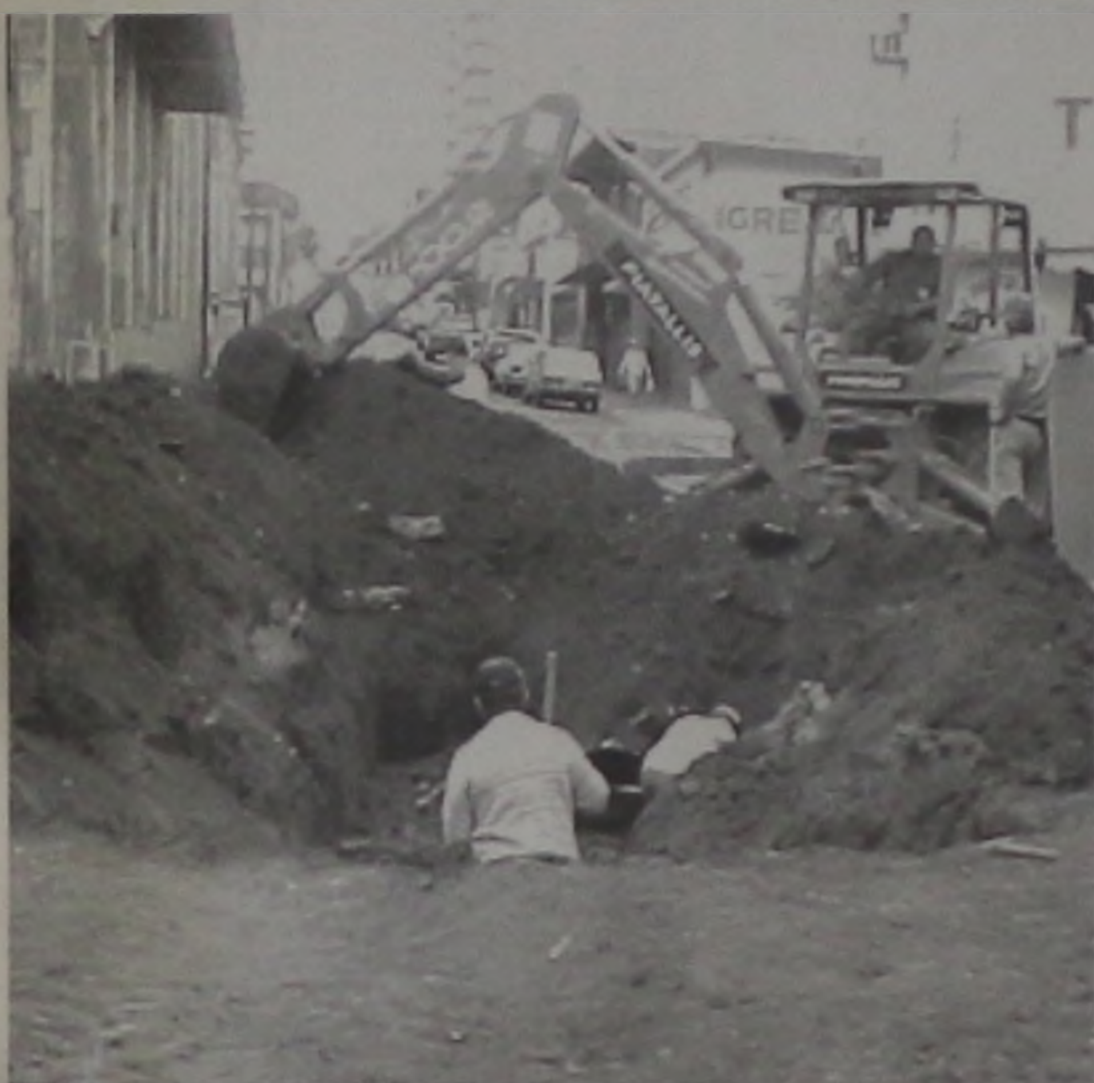
Máquina da prefeitura trabalha na colocação de tubos

Para melhor viabilizar o escoamento das águas servidas do recém inaugurado Jaú Serve, foi necessária a instalação de uma nova rede para essa finalidade. A empresa proprietária dos Supermercados Jaú Serve espontaneamente fez a compra e doação dos tubos aplicados nessa obra. Foram aplicados cerca de 150 m de tubos de 60 e 80 cm de diâmetro, abrangendo os cruza-