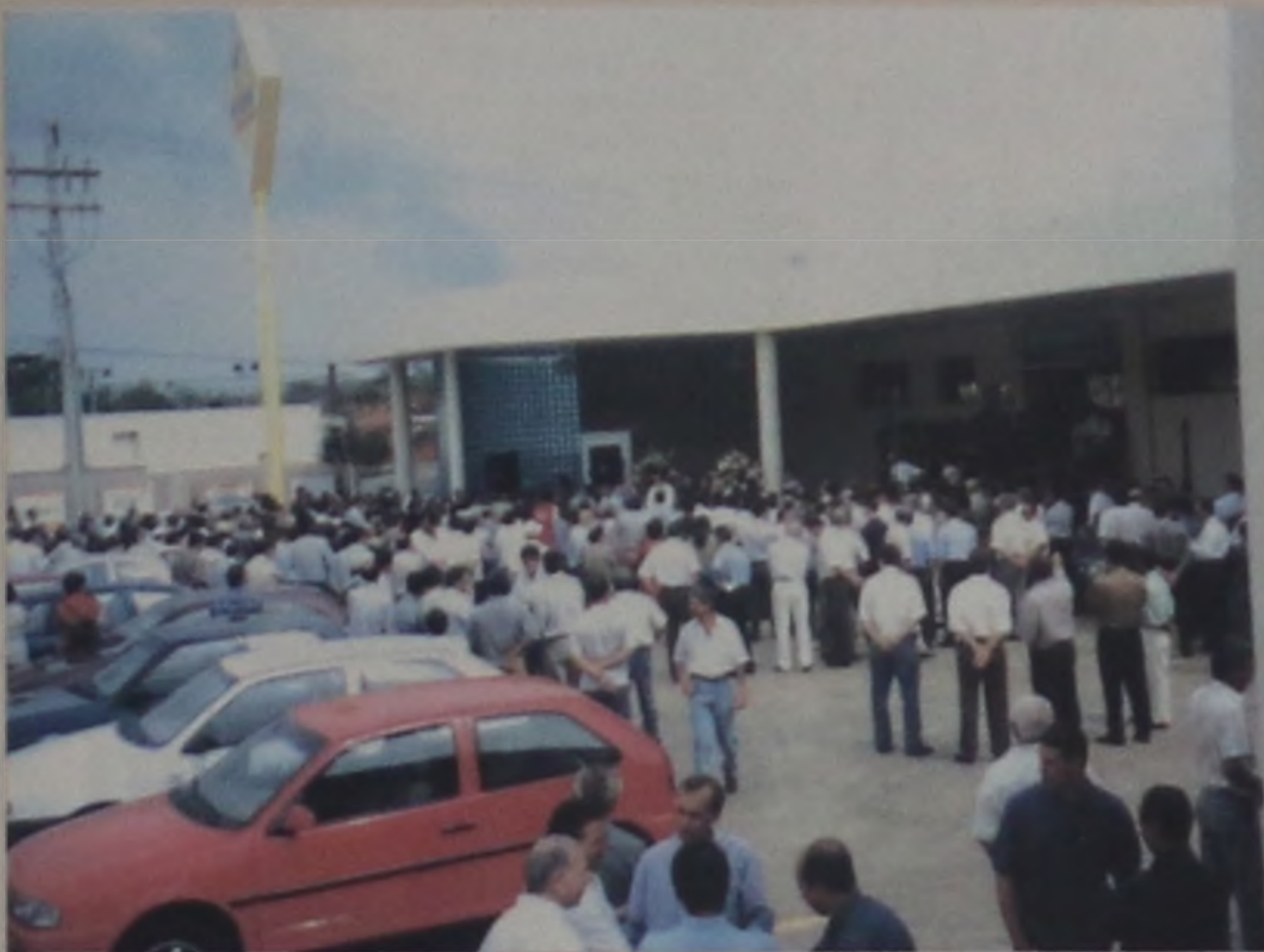
Inúmeras pessoas prestigiaram a inauguração da nova loja