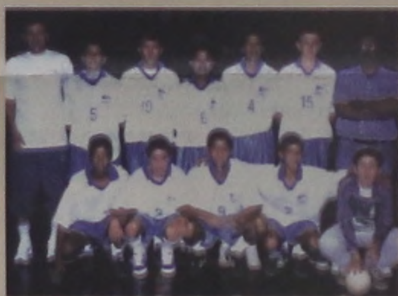
Equipe infantil do Unidos da Cruzeiro