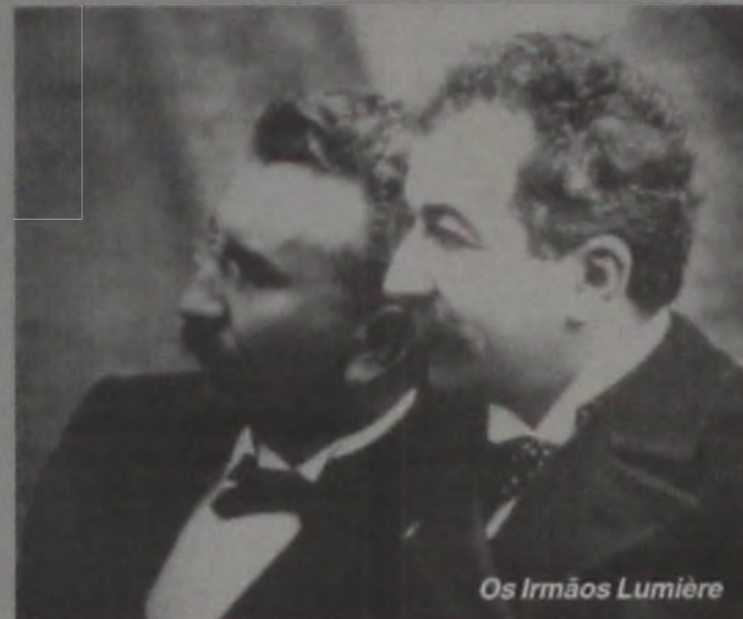
Os Irmãos Lumière

Eu sei (e todos sabem) que ficar vendo filmes em casa pelo vídeo ou TV, tem vantagens óbvias. Mas, esse amigo acha que assim é muito melhor do que nos tempos em que a platéia sofria quando o ar-condicionado do cine estava quebrado, o projetor com defeito, o som desregulado e o lanterninha