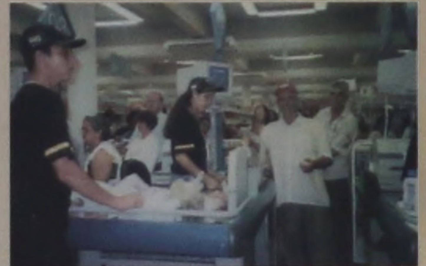
Na inauguração o movimento dos caixas foi intenso durante todo o dia

vo na escolha e aquisição de produtos e serviços, priorizando a qualidade e os preços competitivos. Dentro dessa premissa, a Rede Jaú Serve com esta nova loja, busca atender à comunidade lençoense e da região, com o